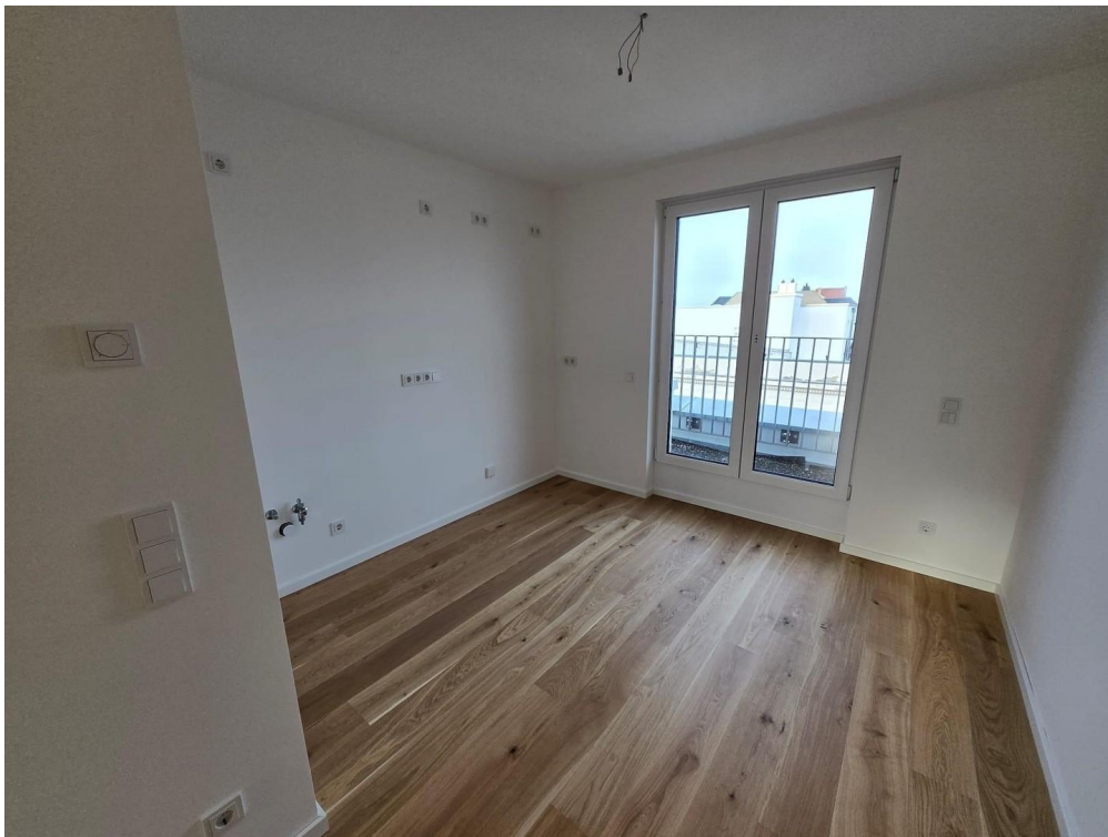
Küche mit Zugang Dachterrasse