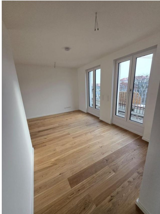
Wohnbereich mit Südbalkon