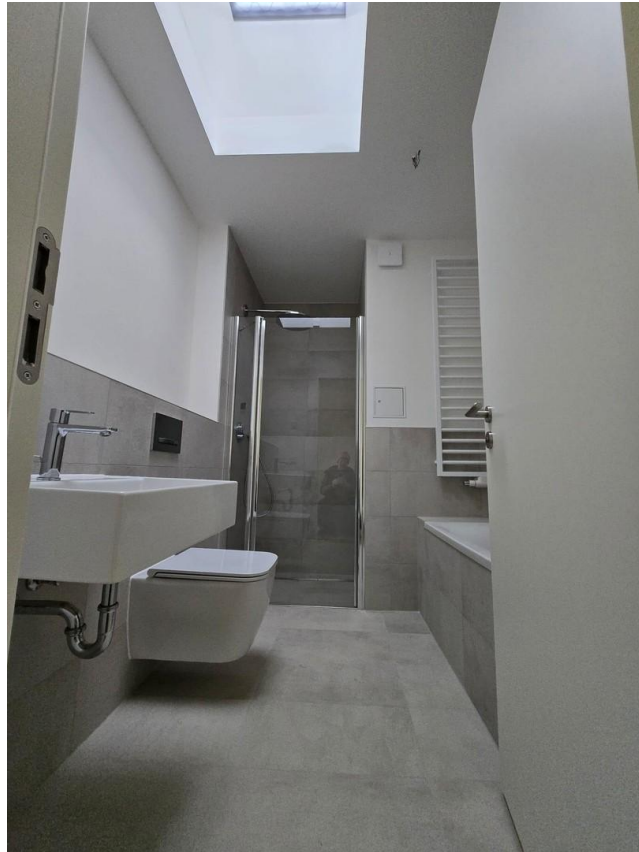
Badezimmer mit Dachfenster