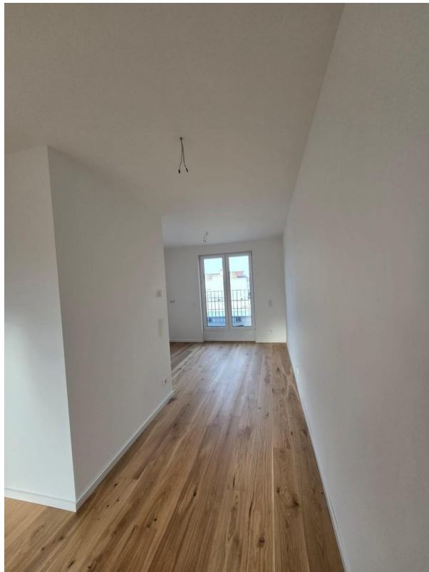
Wohnbereich und Küche