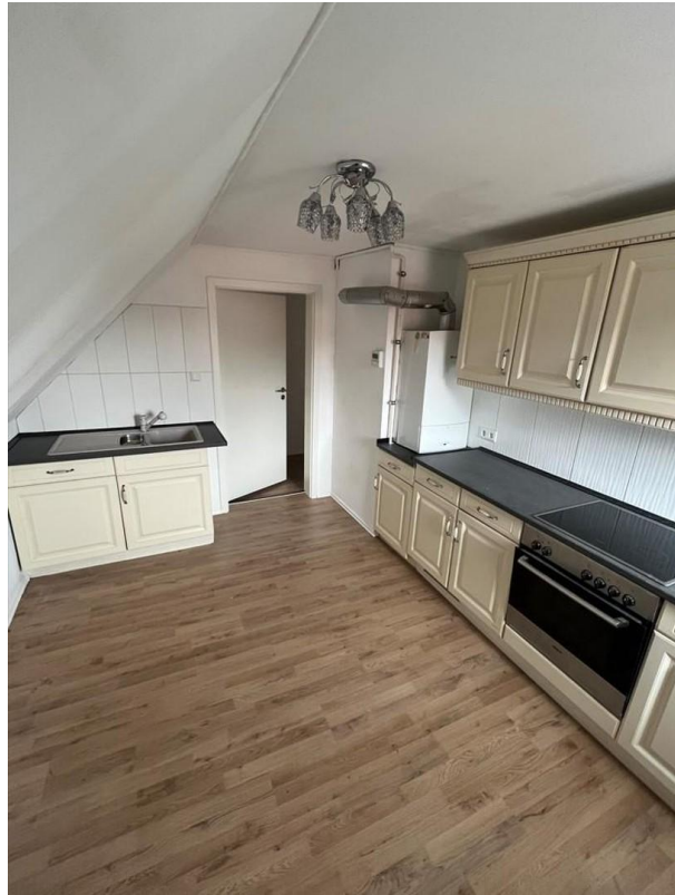
Küche WHG 2. OG