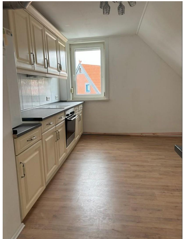
Küche WHG 2. OG