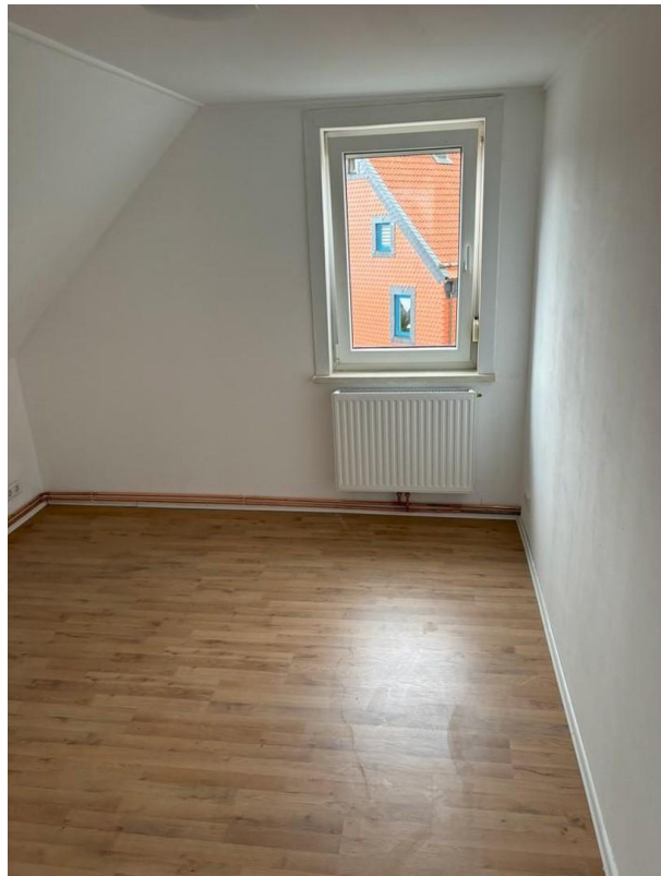
Schlafzimmer WHG 2. OG