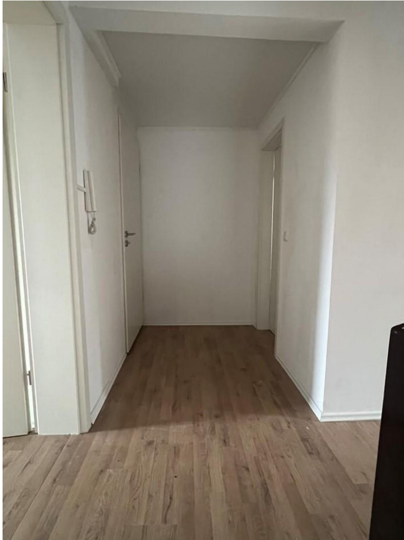
Flur WHG 2. OG