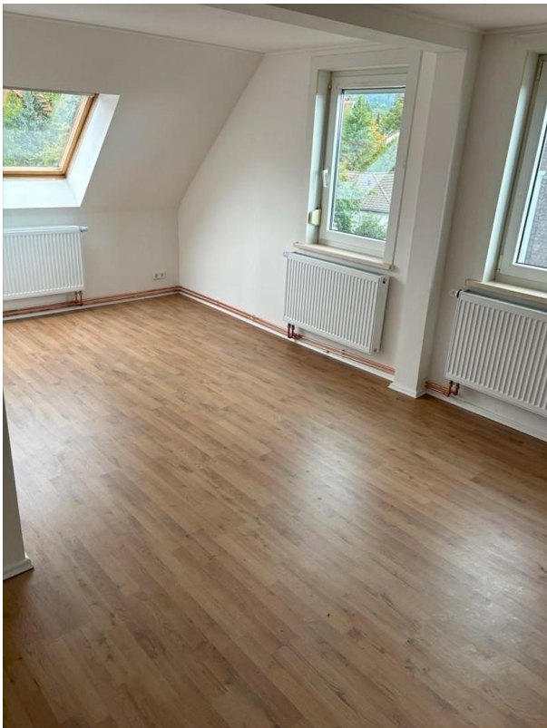
Wohnzimmer WHG 2. OG