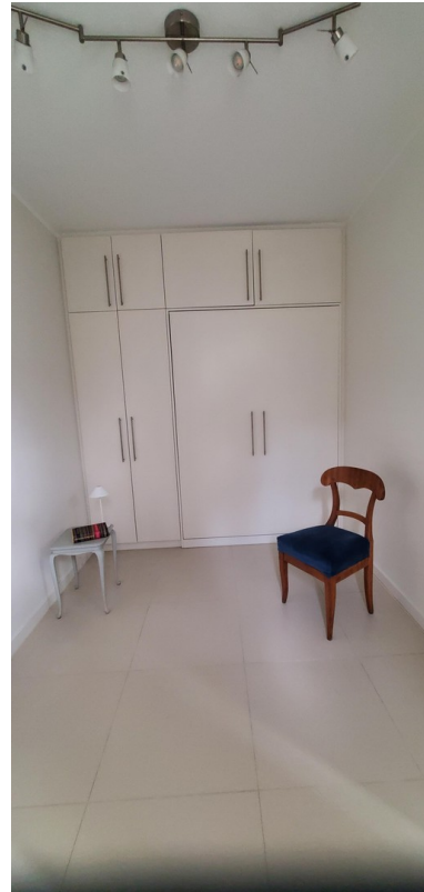
...mit eingeklapptem Gastbett