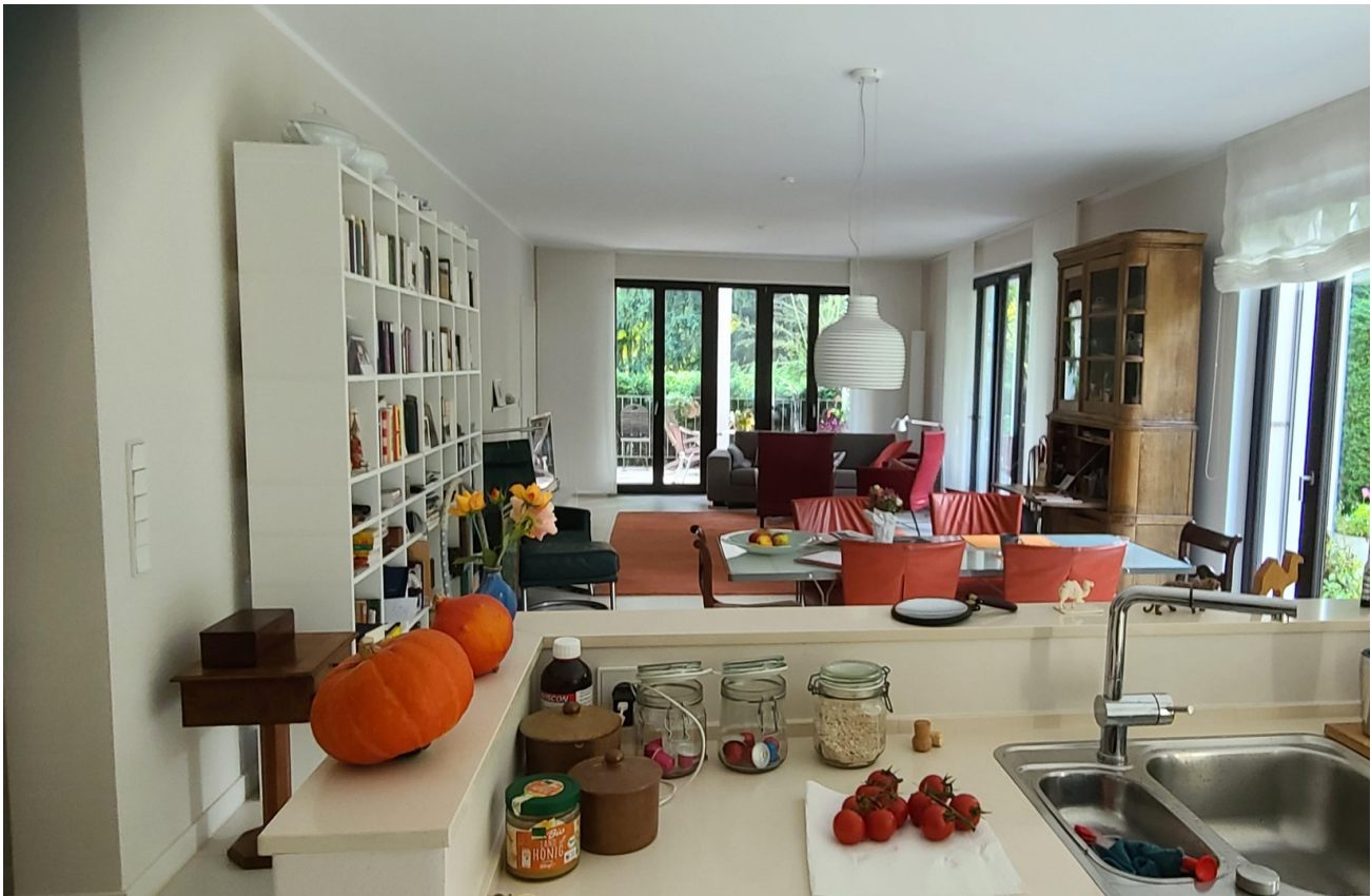
von der anderen Seite