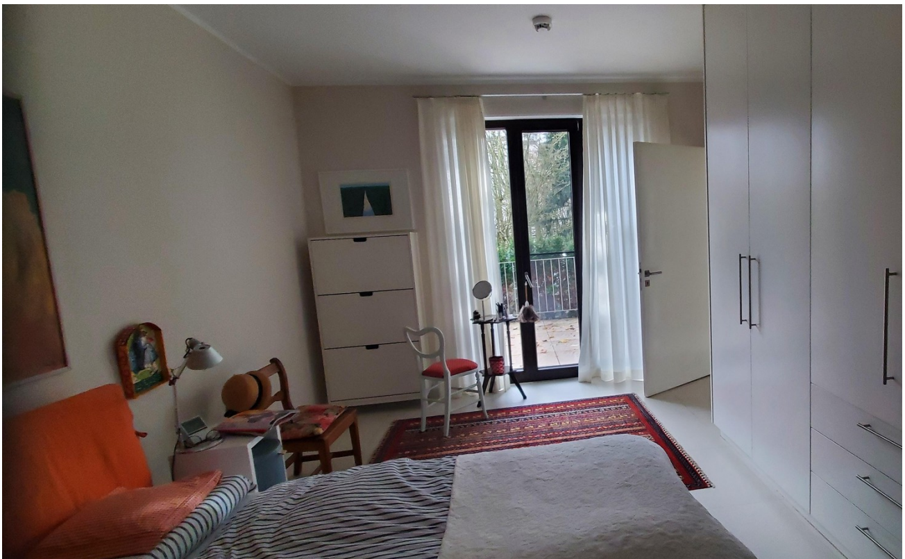
Schlafzimmer mit Morgensonne