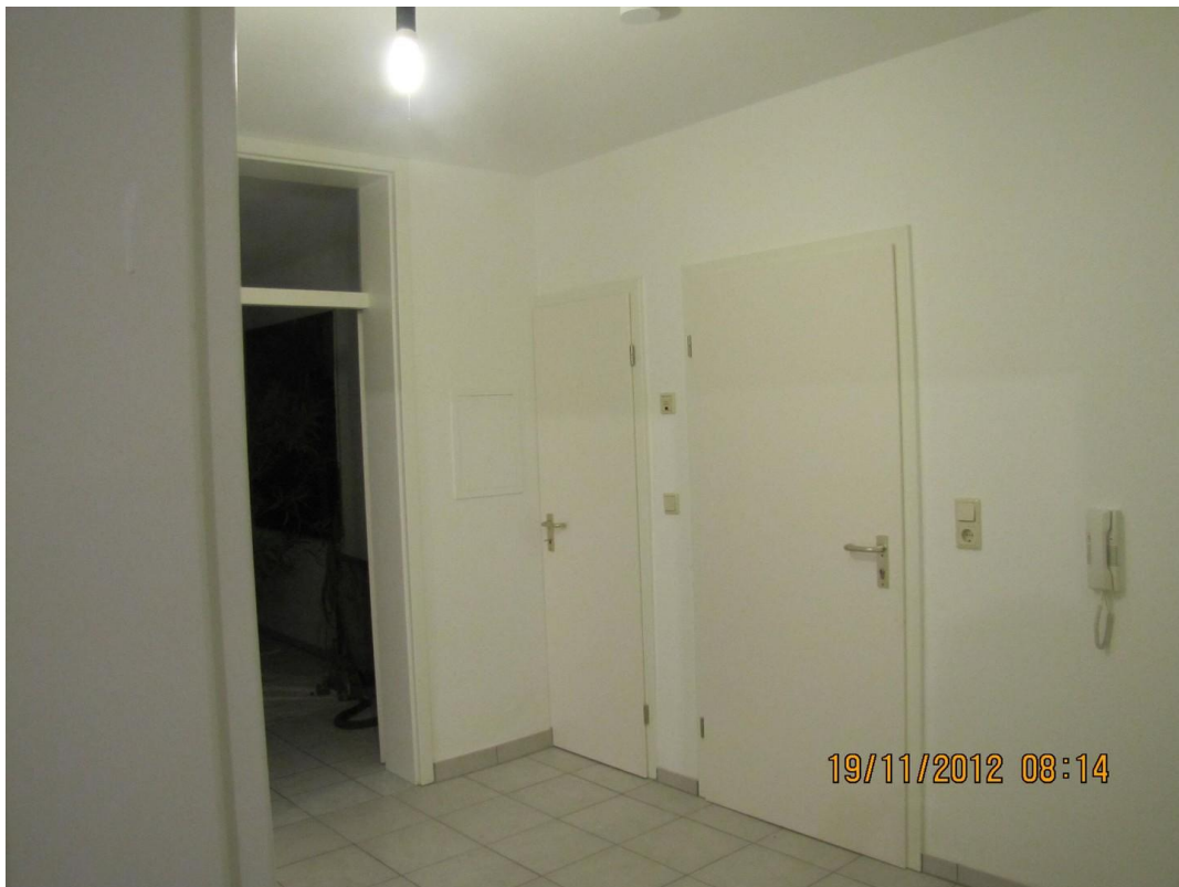
Flur mit Eingangstür und Zuan