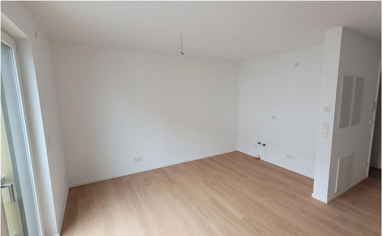
Innenansicht mit Kochbereich