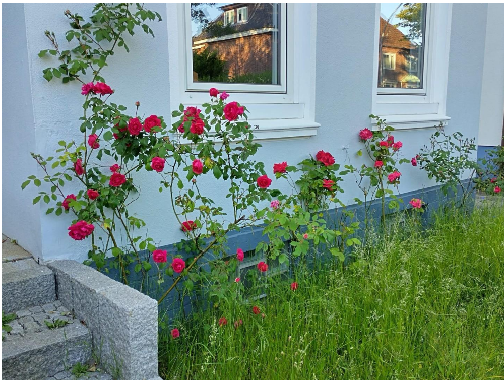
Rosen im Vorgarten