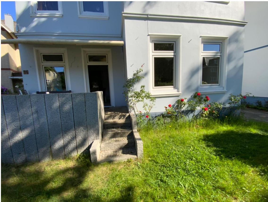
Vorgarten und Terrasse