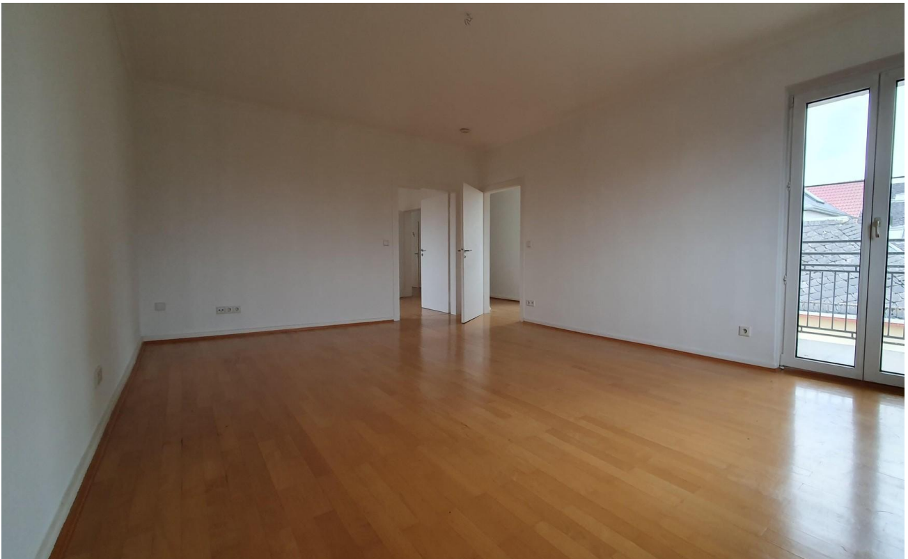
Wohnzimmer von der Gartenseite