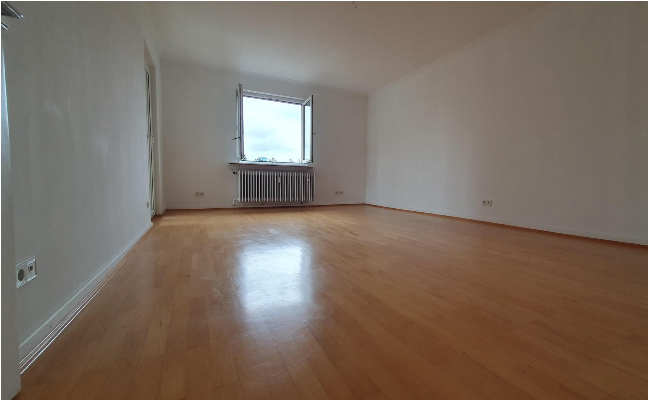
Wohnzimmer vom Eingang aus