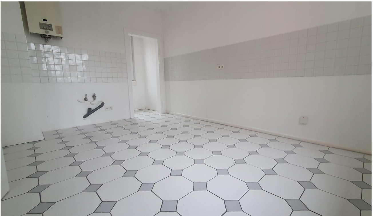
Küche vom Eingang aus