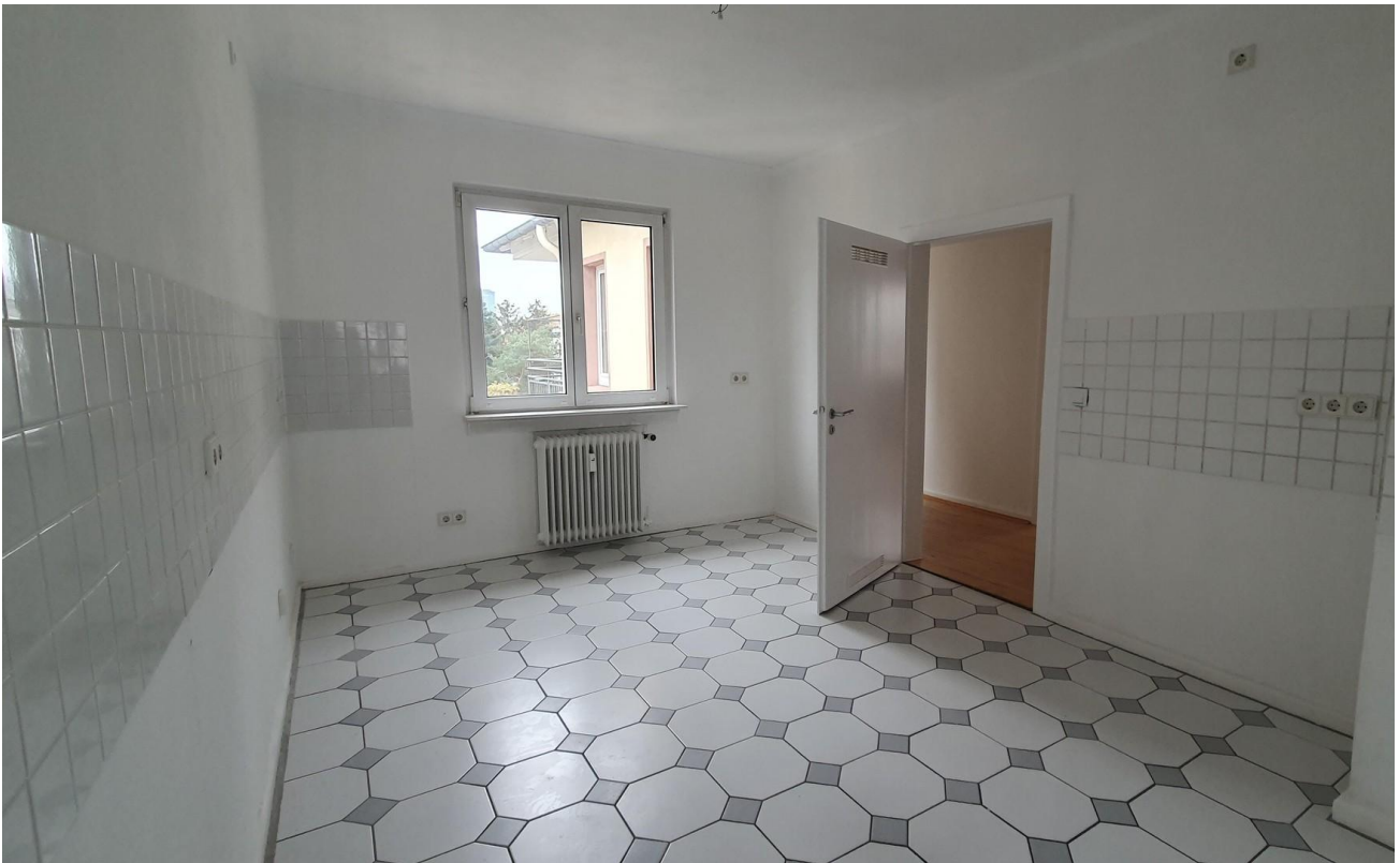
Küche von der Speisekammer aus