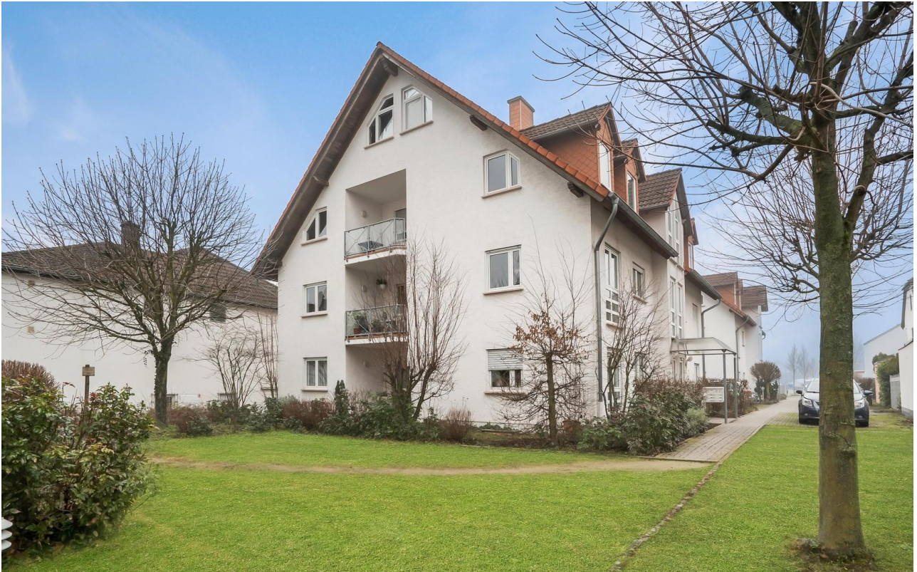
Ansicht Haus Rückseite