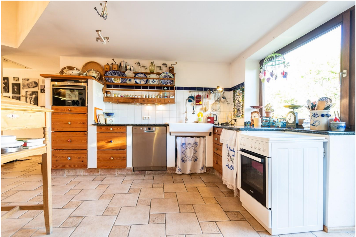
Viel Platz in der Küche