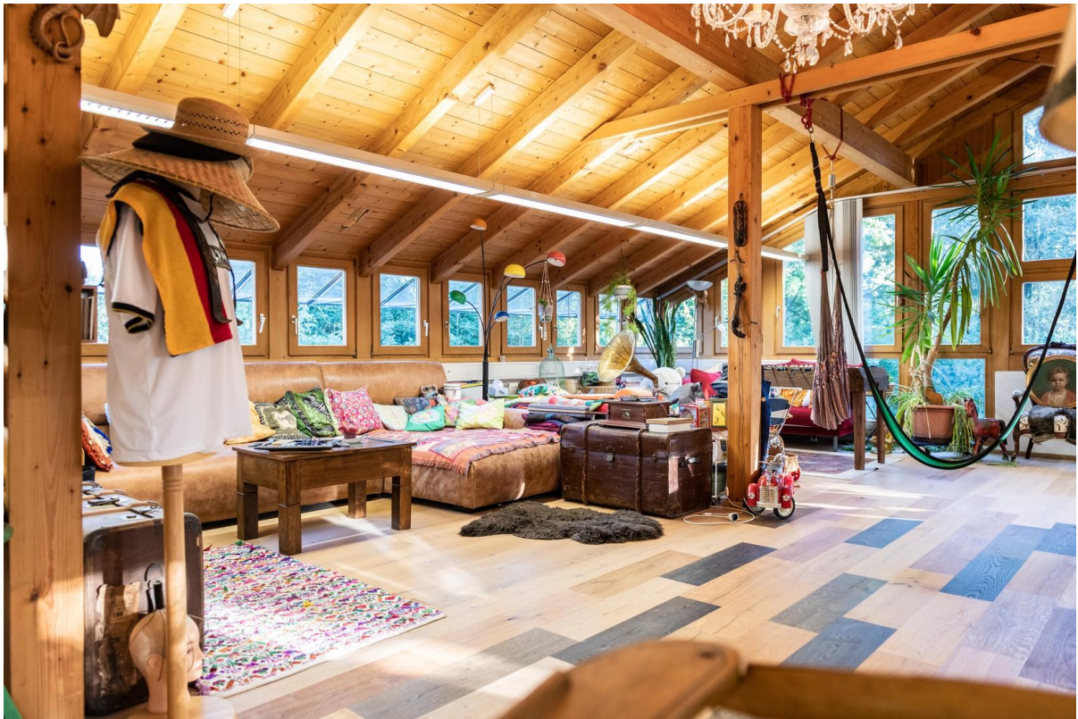
Wohnen in Loft-Athmosphäre