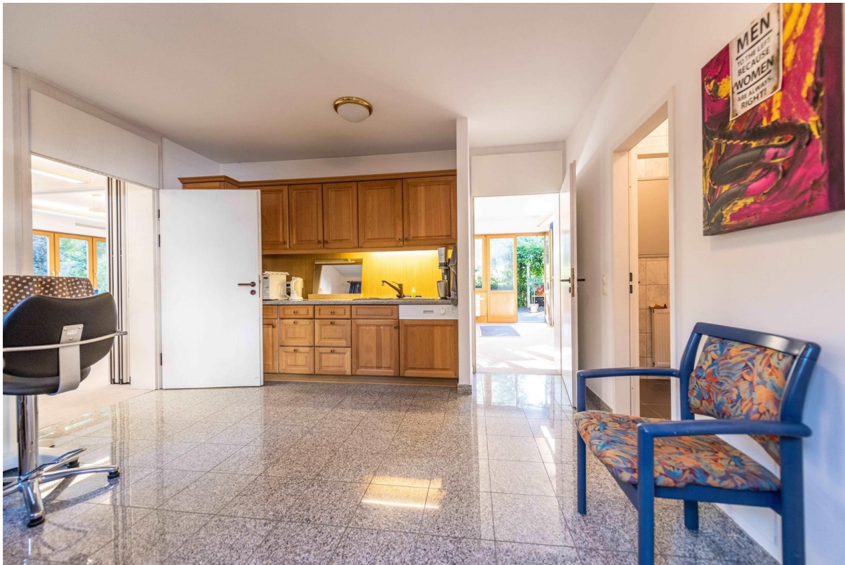
Gewerbeküche und Toiletten