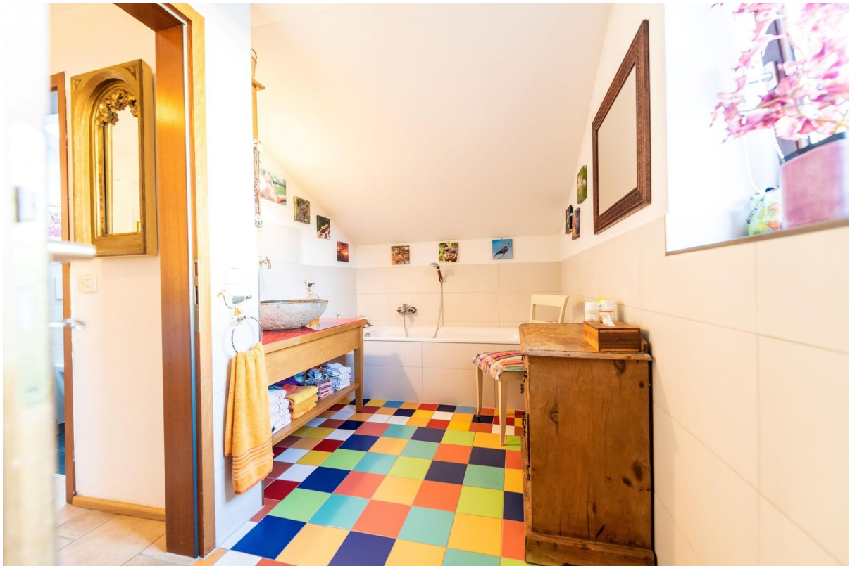
Bad im OG