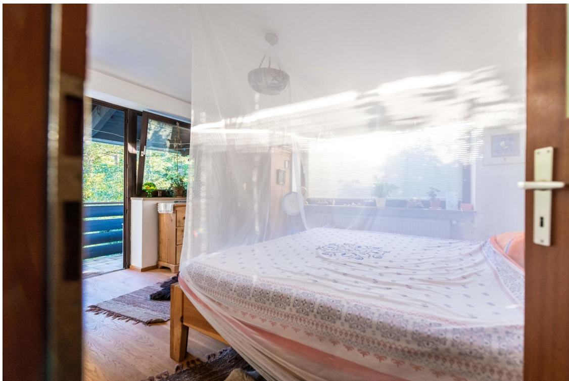
Schlafzimmer mit Südbalkon