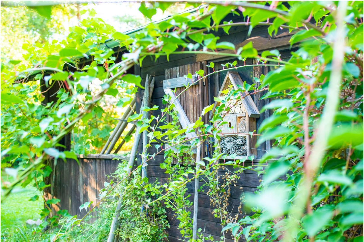
Saunahäuschen im Garten