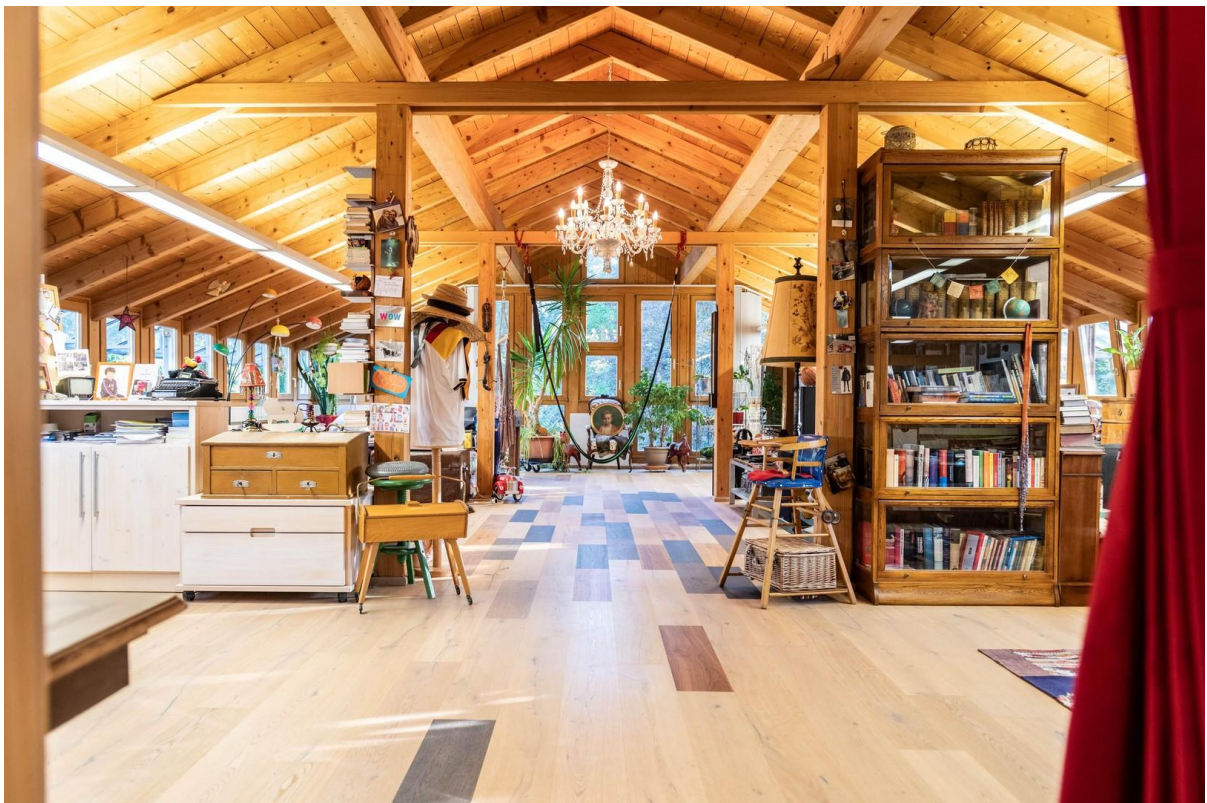
Wohnzimmer mit viel Platz