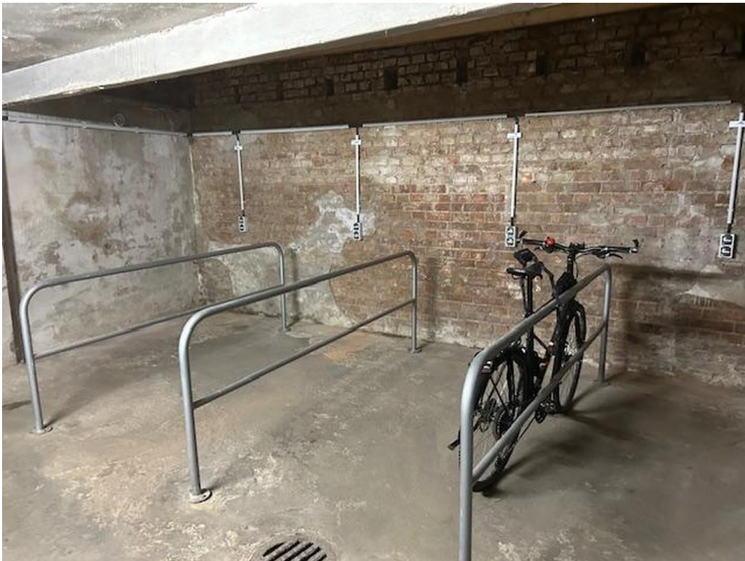
Fahrradgarage mit Lademöglkt.