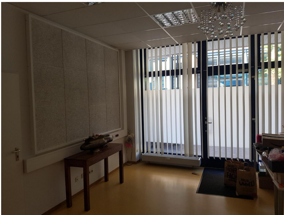
Büro 3 (mit Straßenzugang)