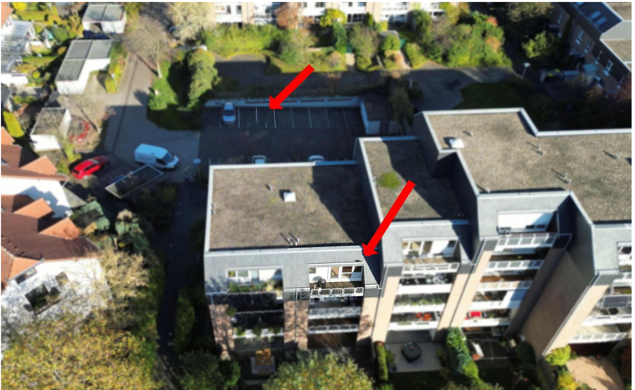
Ansicht Balkon und Stellplatz