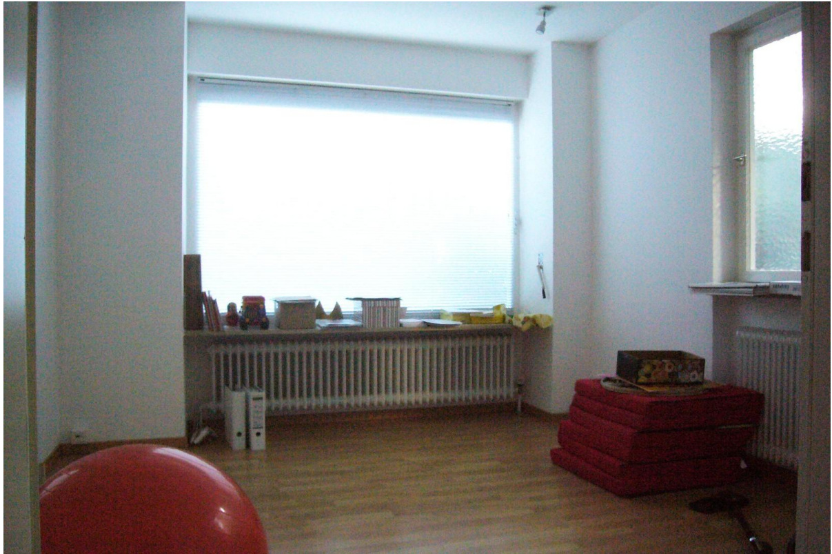
Raum 2, Südwest (Straße)