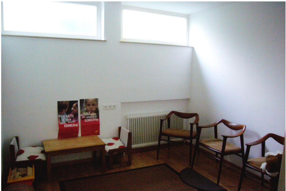
Raum 3, Südwest (Straße)