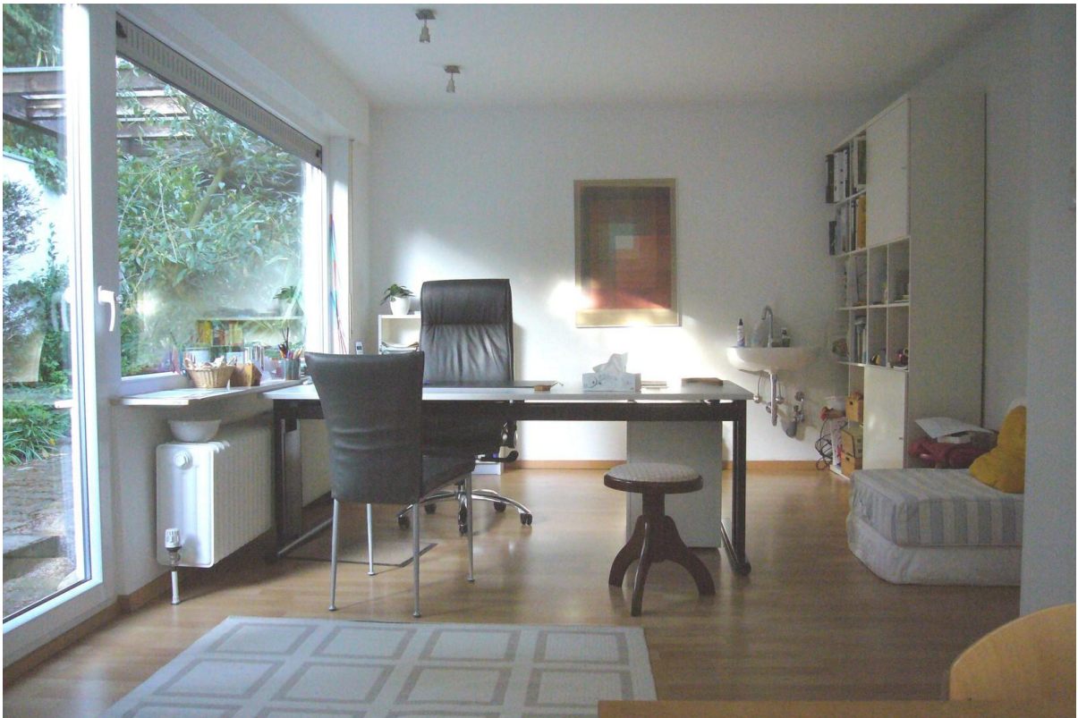
Raum 1, Nordwest