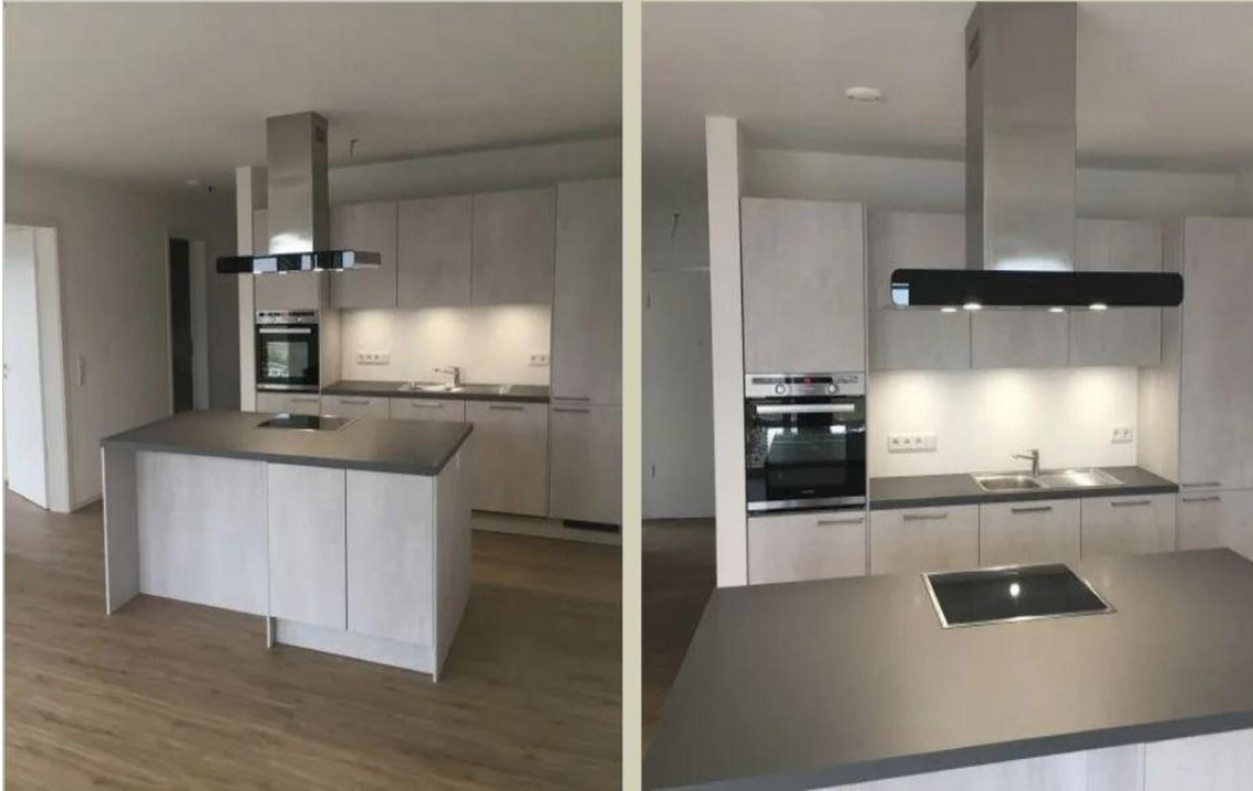
Einbauküche mit Kochinsel

Illustration – Musterbilder aus Vergleichsobjekten der Vermieter