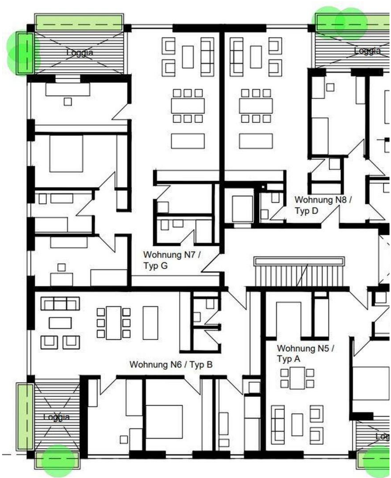
Haus Nord 1. Obergeschoss