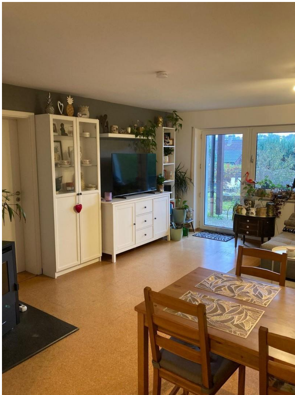
Balkontür zur Terrasse/ Garten