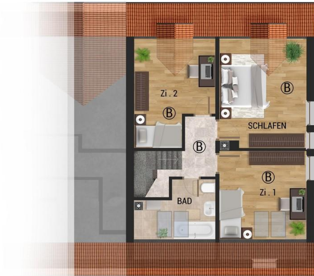
Dachgeschoss Whg B