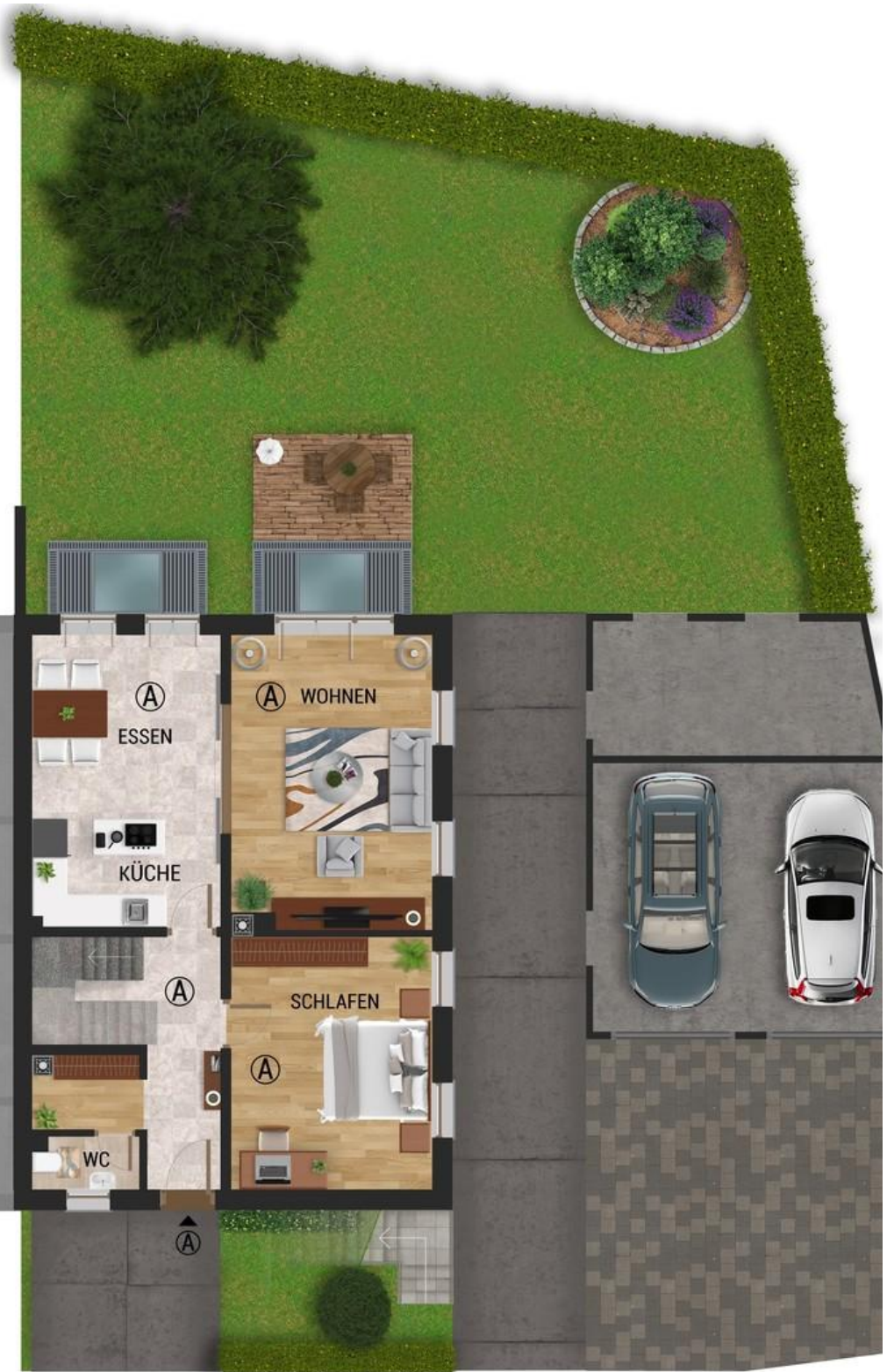
Erdgeschoss Whg A