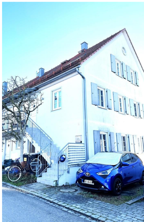
Ansicht Giebel Süd