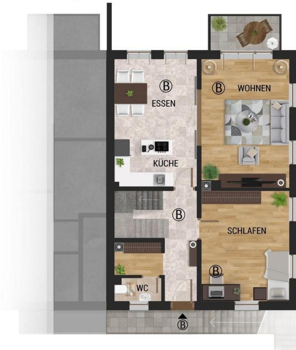
Obergeschoss Whg B