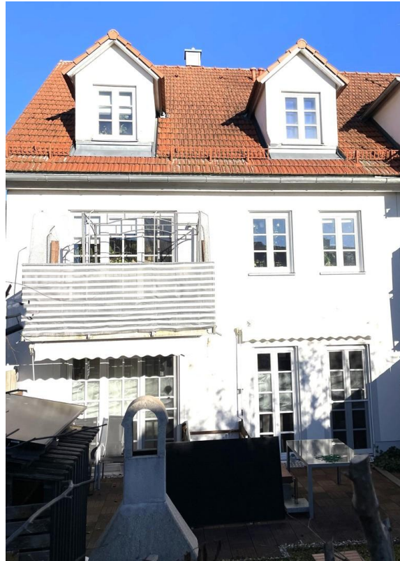
Ansicht Fassade Ost