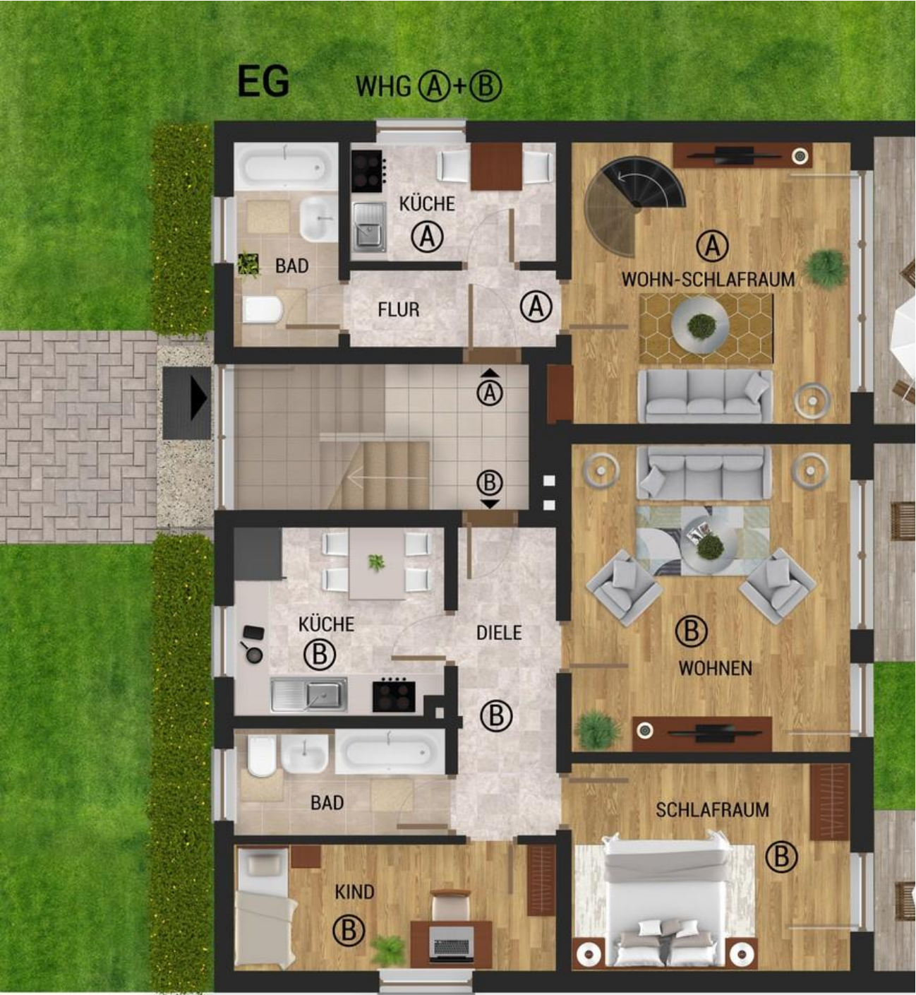
EG Whgen A und B