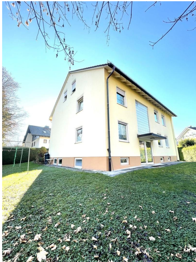
Ansicht Nord Ost