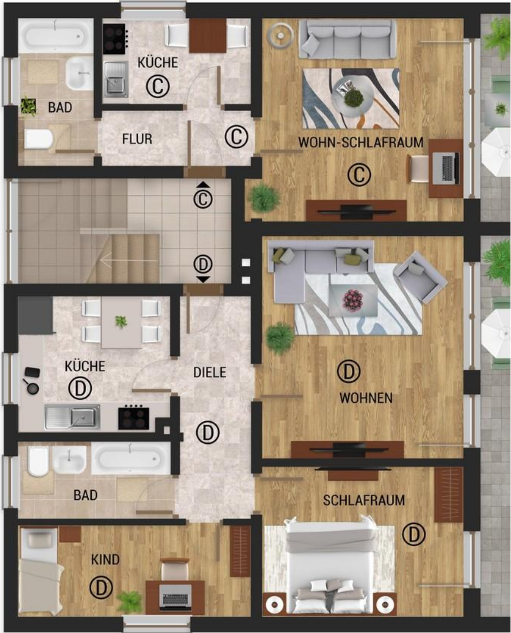
OG Whgen C und D