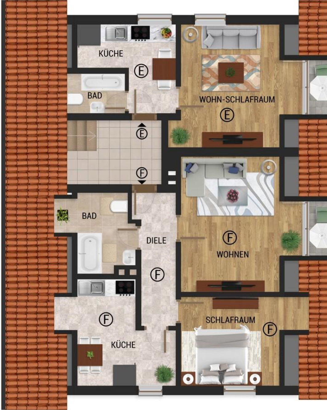
DG Whgen E und F