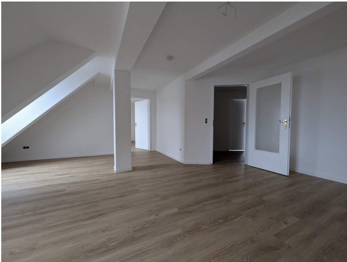
Wohnzimmer ohne Inventar