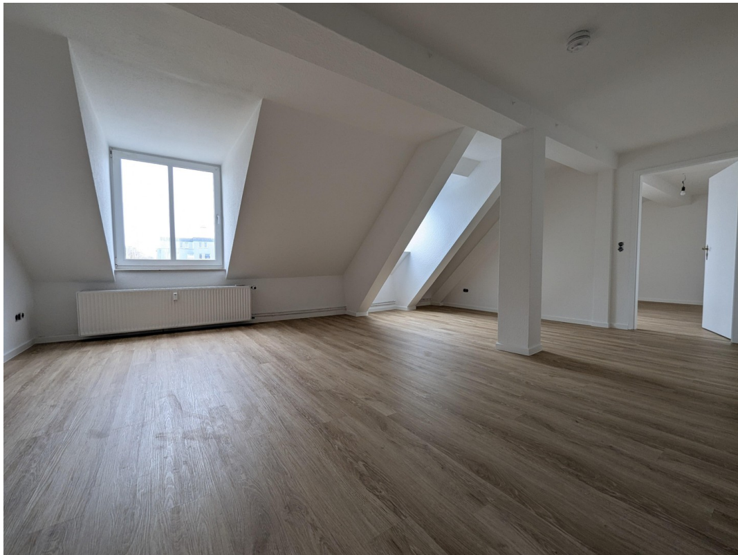
Wohnzimmer ohne Inventar