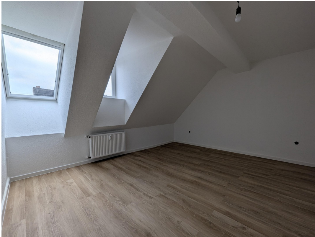
Schlafzimmer ohne Inventar