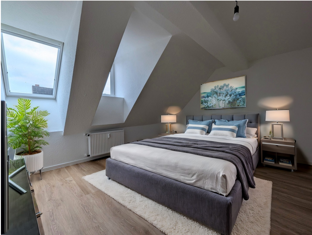
Schlafzimmer mit Inventar