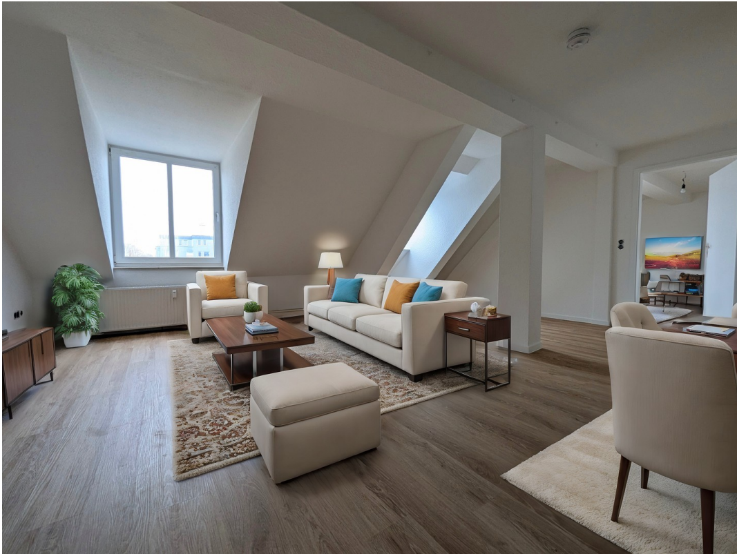
Wohnzimmer mit Inventar