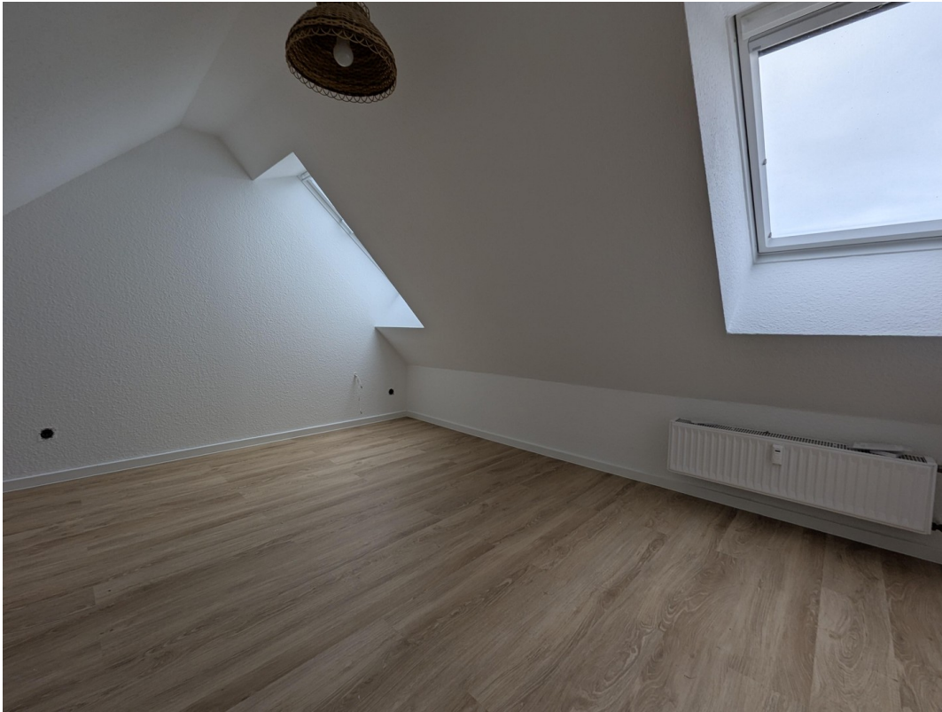
Schlafzimmer ohne Inventar