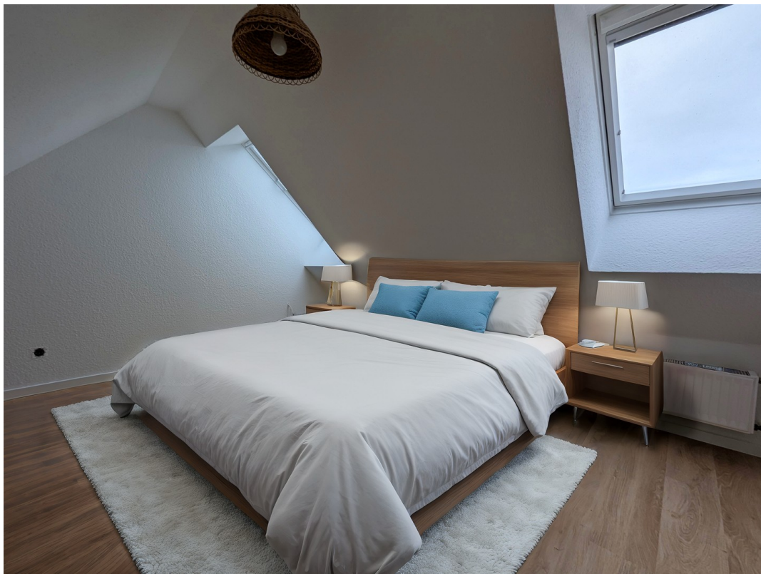
Schlafzimmer mit Inventar