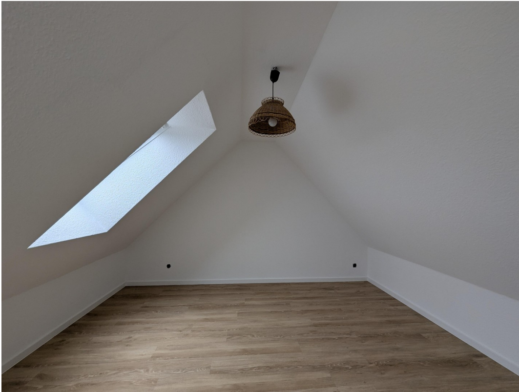
Schlafzimmer ohne Inventar