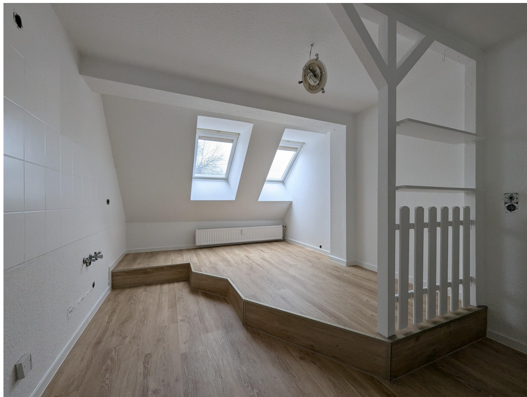
Küche ohne Inventar