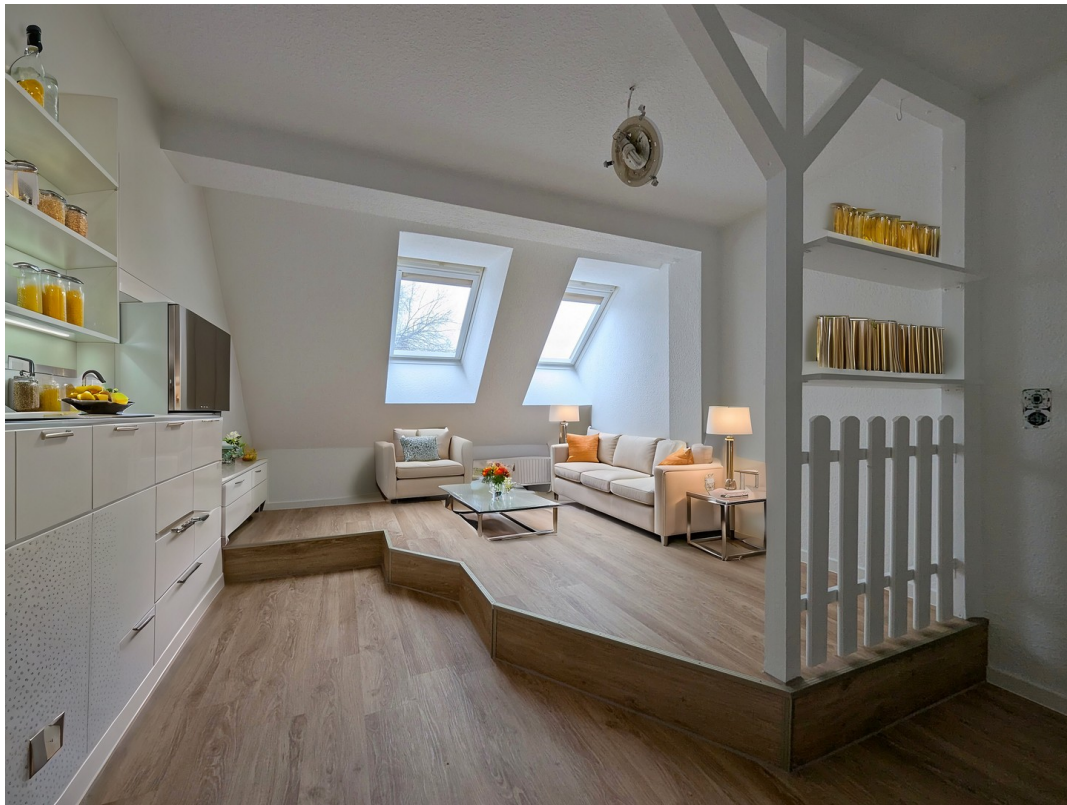
Küche mit Inventar