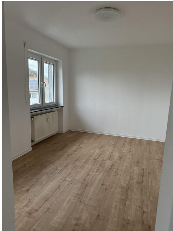
1. OG Zimmer