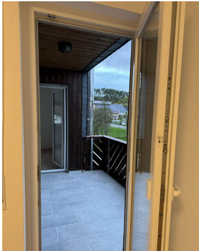
Zugang Balkon 1. OG aus Zimmer