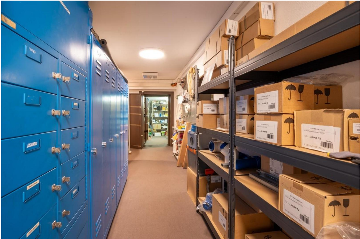
Viel Platz für Lager / Archiv