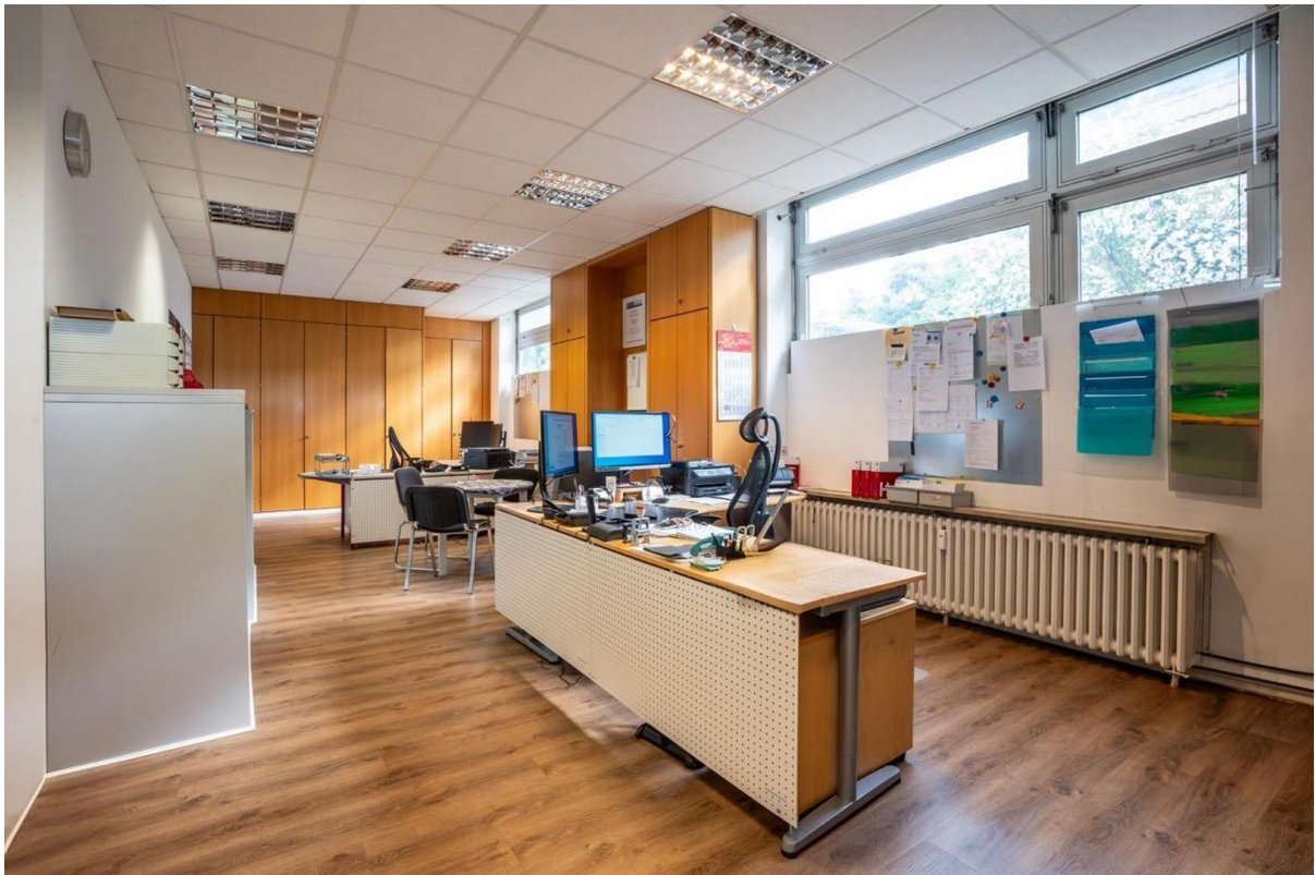
Bürofläche im Erdgeschoss