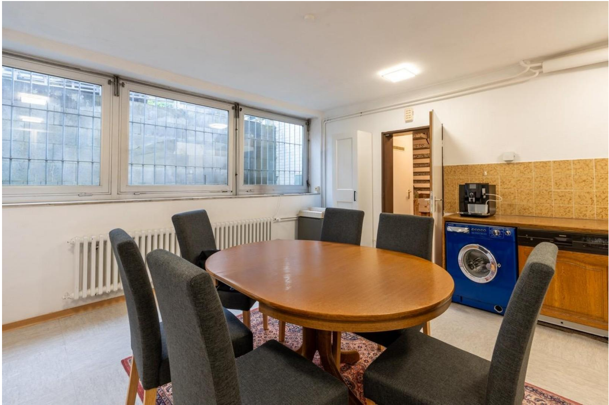
Aufenthalt mit Küche