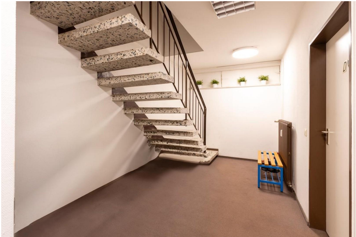
Treppe ins Untergeschoss