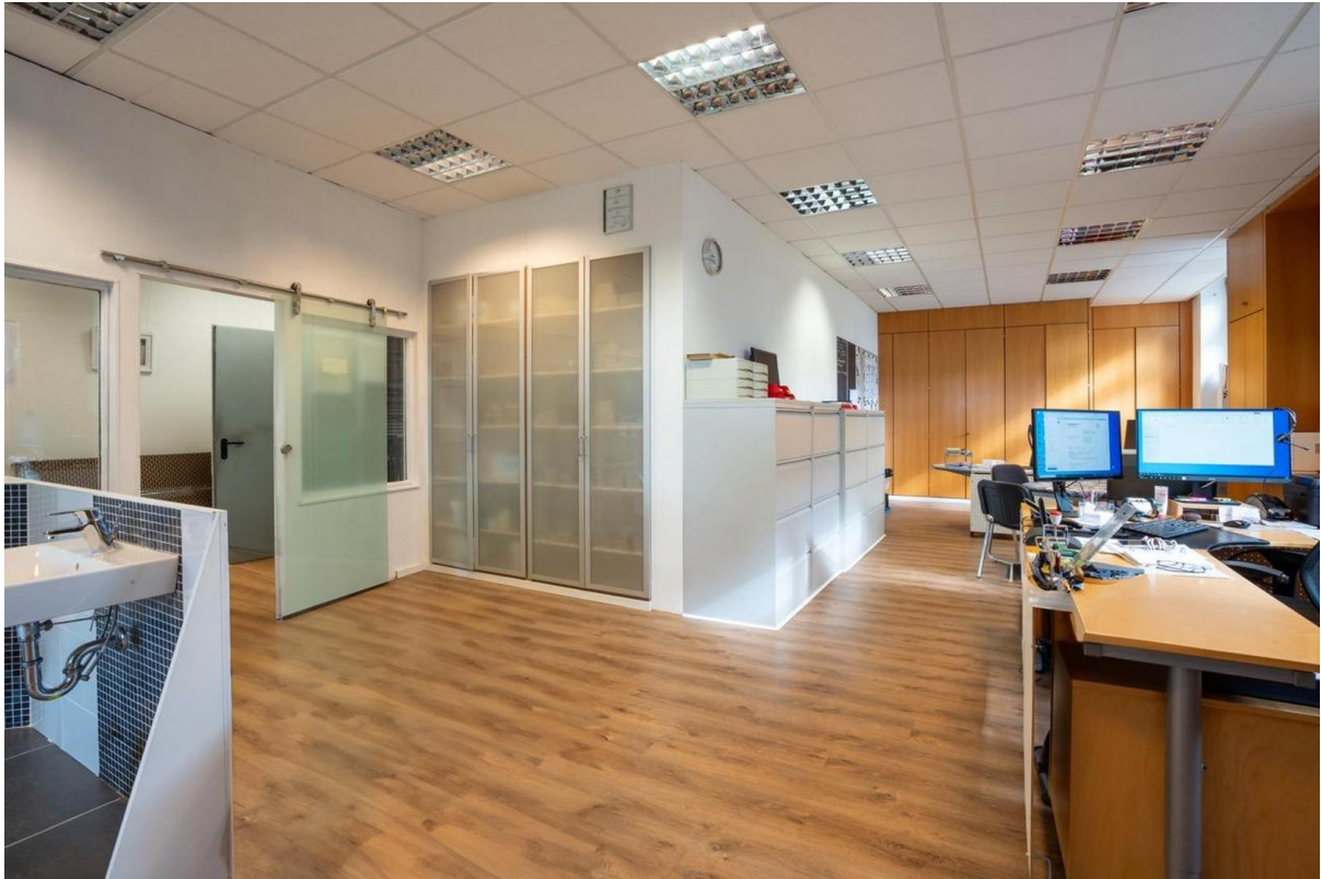
Hohe Decken und Einbauschränke