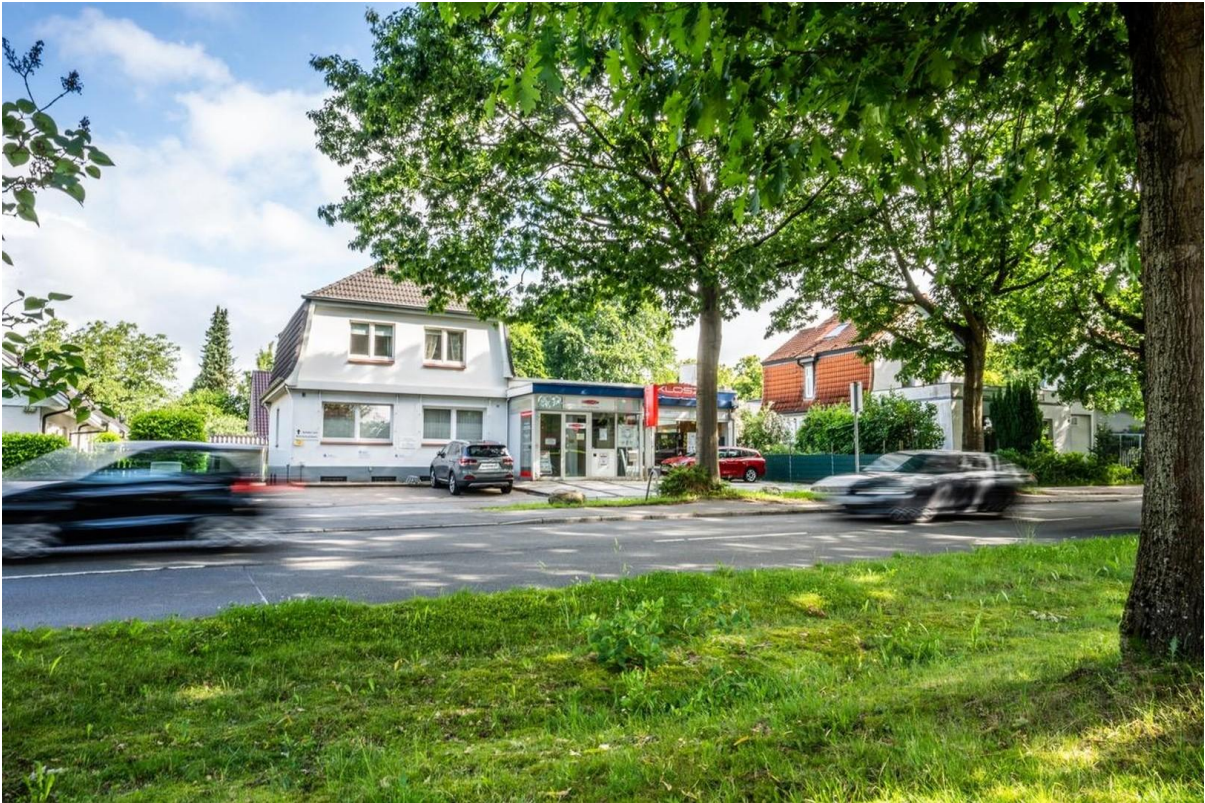
Gute Anbindung per Auto+Bus