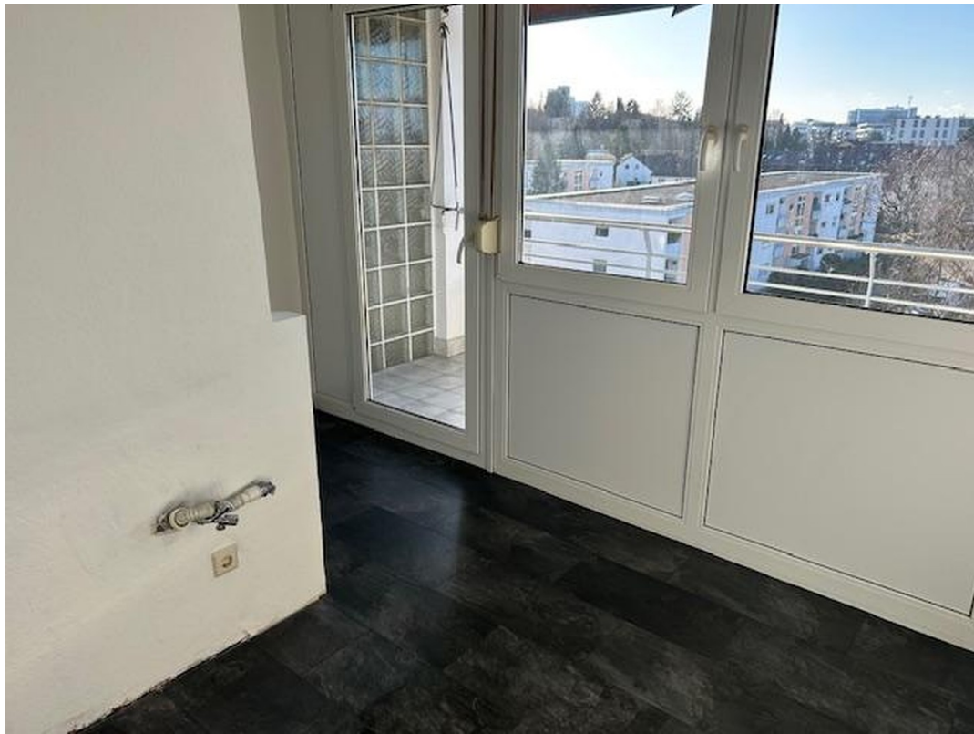
Küche Zugang Balkon