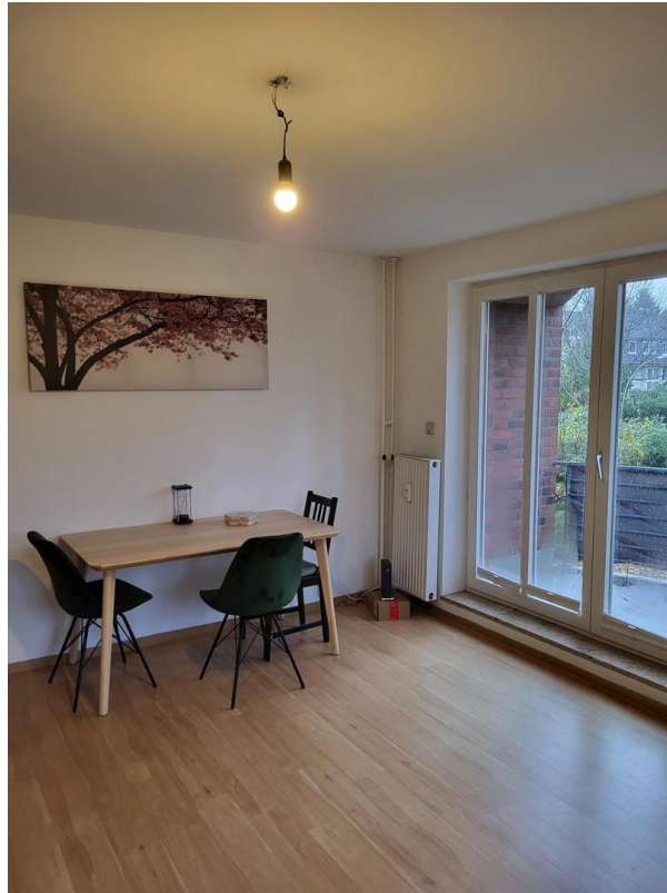
Wohn-/Essbereich mit Balkon