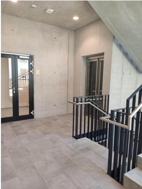
Flur mit Aufzug