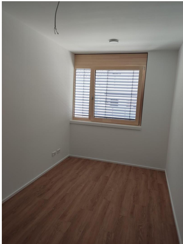
2. Zimmer/ Kinderzimmer