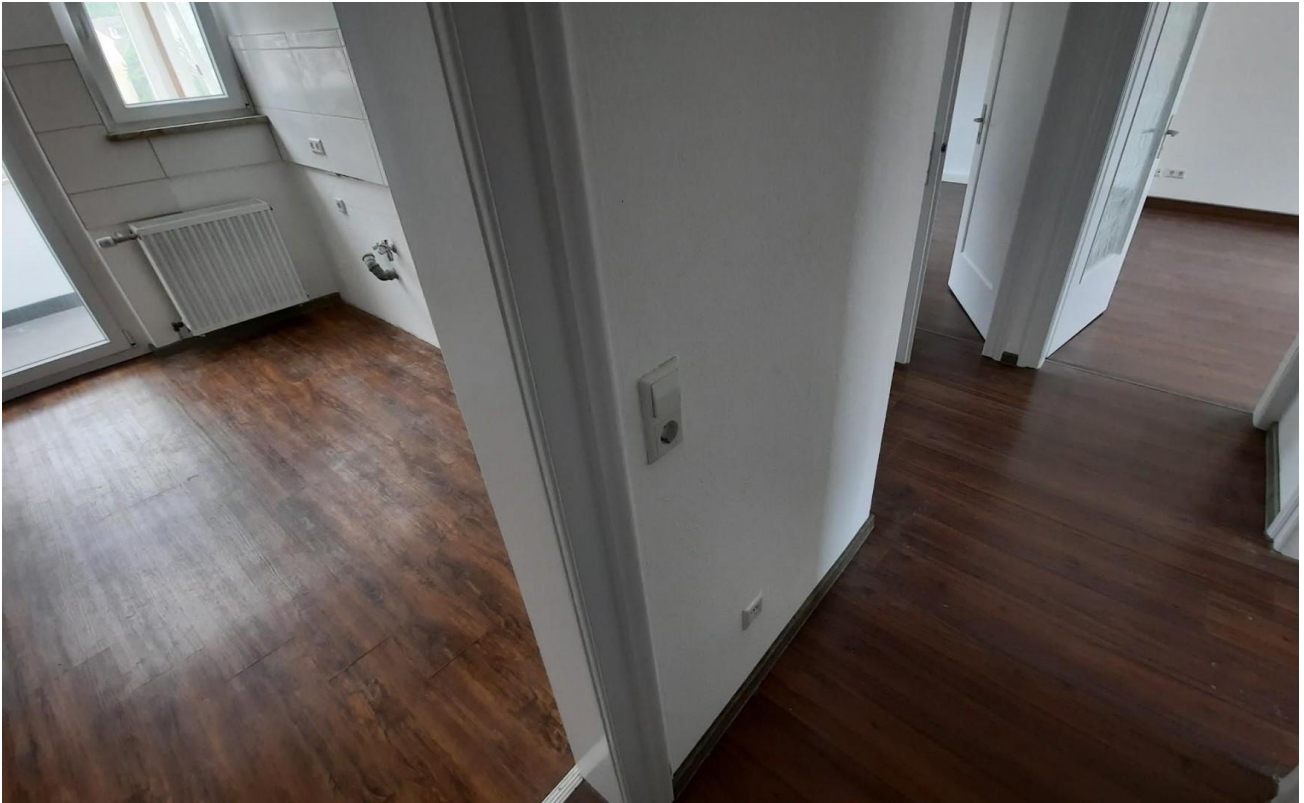
Flur Zugang zu allen Räumen