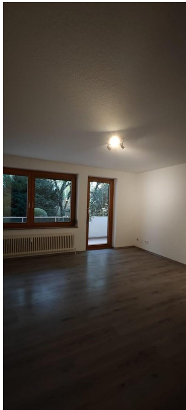
Wohnzimmer (Zugang zu Balkon)