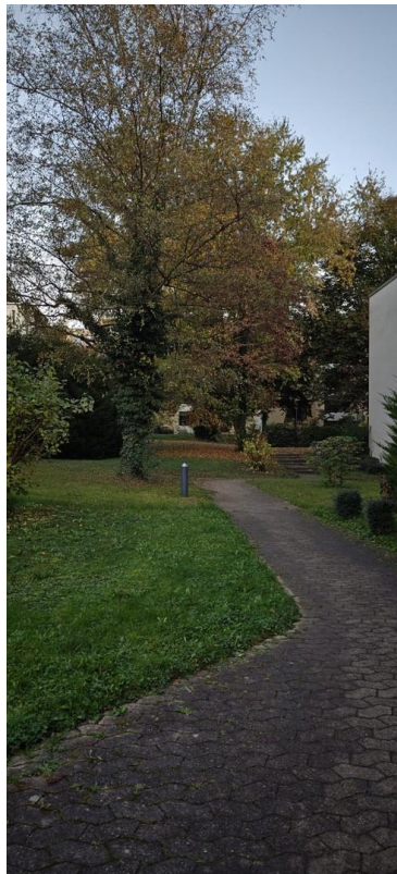
Weg zum Hauseingang