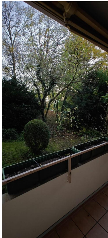
Blick von Balkon ins Grüne