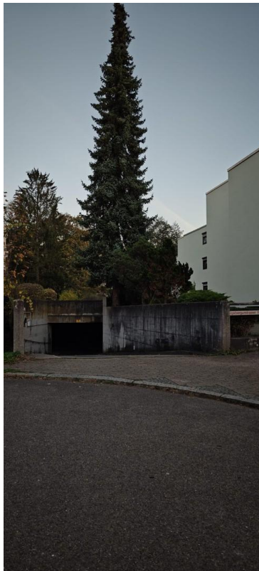
Abfahrt TG (einzl. abschlie.)