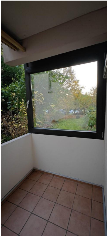
Balkon (mit Fenster)