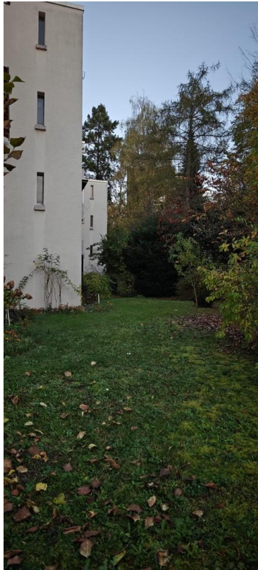
Blick hinter das Haus