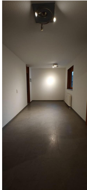
Esszimmer (Zugang zu Küche)