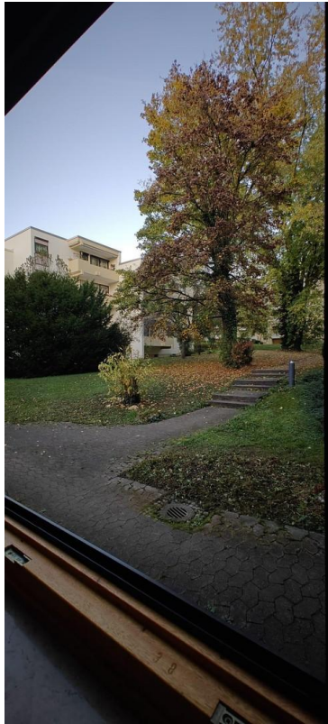
Blick auf Hauseingang