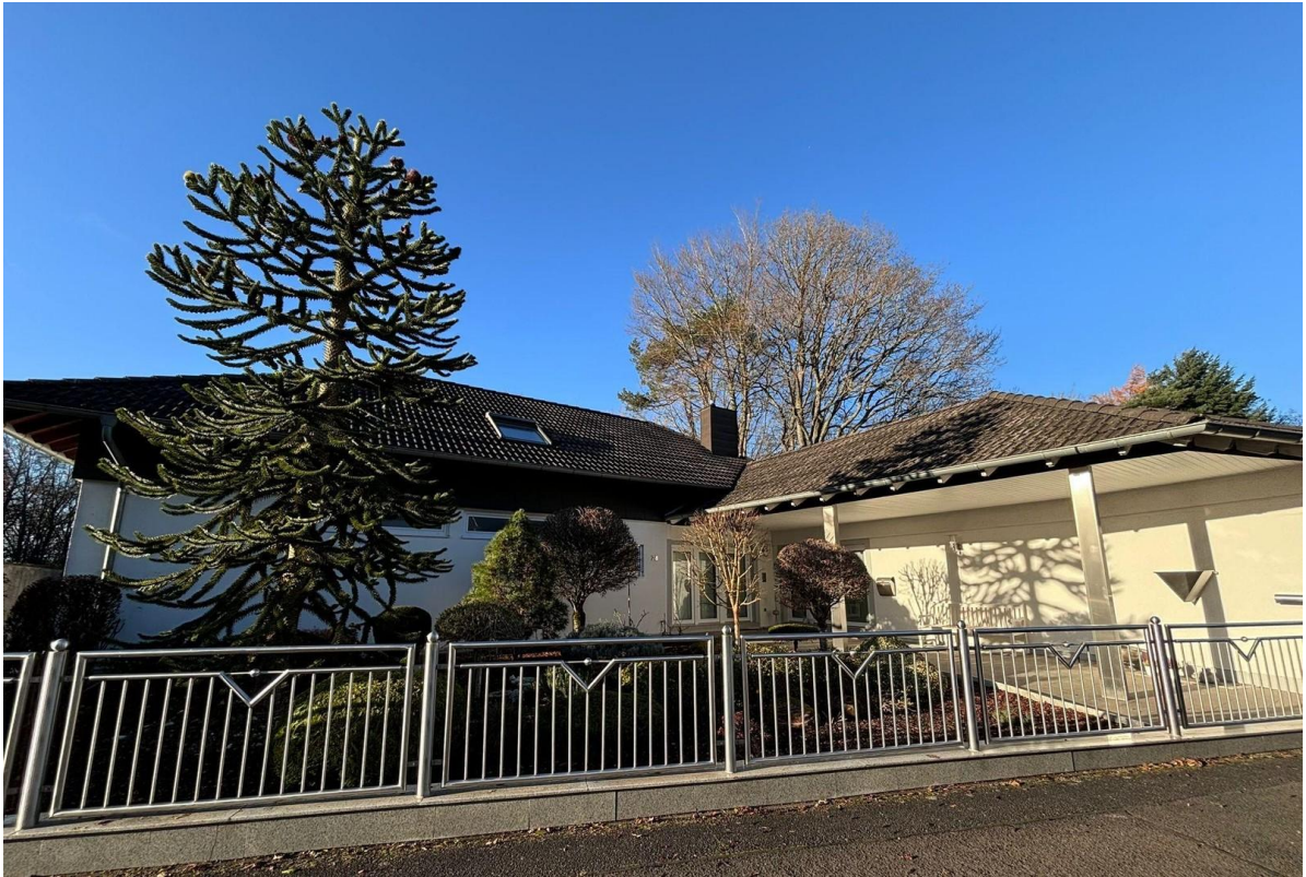
Ansicht Straßenseite 2