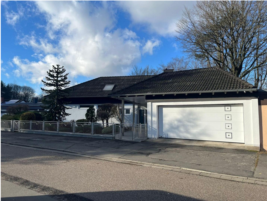
Ansicht Straßenseite 4