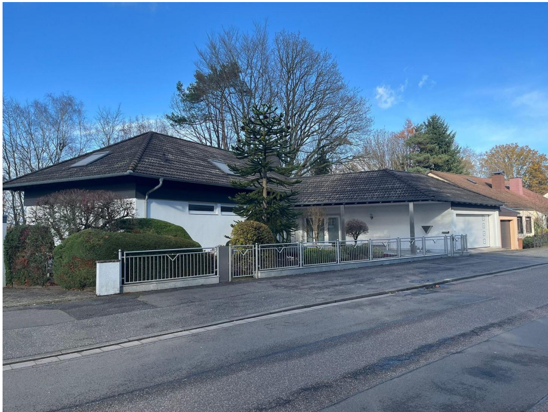
Ansicht Straßenseite 3