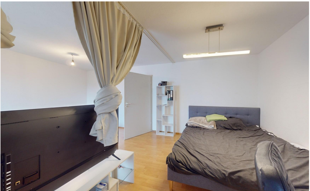
Wohnbereich Bild 2