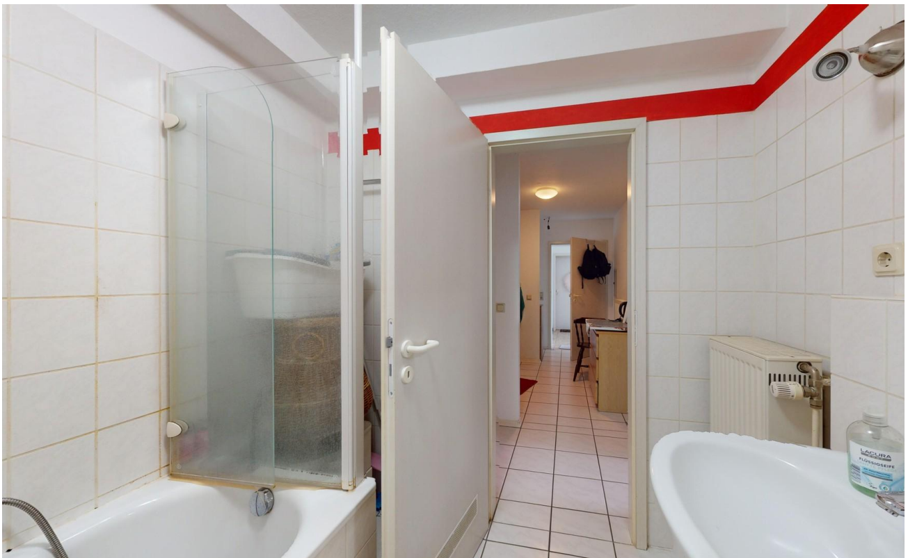
Badezimmer Bild 2