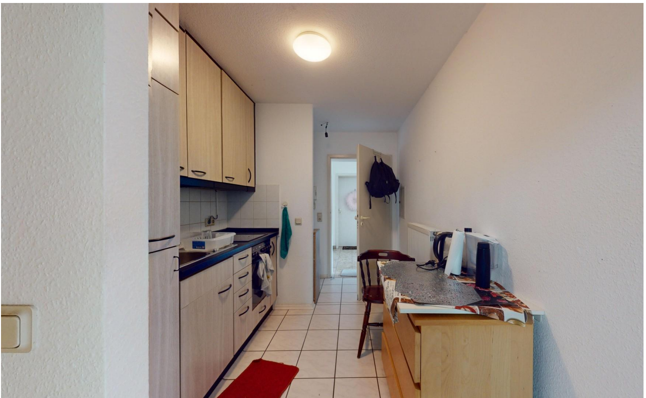
Küche Bild 2