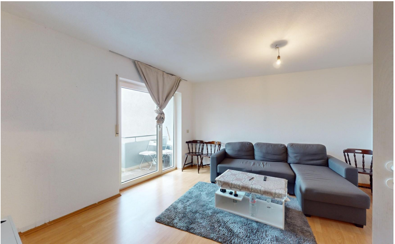
Wohnbereich Bild 3