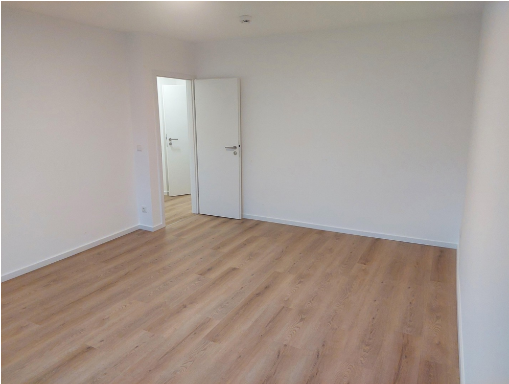
Schlafzimmer - Ansicht #2