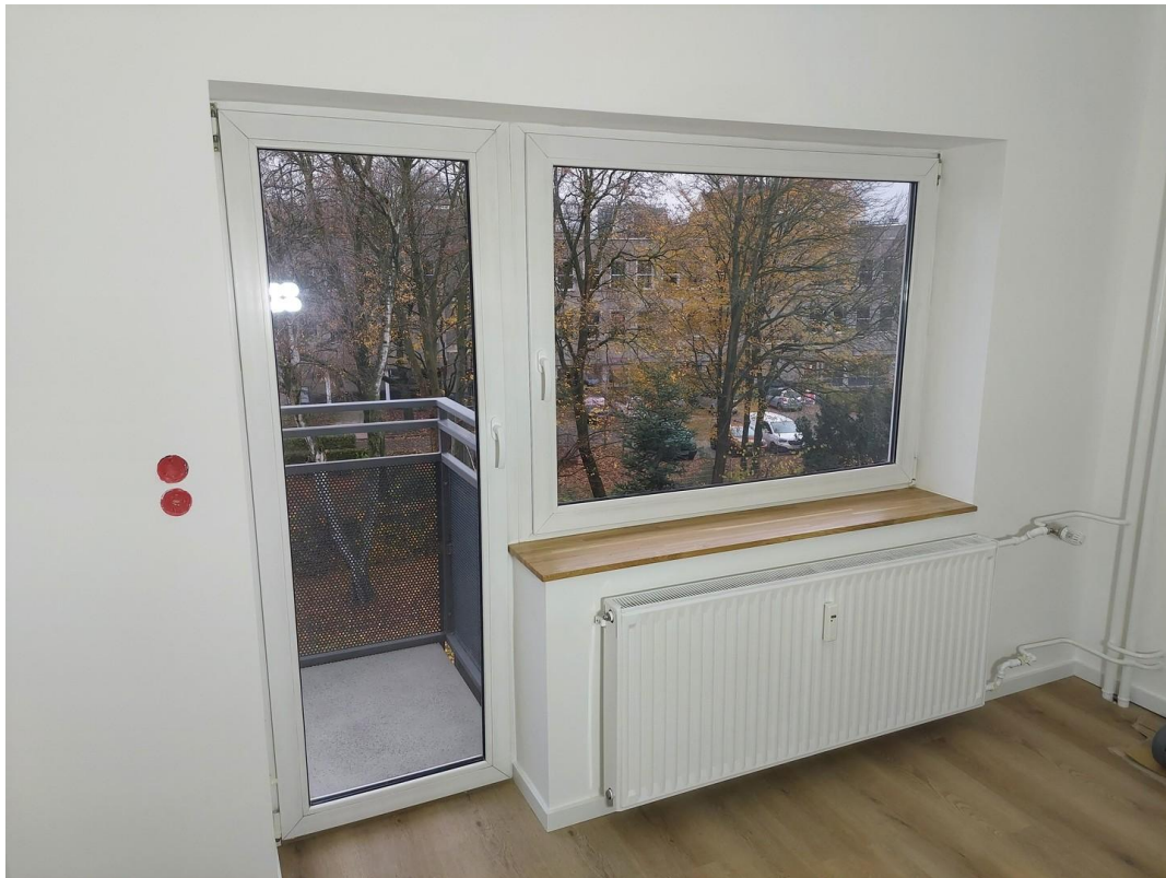
Wohnzimmer - Ansicht #3