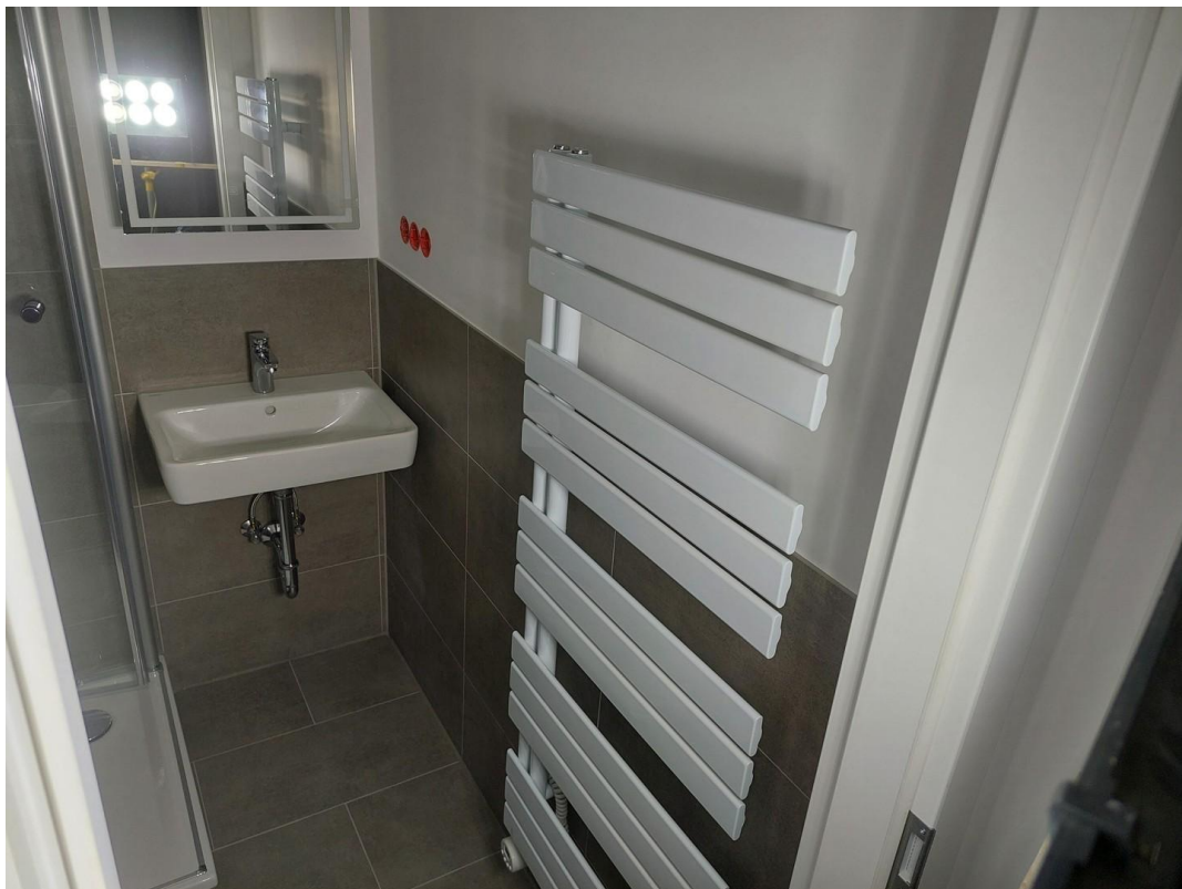
Badezimmer - Ansicht #2