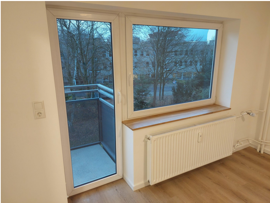
Wohnzimmer - Ansicht #3