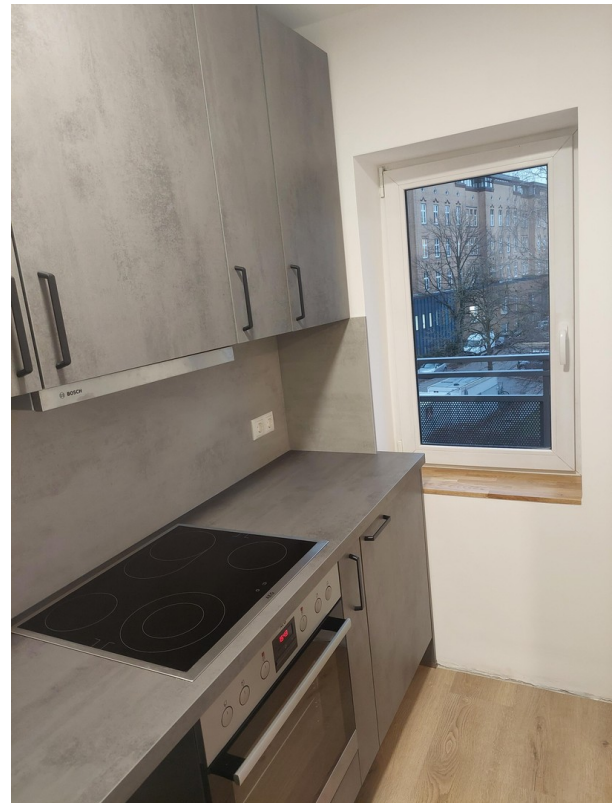
Küche - Ansicht #2