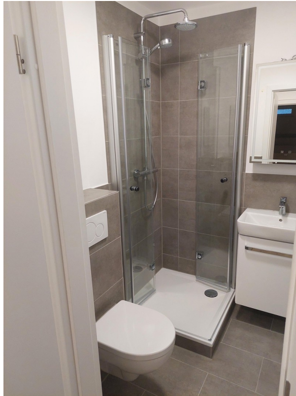
Badezimmer - Ansicht #1