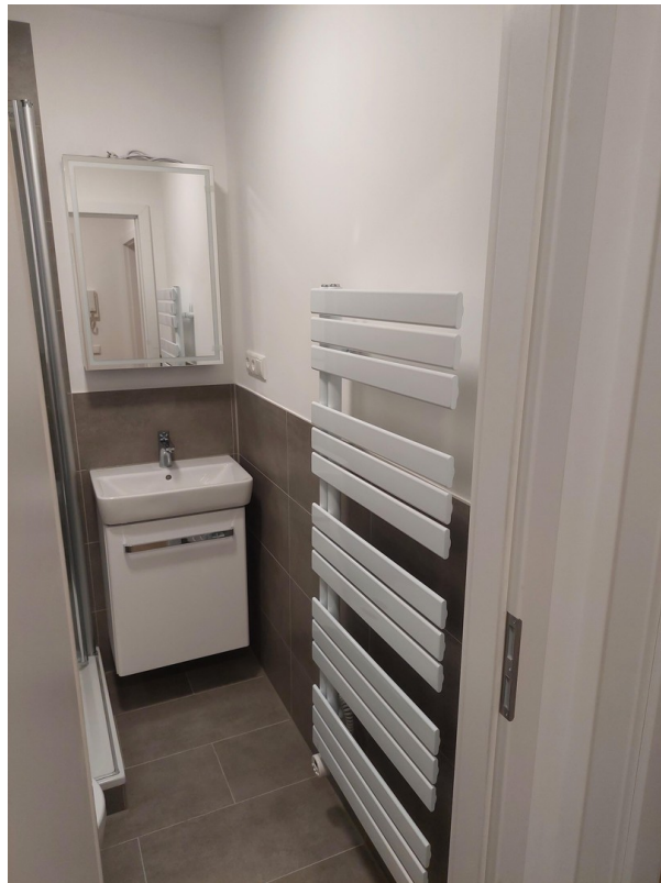
Badezimmer - Ansicht #2