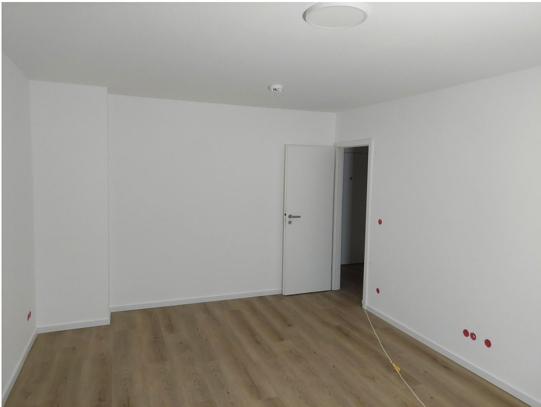
Wohnzimmer - Ansicht #2