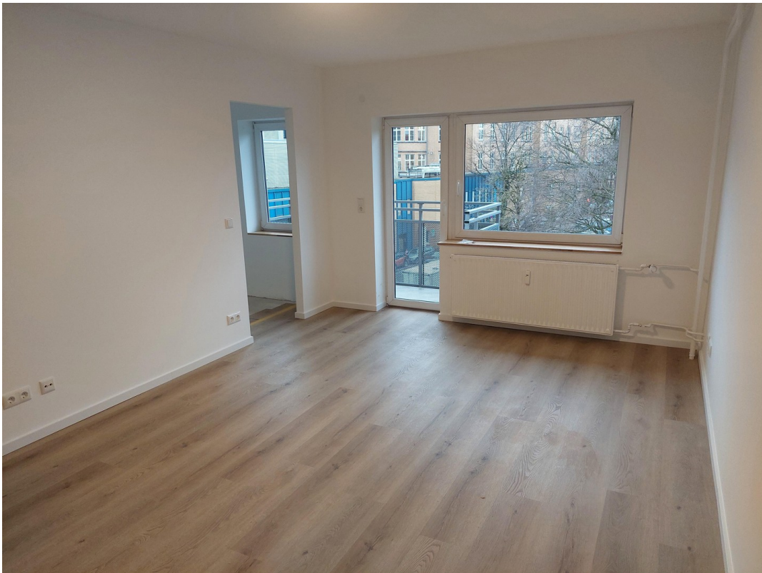
Wohnzimmer - Ansicht #1