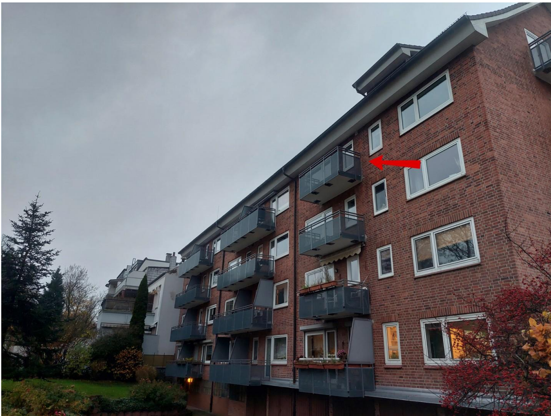
Außenansicht - Ansicht #2