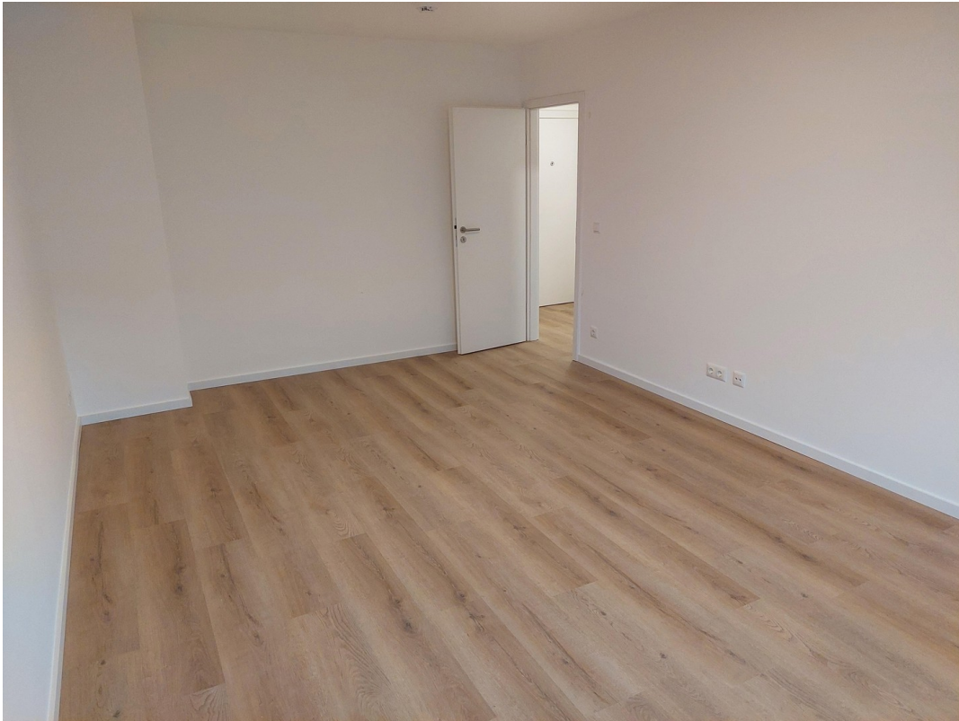
Wohnzimmer - Ansicht #2