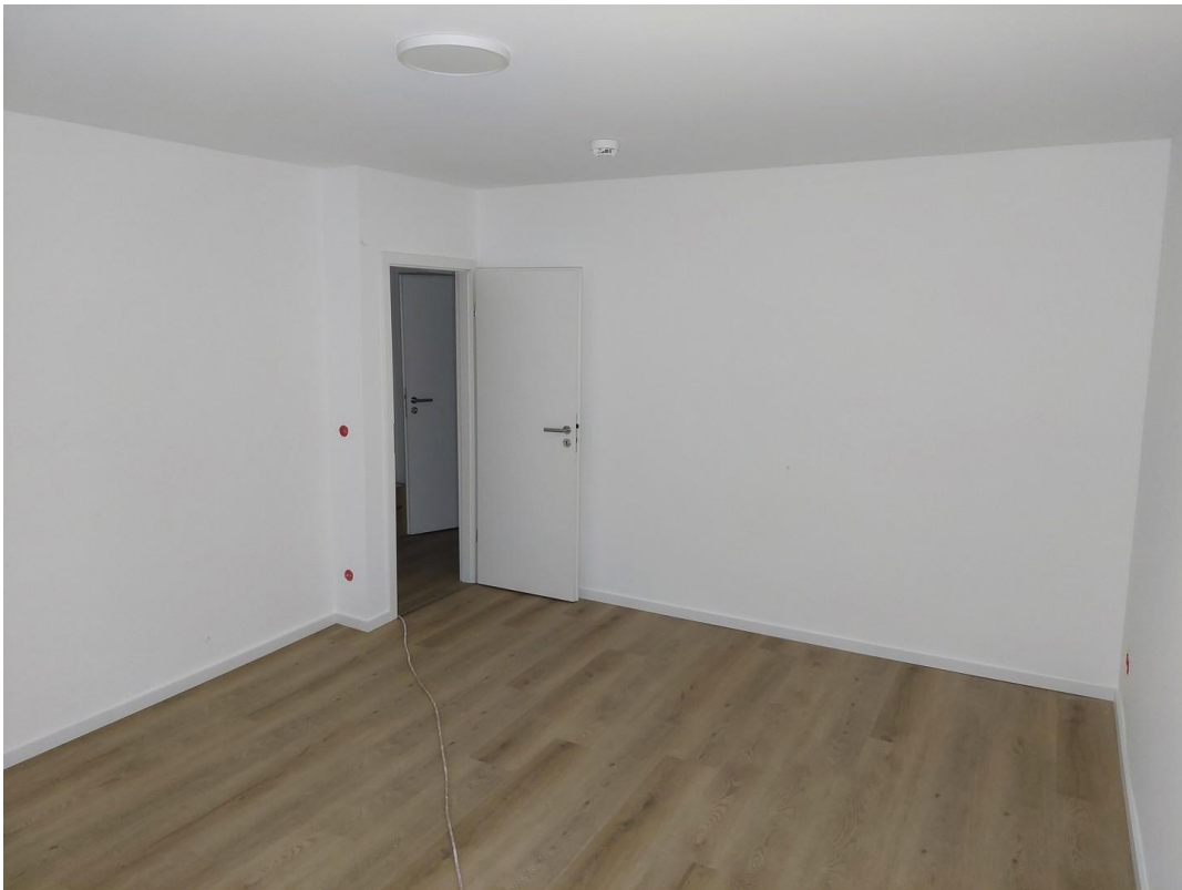
Schlafzimmer - Ansicht #2