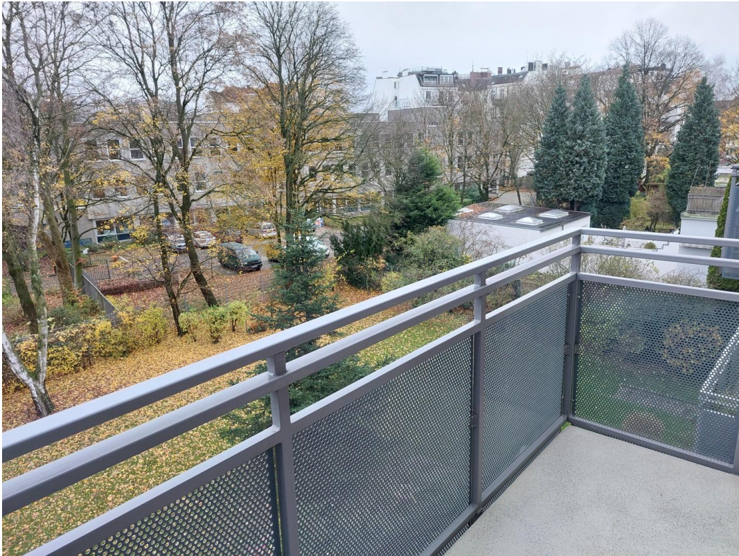
Balkon - Ansicht #2