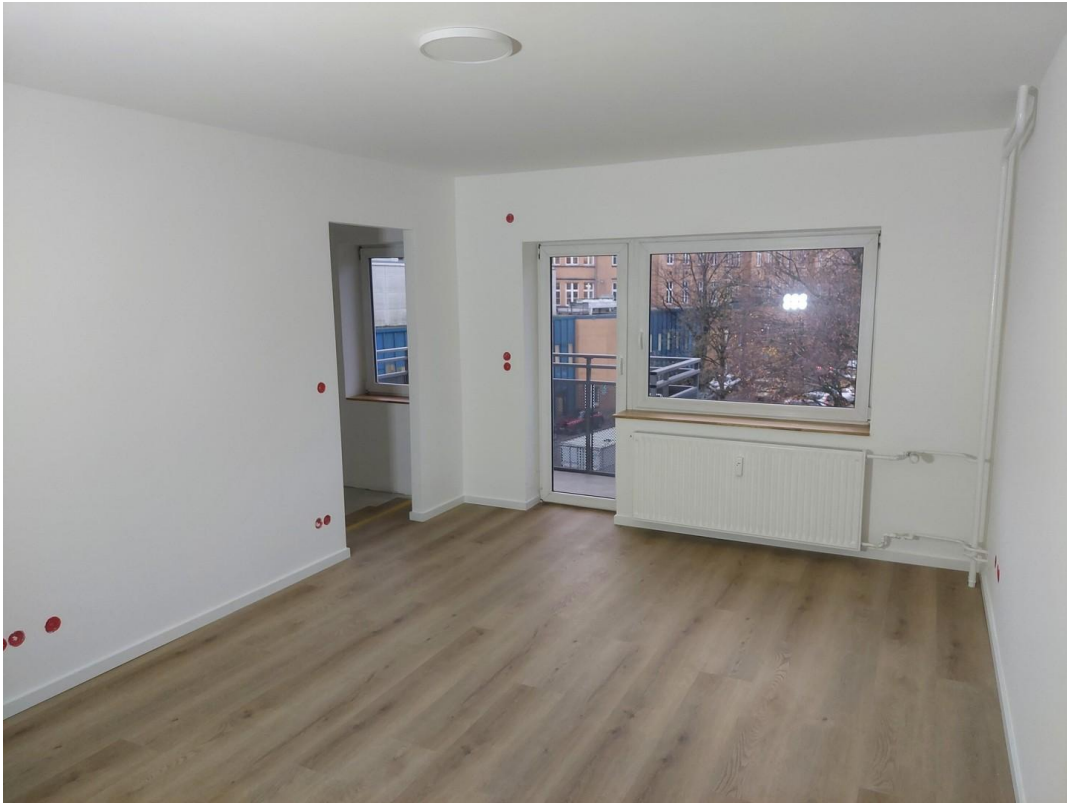
Wohnzimmer - Ansicht #1