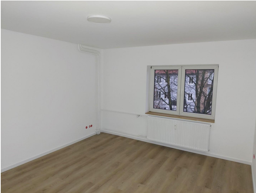
Schlafzimmer - Ansicht #1