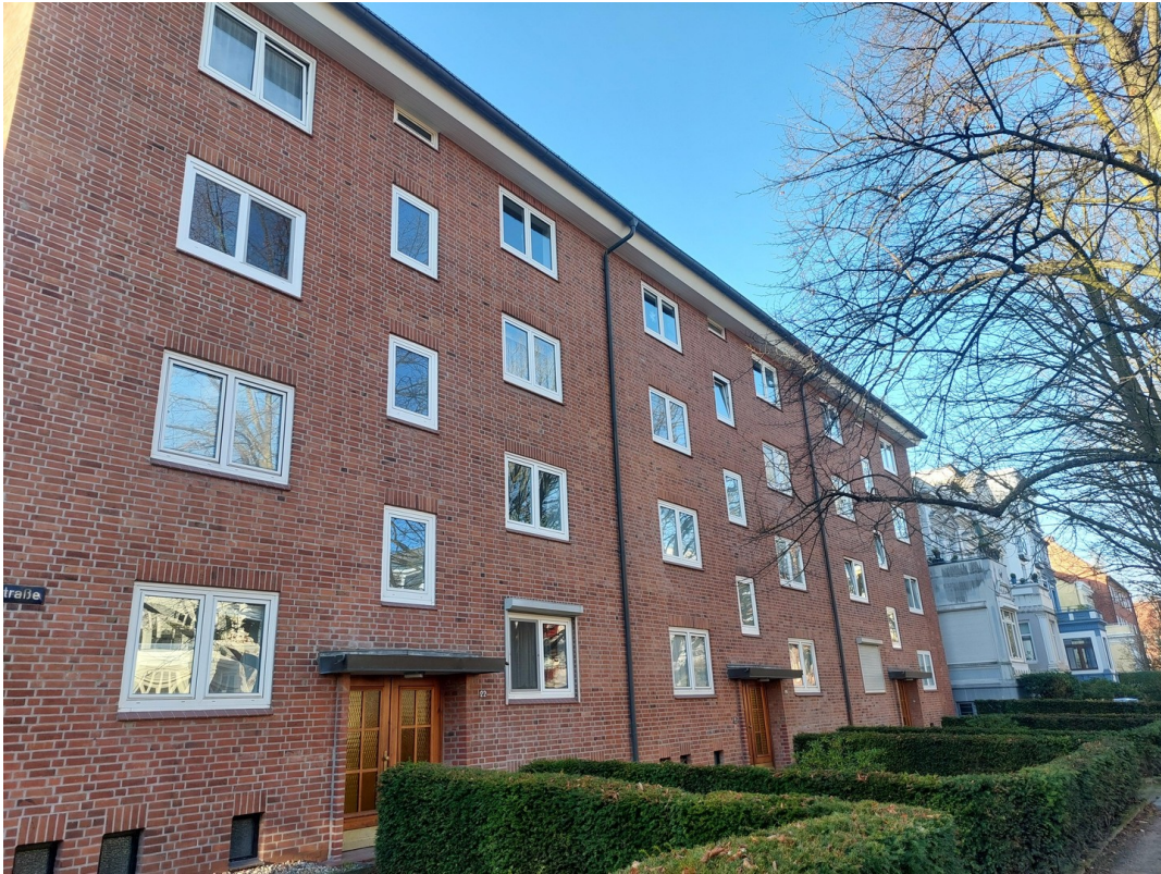
Außenansicht - Ansicht #3