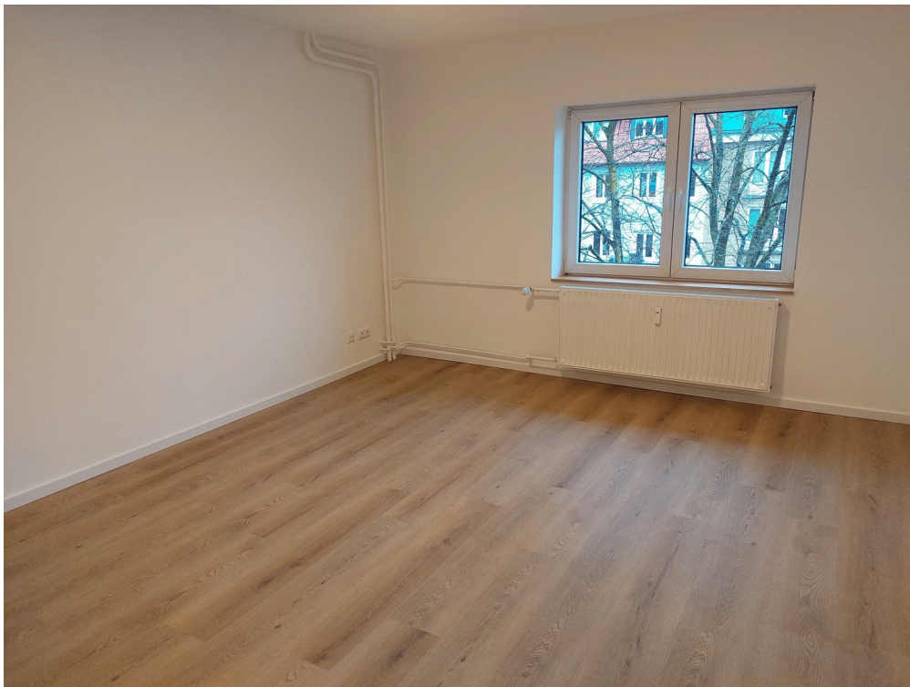
Schlafzimmer - Ansicht #1