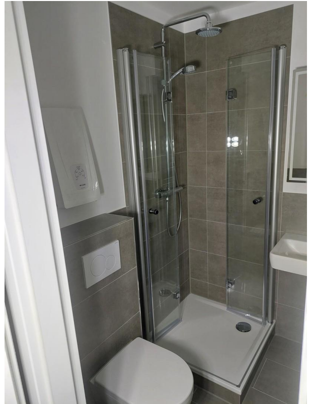
Badezimmer - Ansicht #1