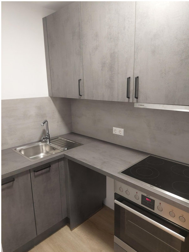
Küche - Ansicht #1