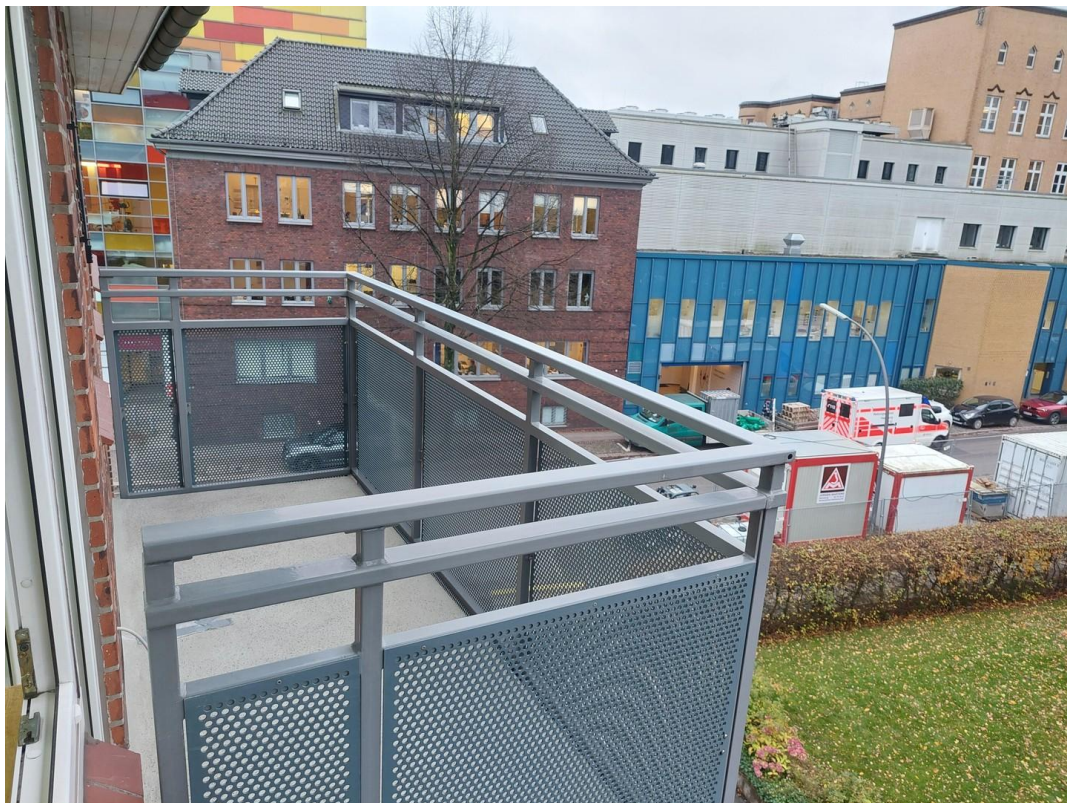
Balkon - Ansicht #1