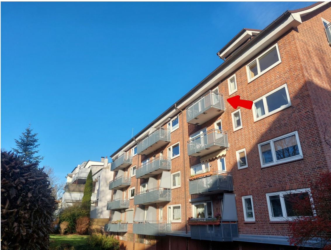
Außenansicht - Ansicht #2