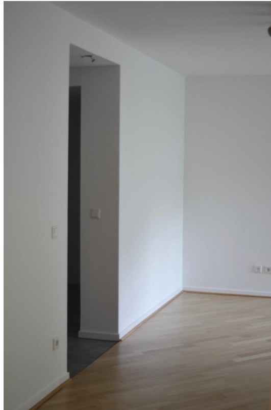
Zugang zur Küche und Bad