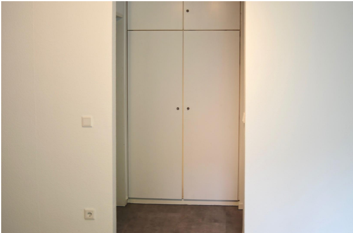
Flur mit Einbauschränk