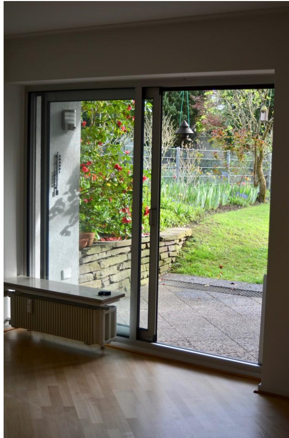
Zugang zur Terrasse