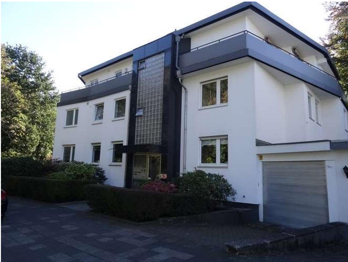
Außenansicht mit Garage