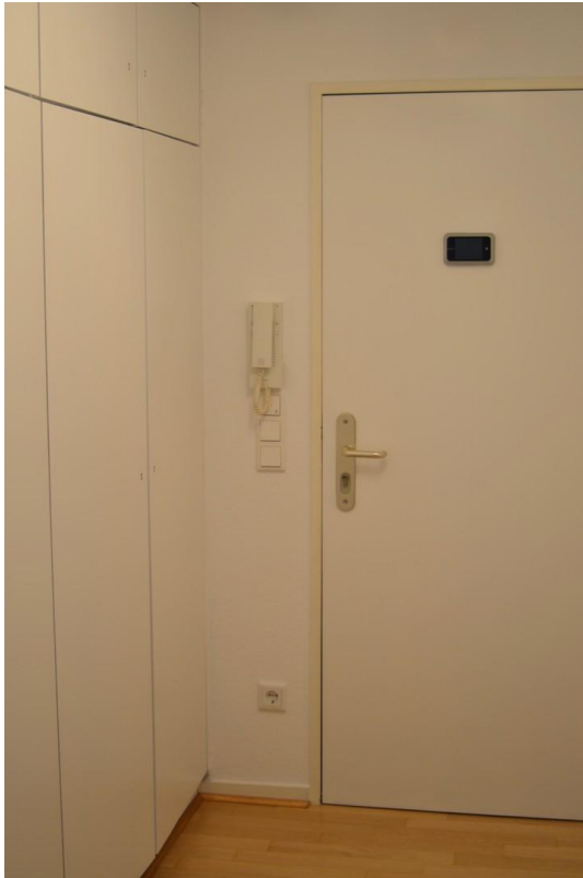
Wohnungstür mit Kamera