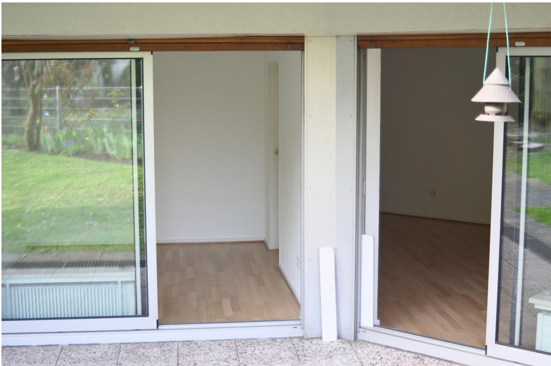
Zugang in Wohn- und Schlafräum