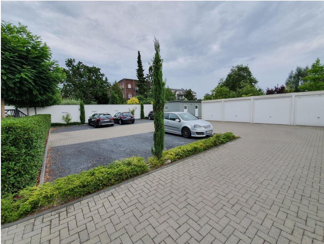
Innenhof mit Parkmöglichkeiten