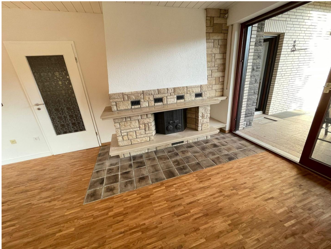
Wohnzimmer / Kamin