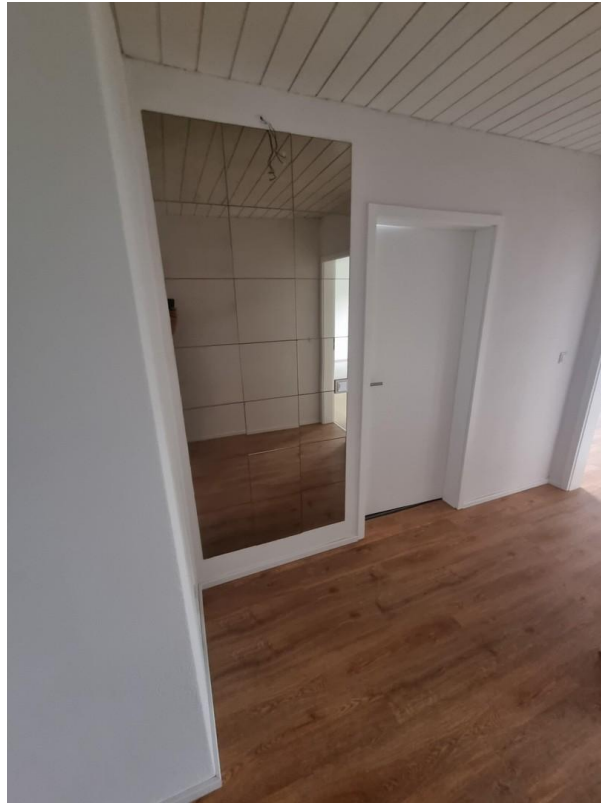
Flur 1 (vor Bad)