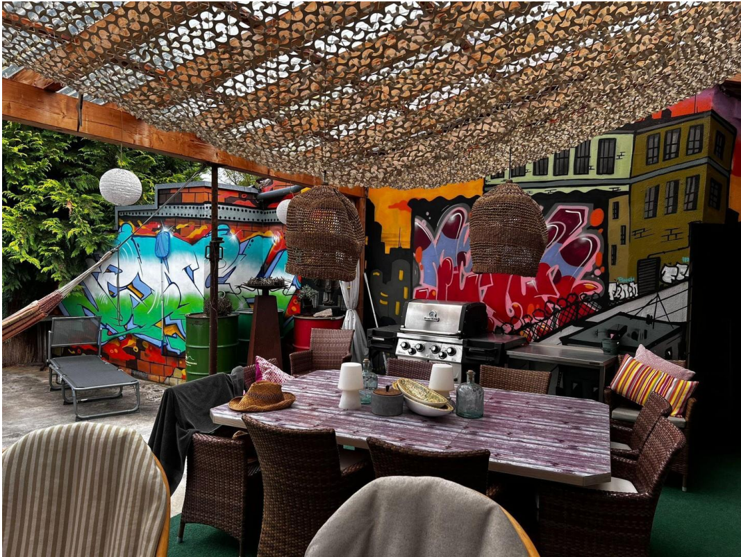
Terrasse mit Überdachung