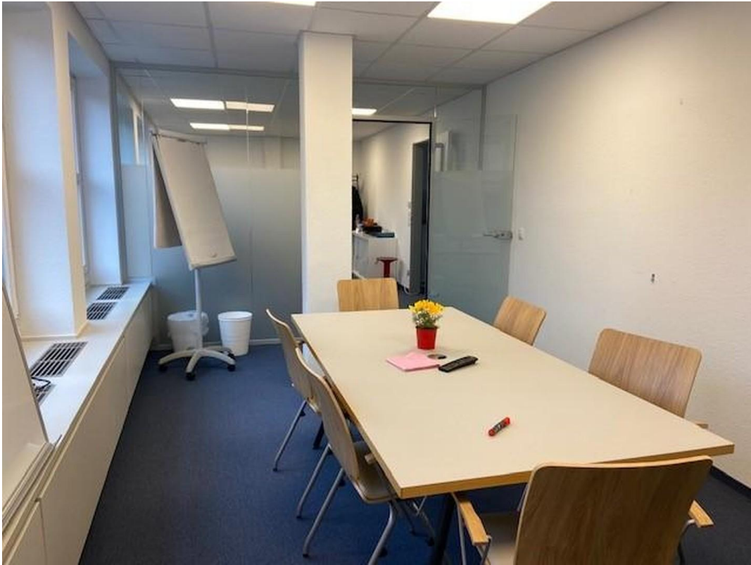
Meetingraum oder Büroraum 3