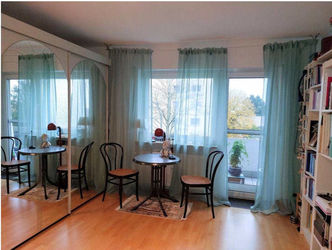
Arbeits- oder Schlafzimmer