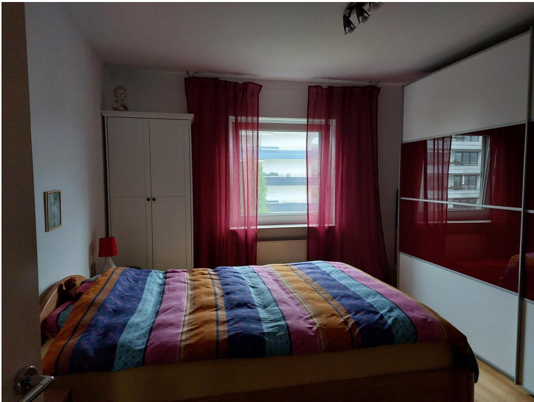
Schlaf- oder Kinderzimmer