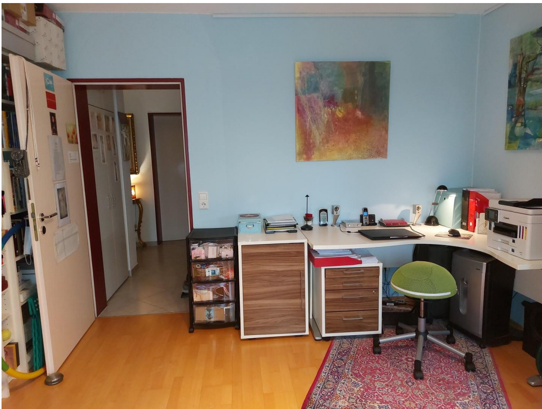
Arbeits- oder Schlafzimmer