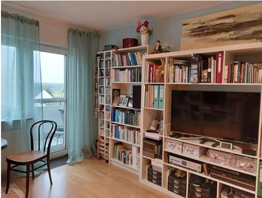
Arbeits- oder Schlafzimmer