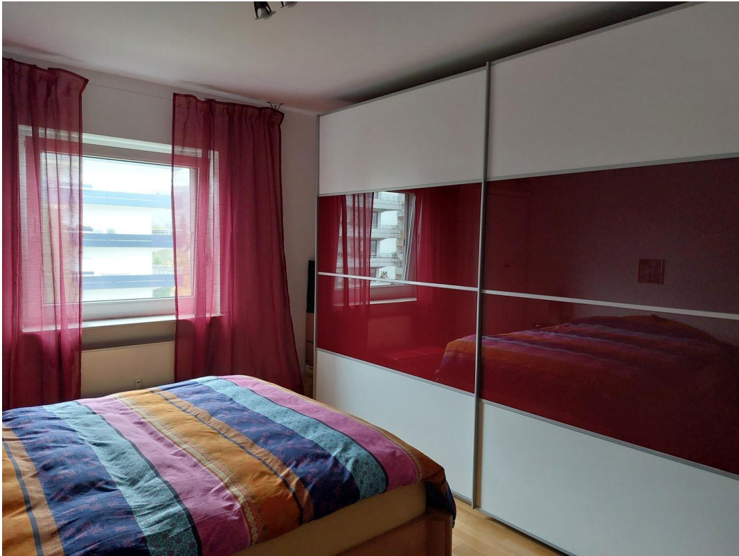
Schlaf- oder Kinderzimmer