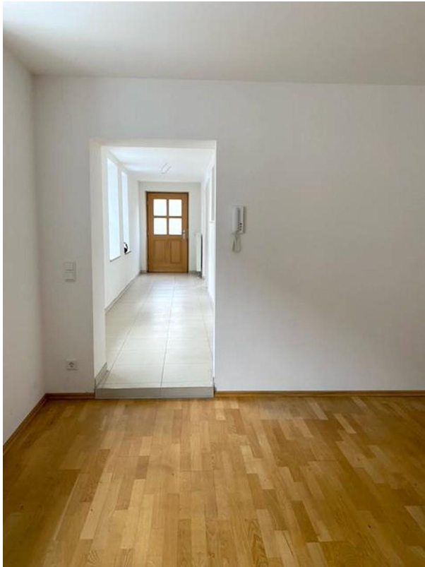
Raum mit Ausgang