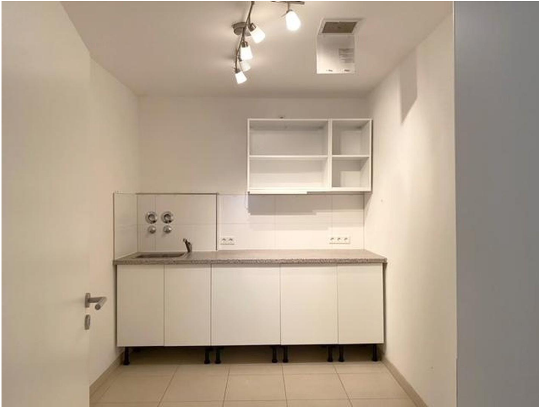
Küchen / Abstellraum