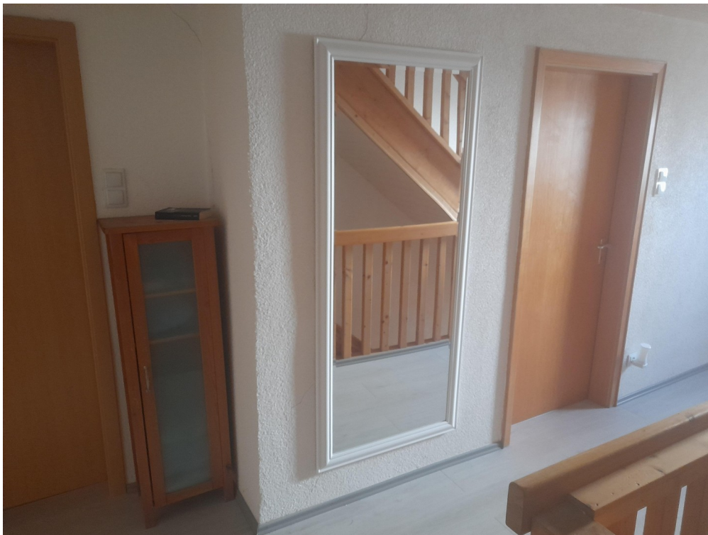
Flur 1. OG