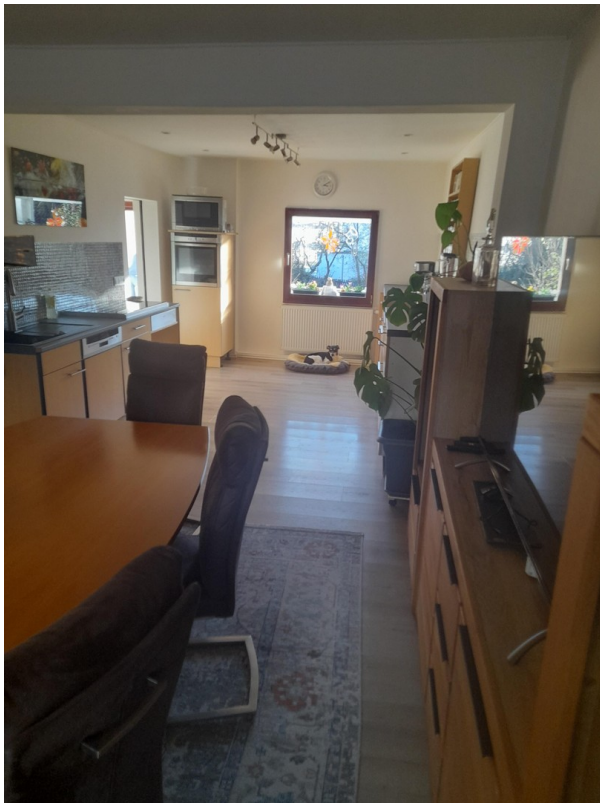
Esszimmer und Küche