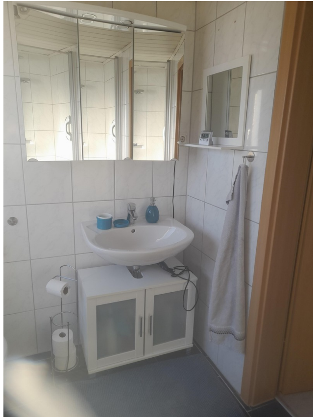
Bad - Wachtisch