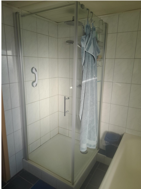
Bad - Dusche