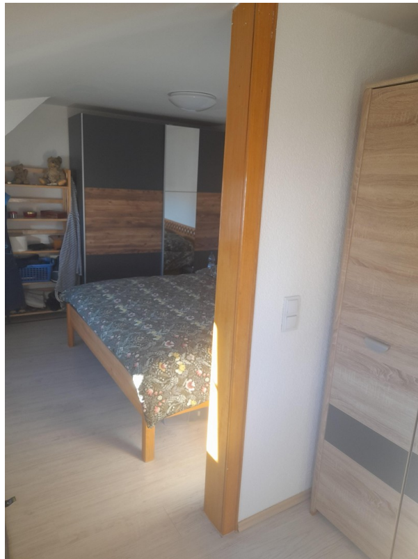
Schlafzimmer Bd 1