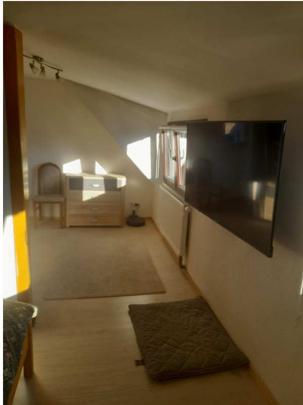
Schlafzimmer Bd 2