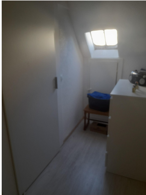
Flur 2. OG