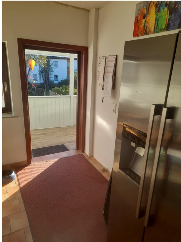
Vorratsraum mit Zugang Balkon