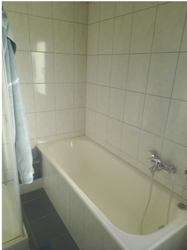
Bad - Wanne