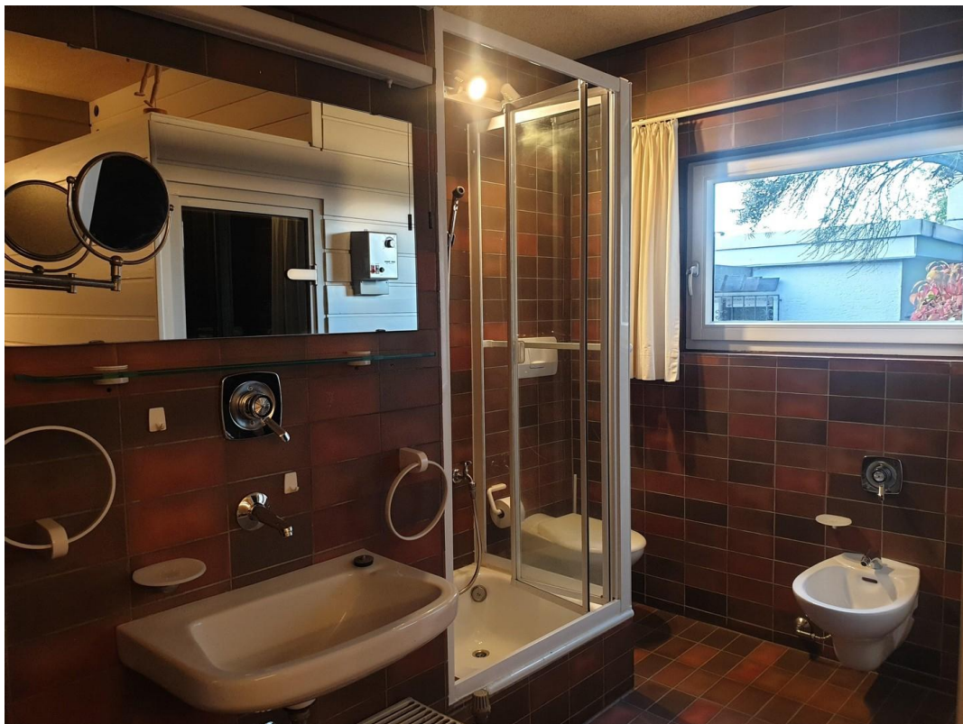
zweites Bad im Saunabereich