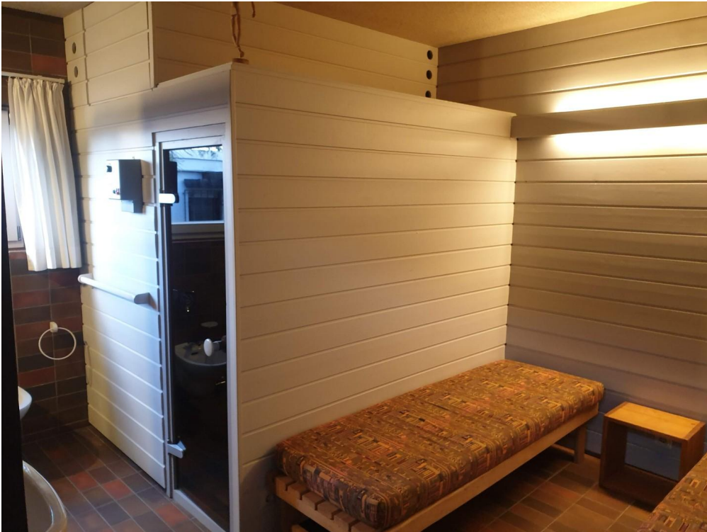
Sauna und Ruhebereich