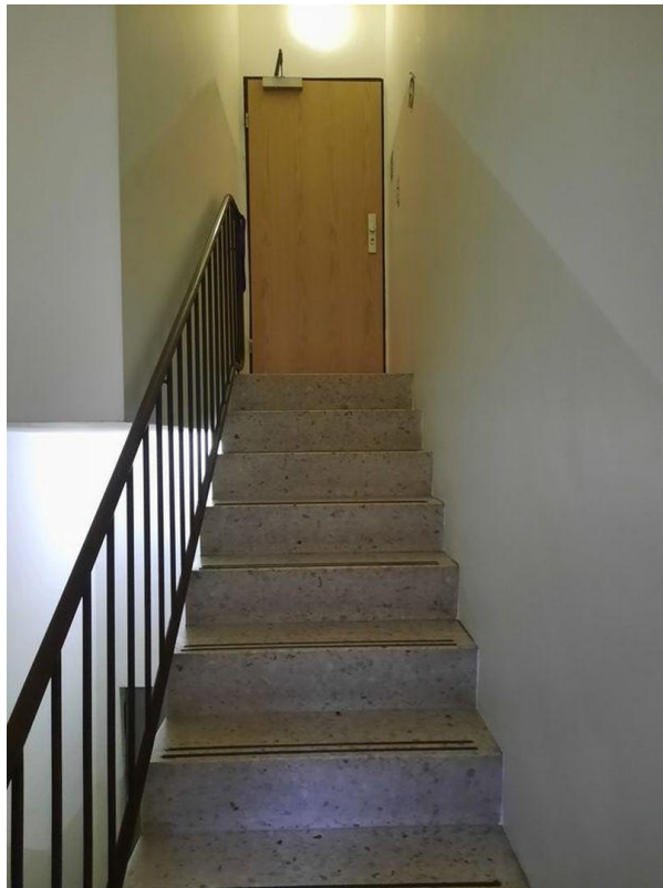
Treppe mit Eingangstür