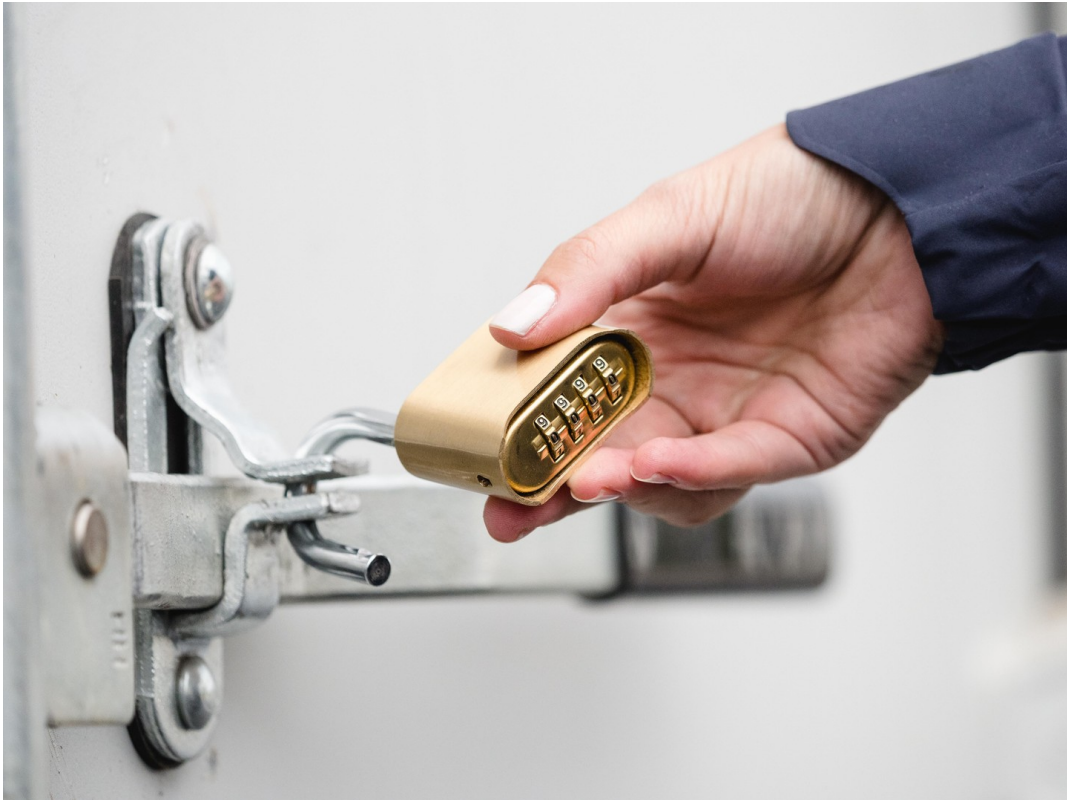
Zugangscode per Email