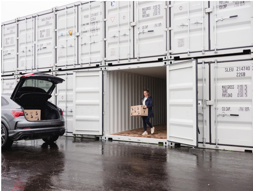
Vor Ihre Einheit fahren