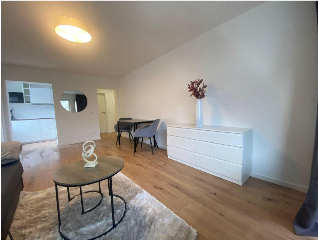
Wohnzimmer mit Essbereich