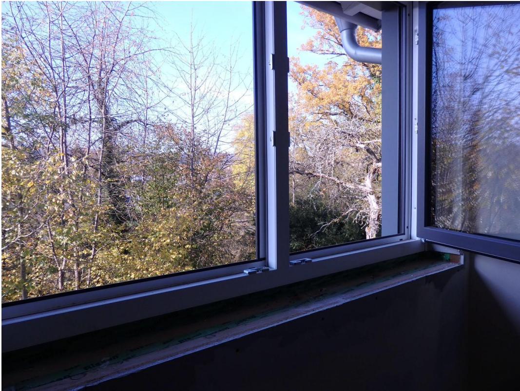
Schlafen Nordwest Ausblick