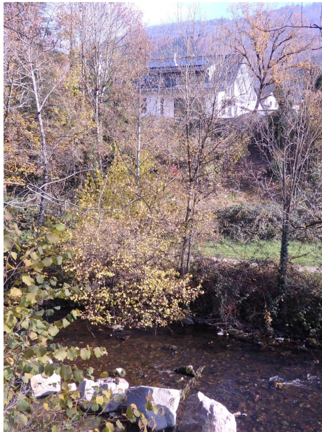
Ansicht von der Wehra