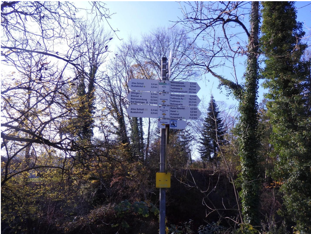
Wegweiser Talseite Wanderweg