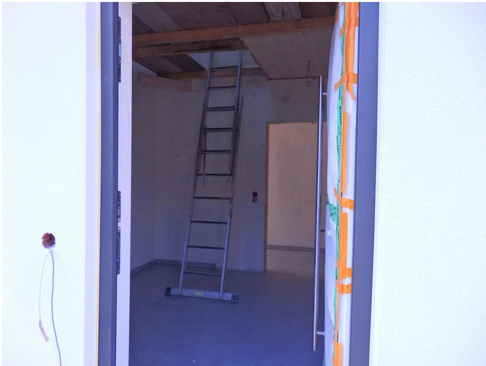
Hauseingang für 2 WE