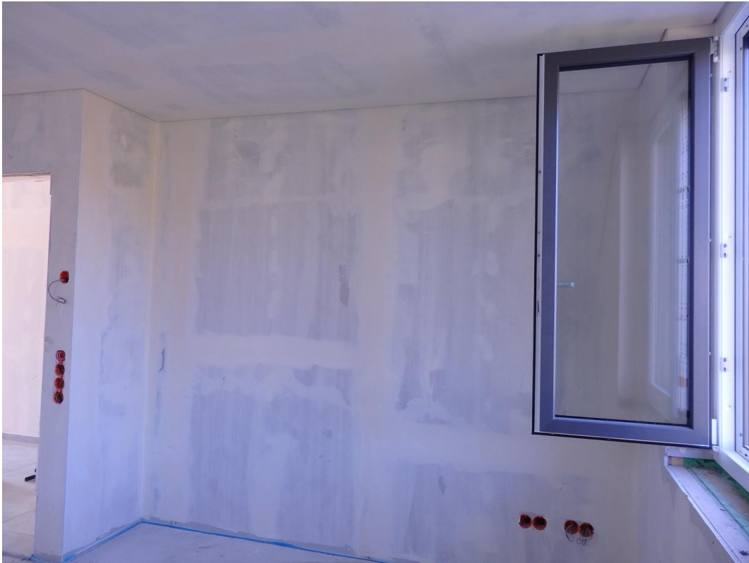
SZ NO mit gr. Stellwand