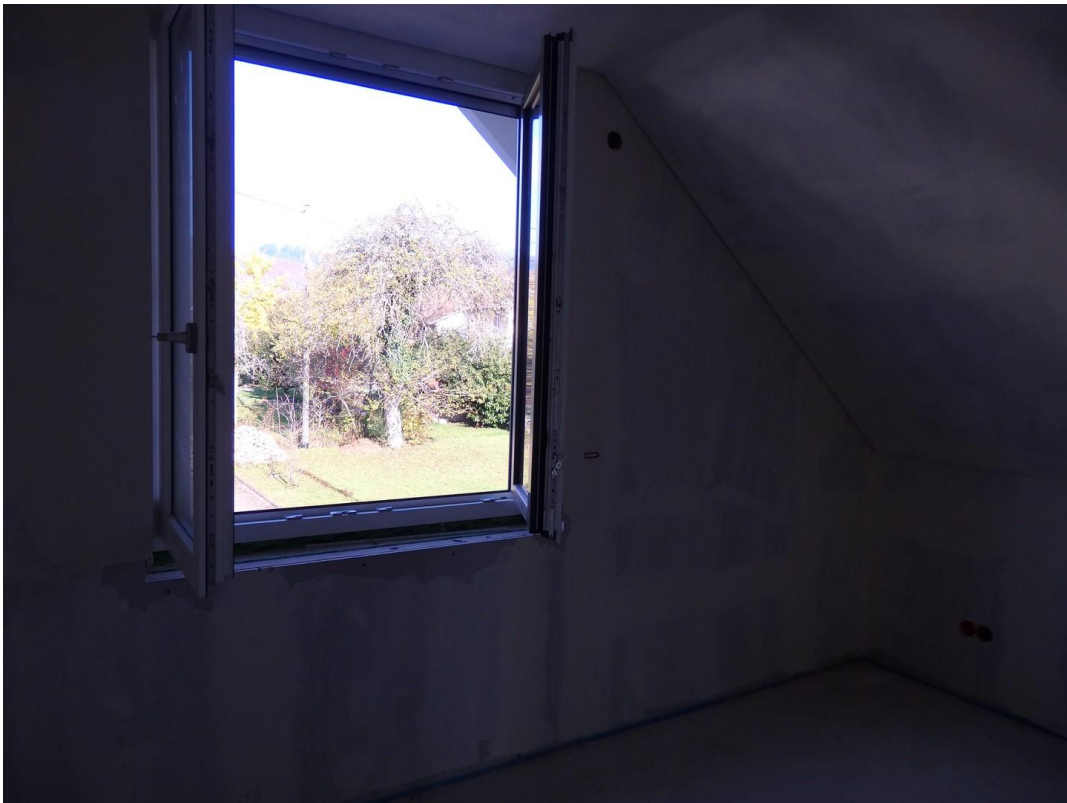
SZ NO Nordausblick