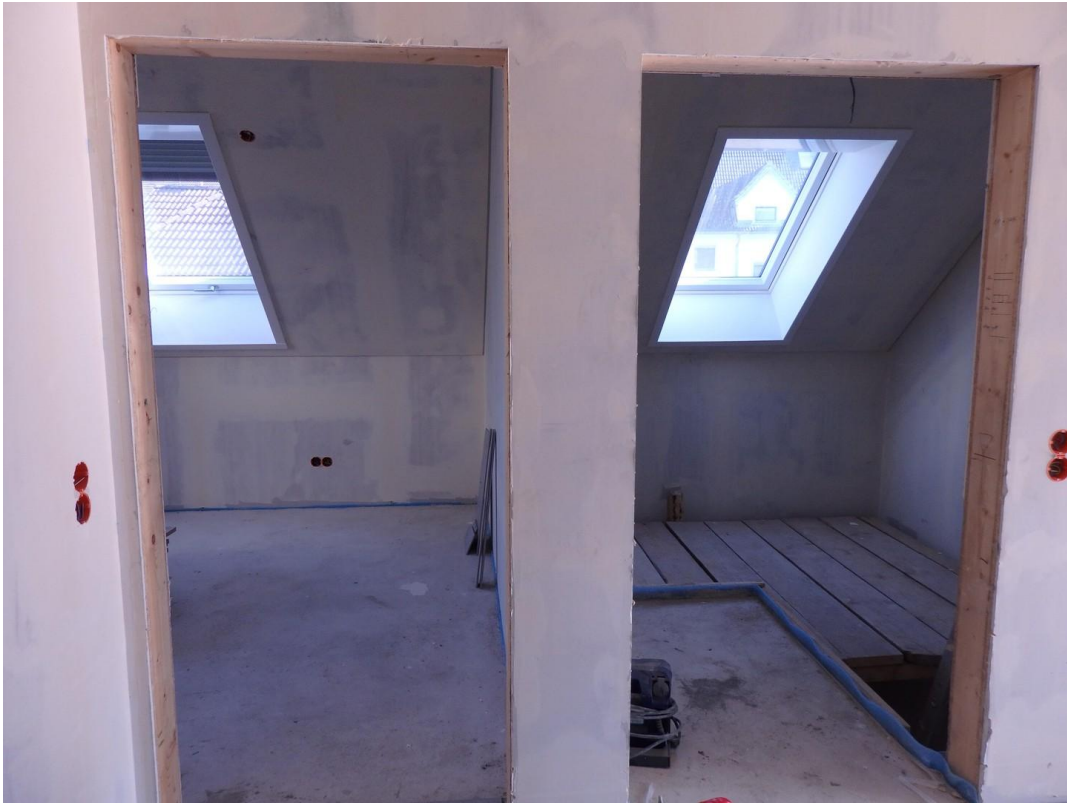
Eingangsber rechts SZ NO links