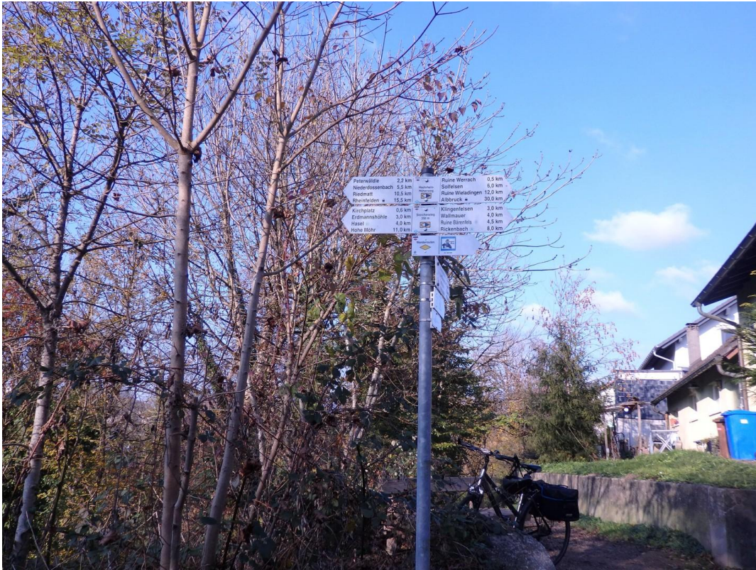
Wegweiser bei Holzbrücke