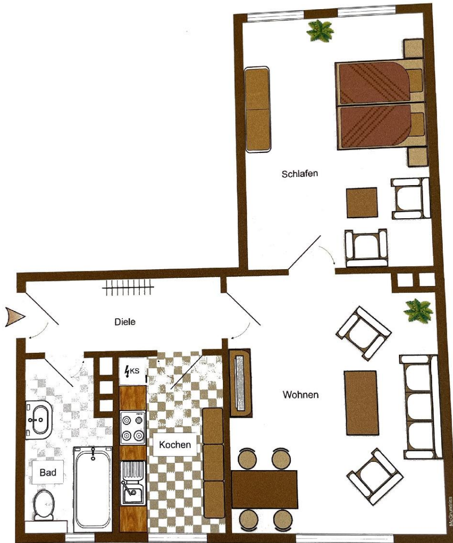
Grundriss, Erdgeschoss Wohnung Nr. 2