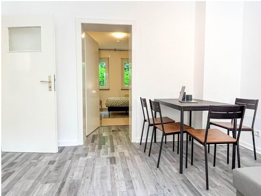
Essbereich im Wohnzimmer