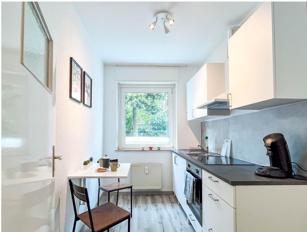
Einbauküche mit Sitzecke