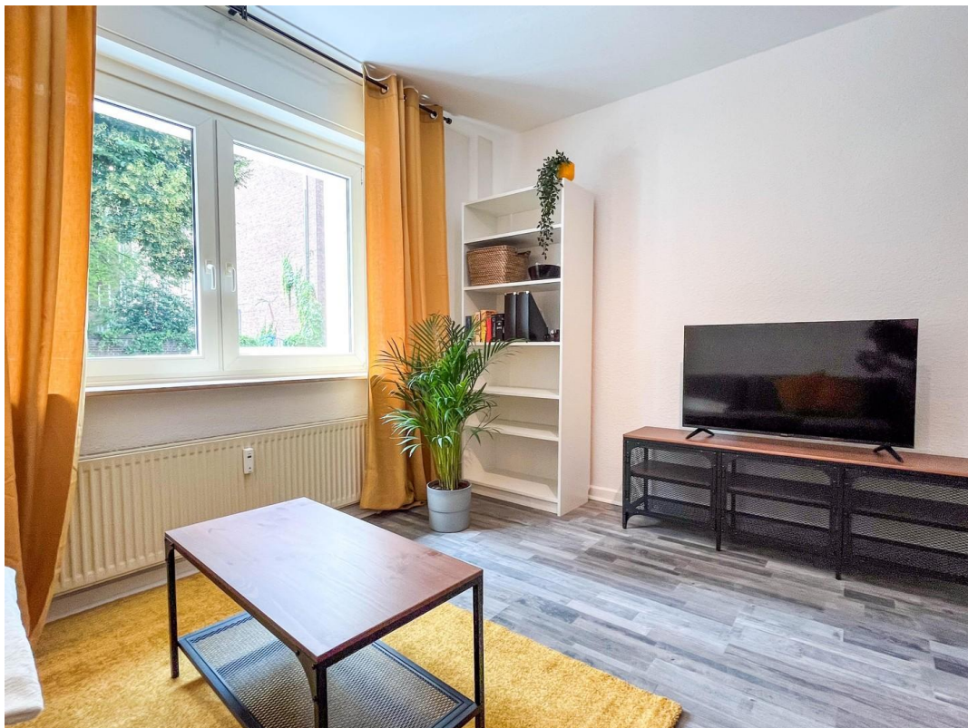
Smart-TV im Wohnzimmer