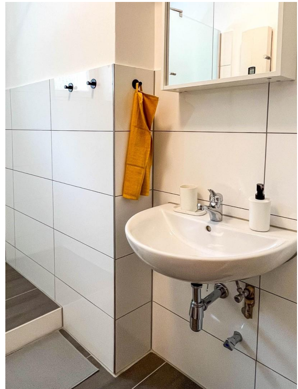
Frisch renoviertes Badezimmer