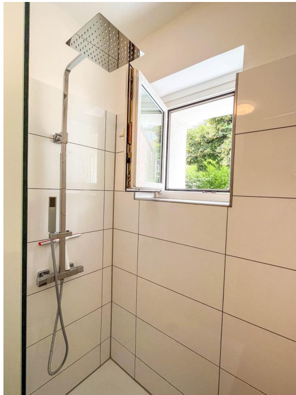
Gute Belüftung durch Fenster