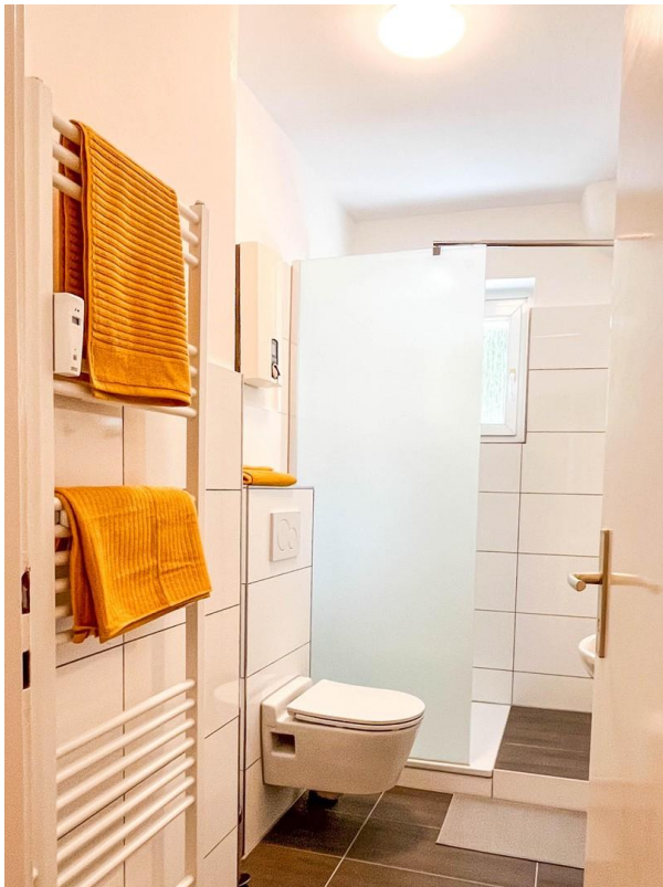
Frisch renoviertes Badezimmer