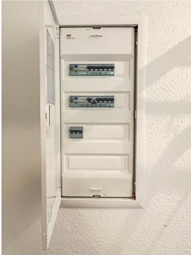
Elektrik auf neuestem Stand