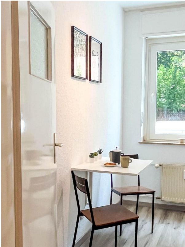
Sitzecke in der Küche