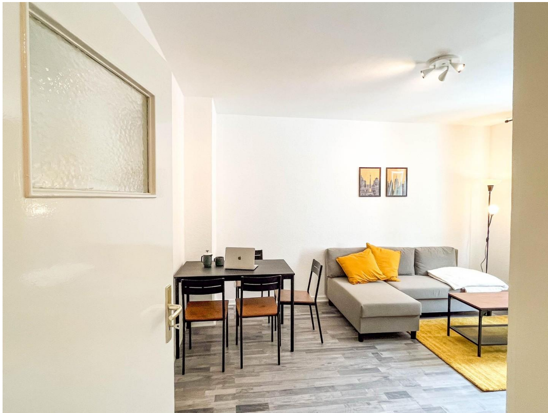
Essbereich im Wohnzimmer