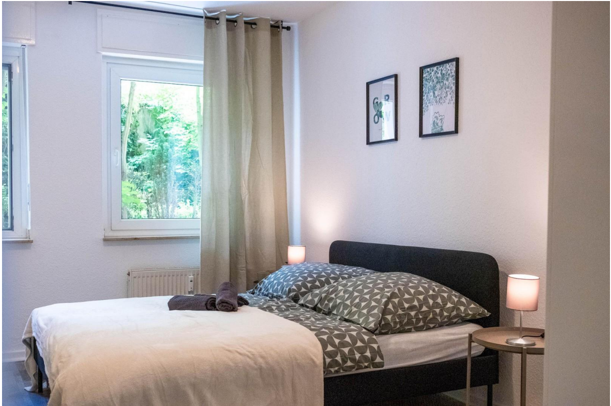
160 cm x 200 cm Bett