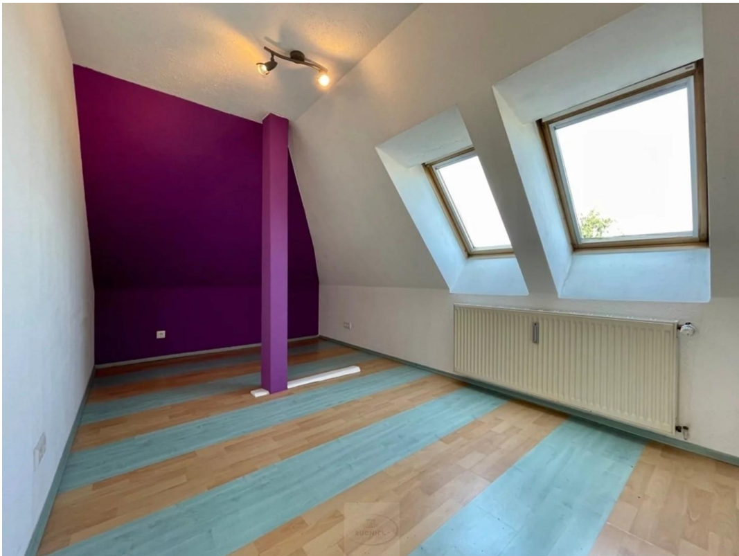
Zimmer 2 DG