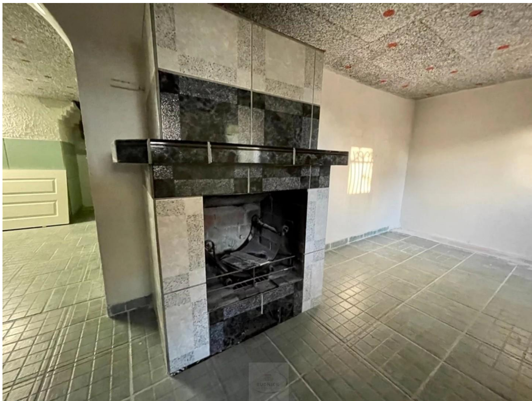
Einer von drei Kellerräumen