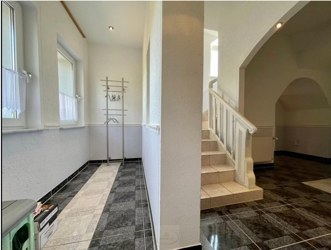
Flur, Garderobe, Treppe zum OG