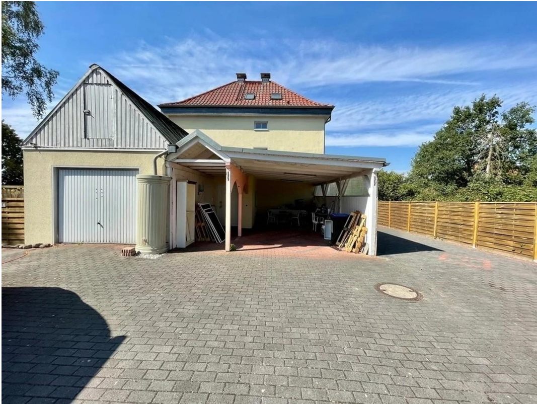
Garage und Carport