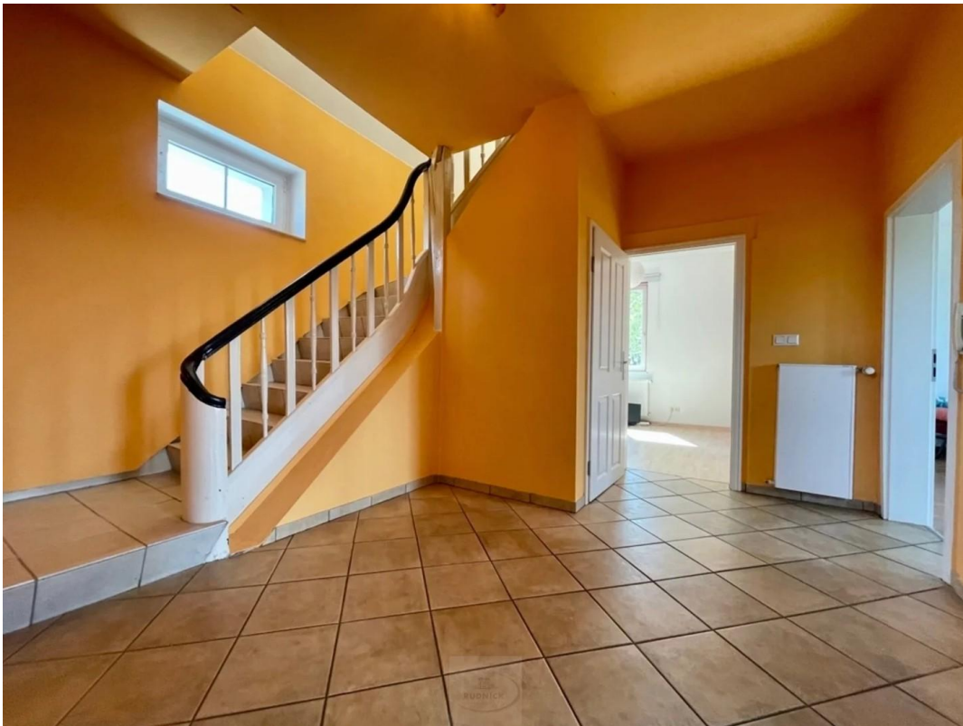
Flur OG, Treppe zum DG