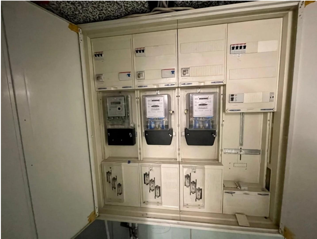
Schaltkasten Strom im Keller