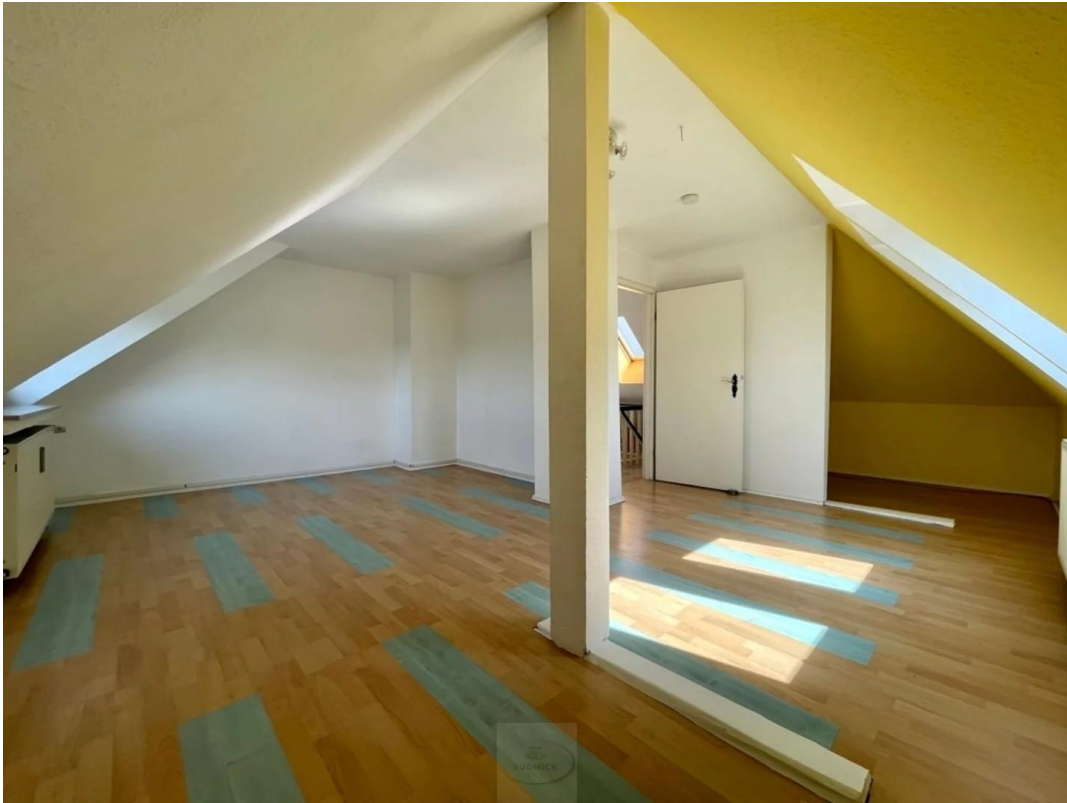
Zimmer 1 DG