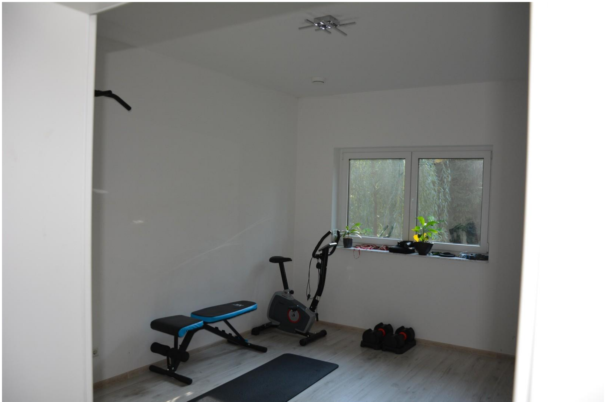
Zimmer EG Haus 1