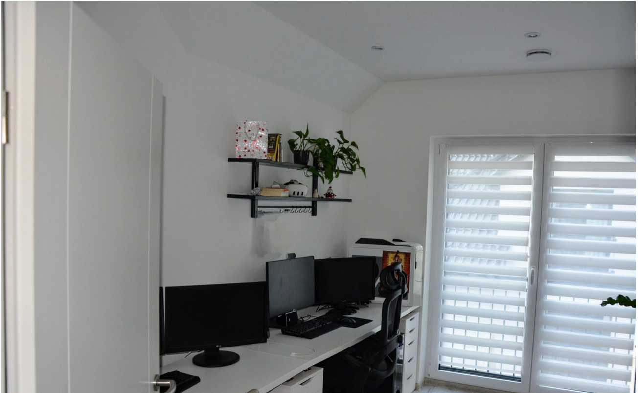
Büro 2. OG Haus 1