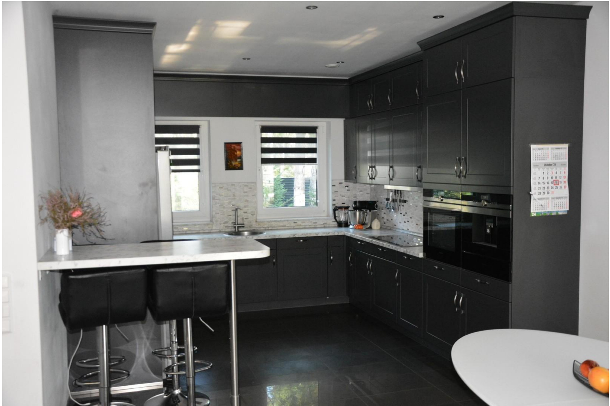
Küche Haus 2