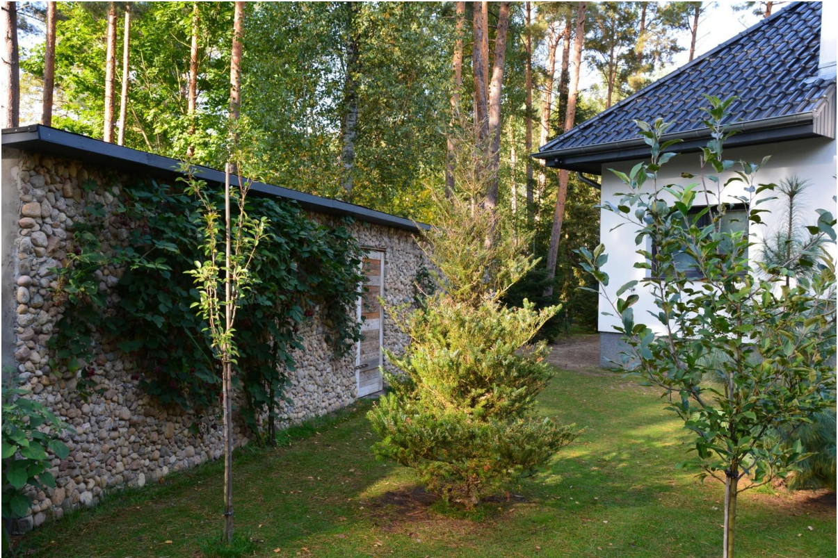
Haus 1 und Schuppen