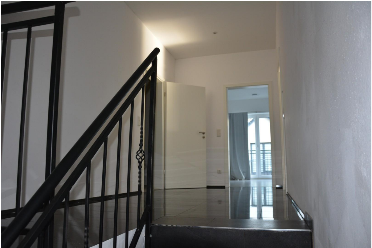
2. Obergeschoss Flur Haus 2