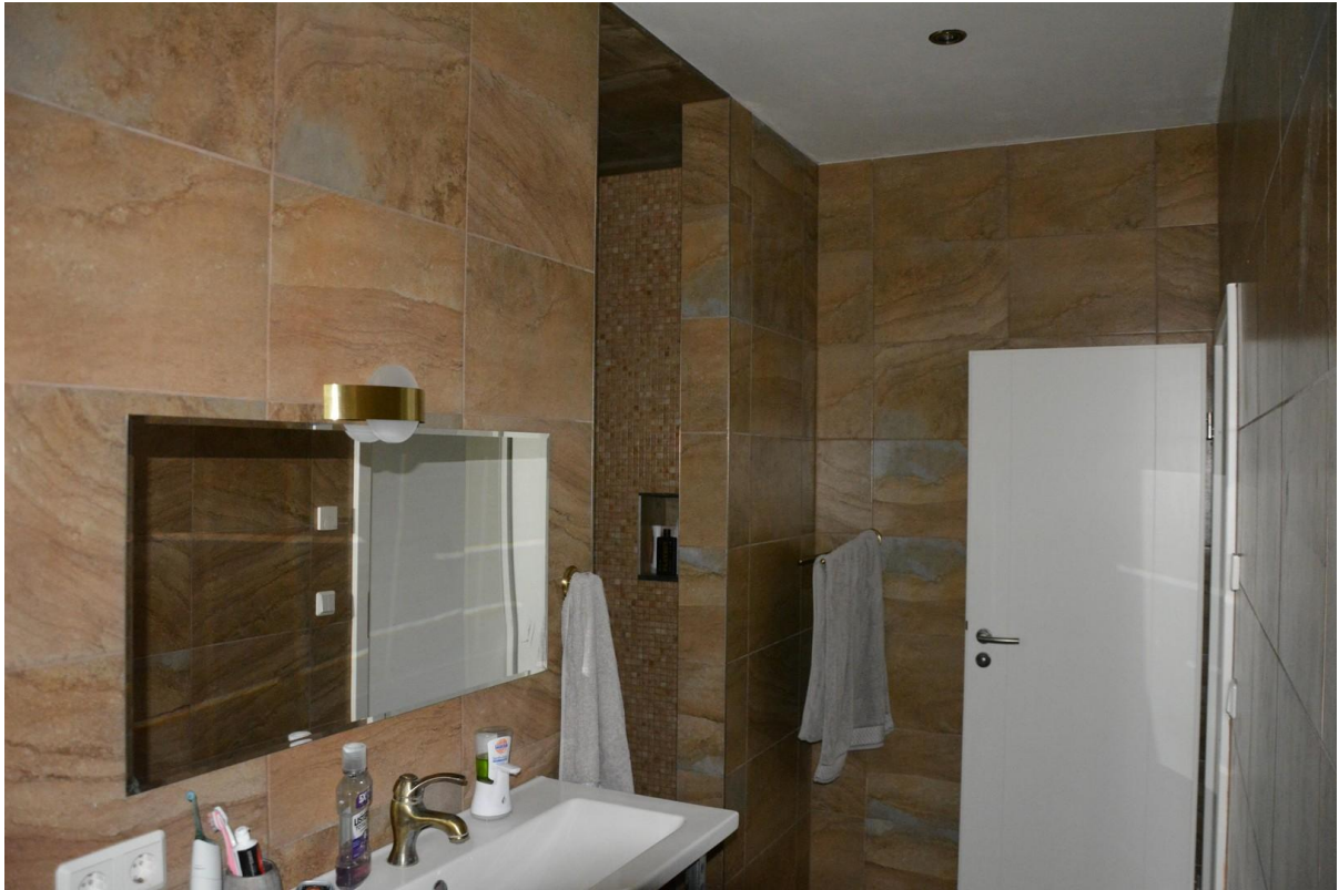
Badezimmer EG Haus 2