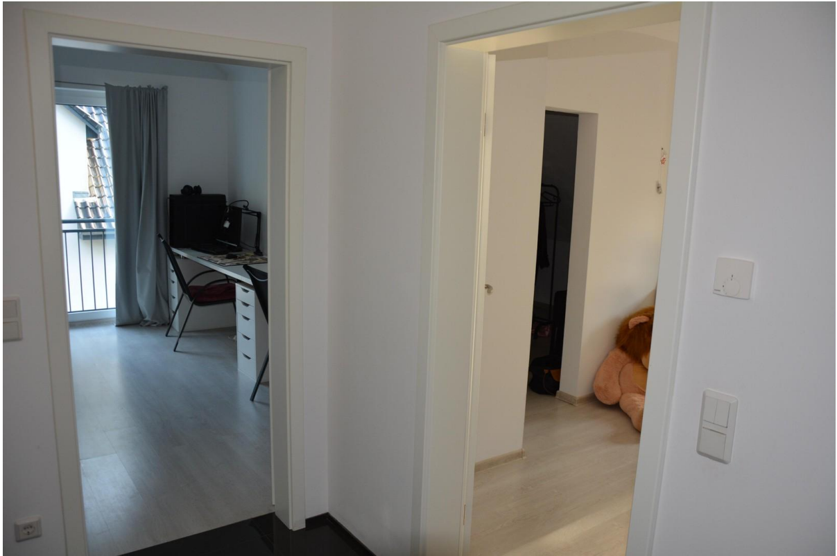
2. OG Büro / Schlafz. Haus 2