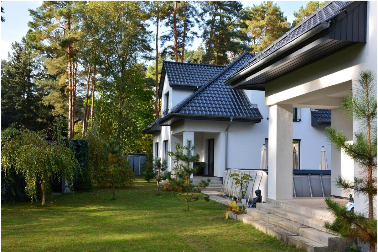
Blick von Haus 1 zu Haus 2