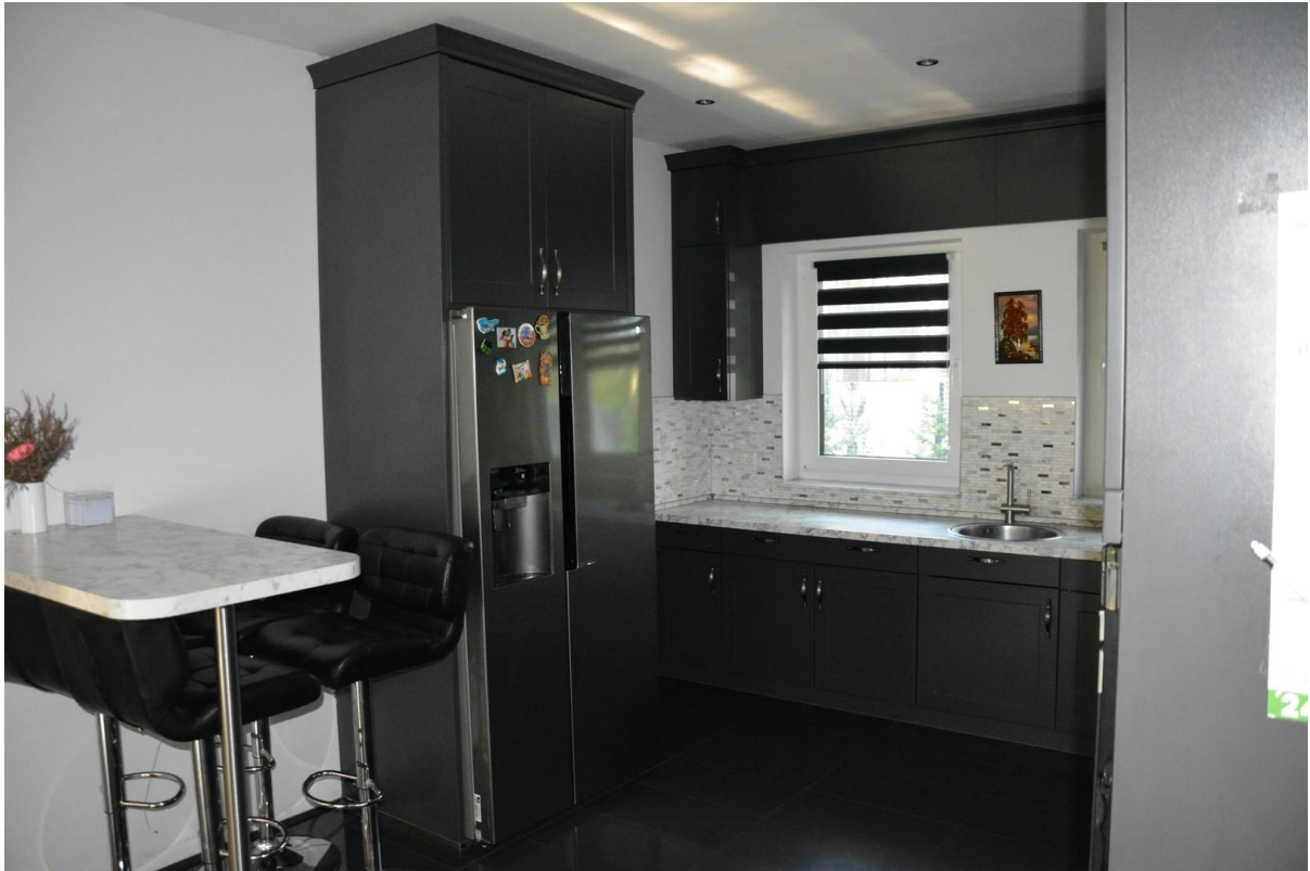
Küche Haus 2