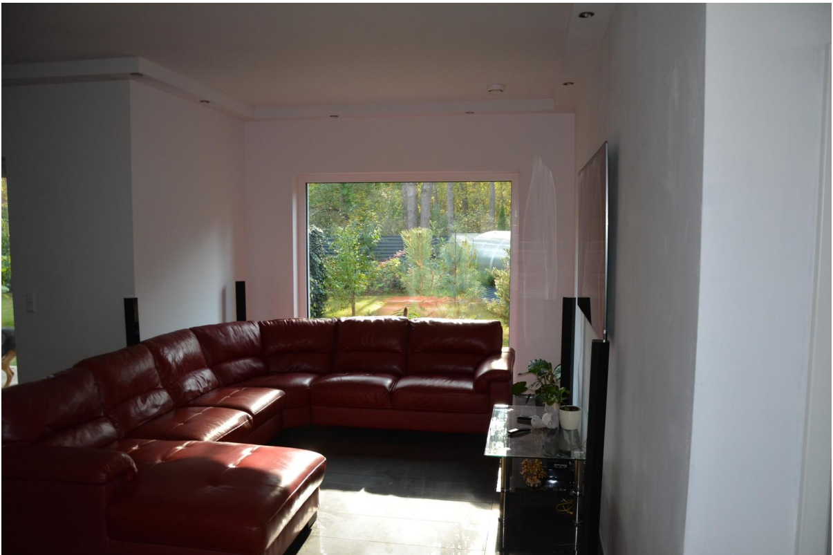
Wohnzimmer Haus 2