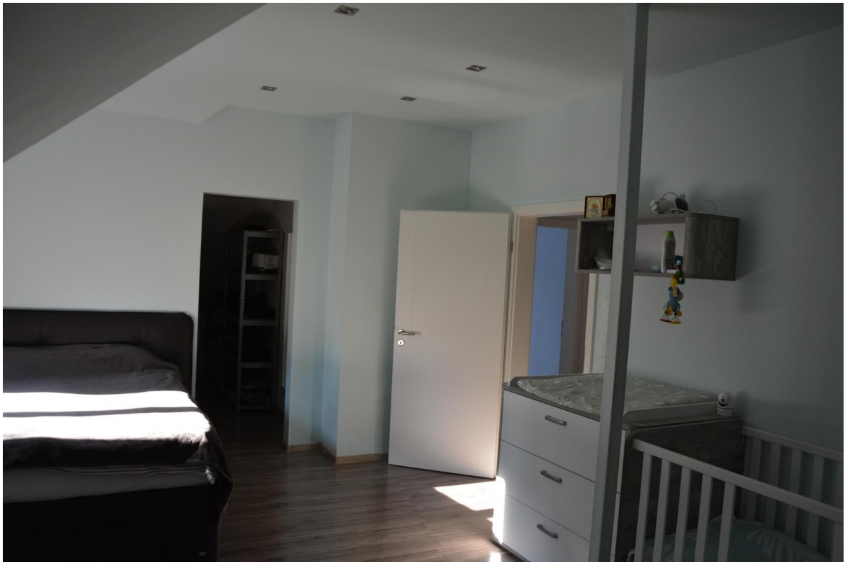
Schlafzimmer 2. OG Haus 1