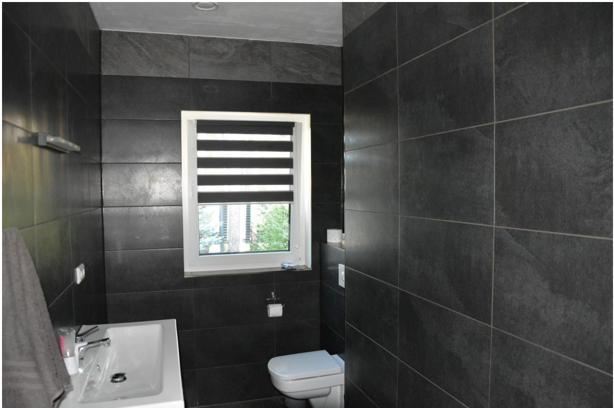
Badezimmer EG Haus 1