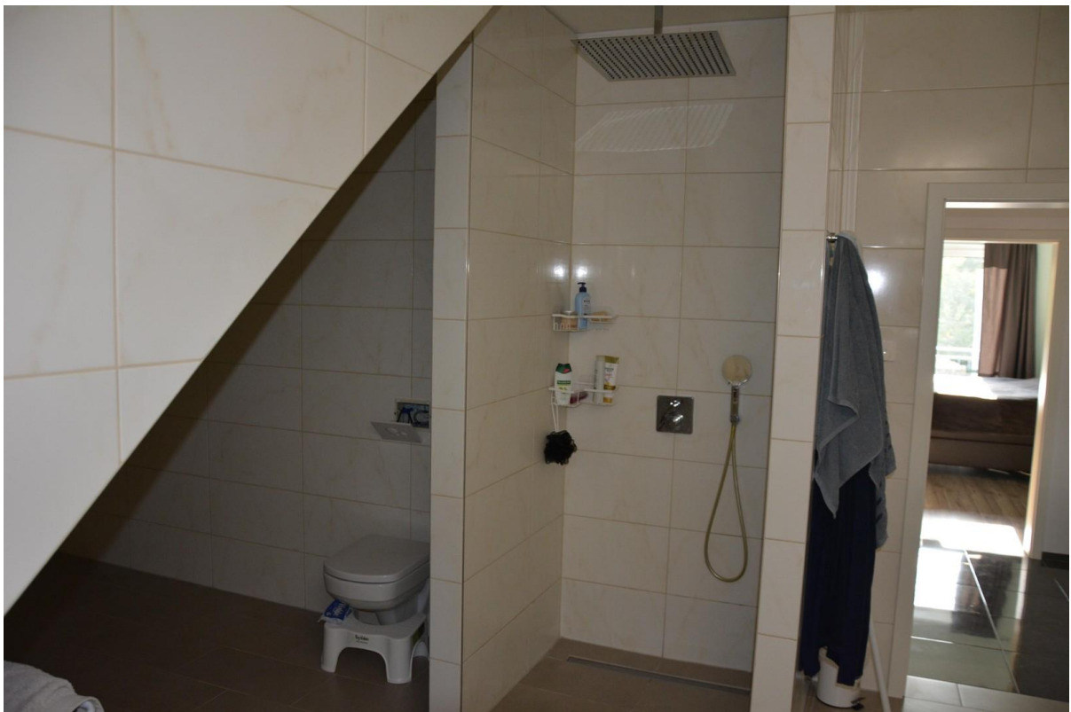
Badezimmer 2. OG Haus 1