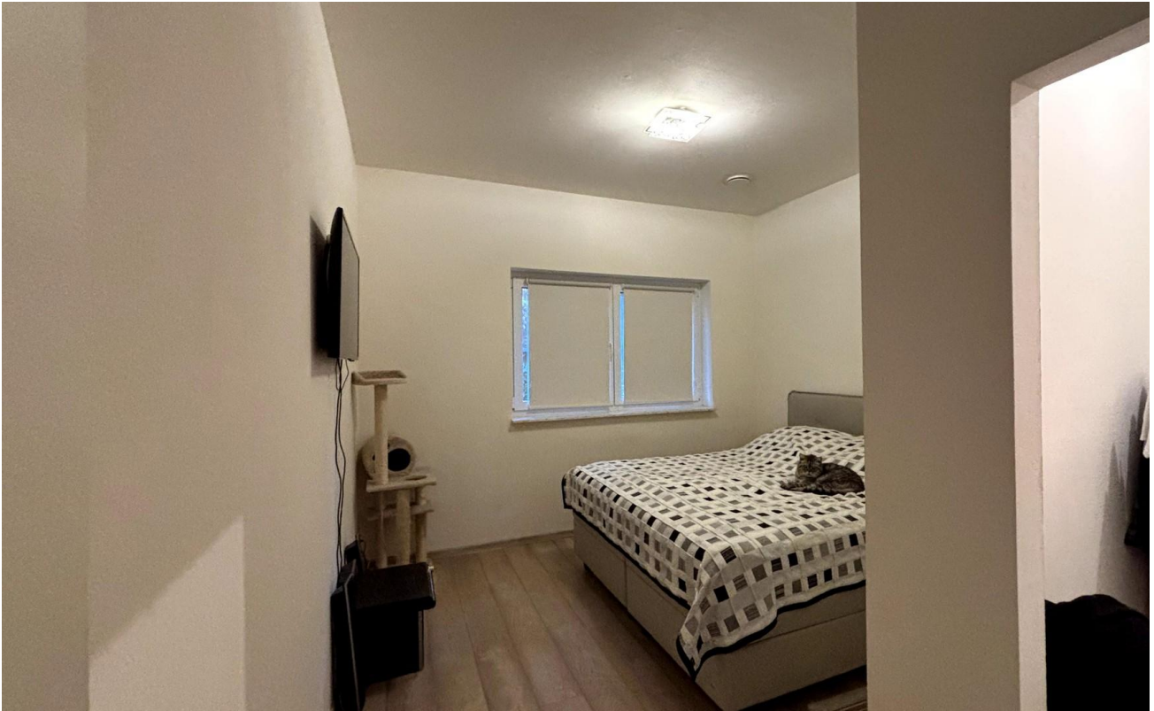
Schlafzimmer EG Haus 2