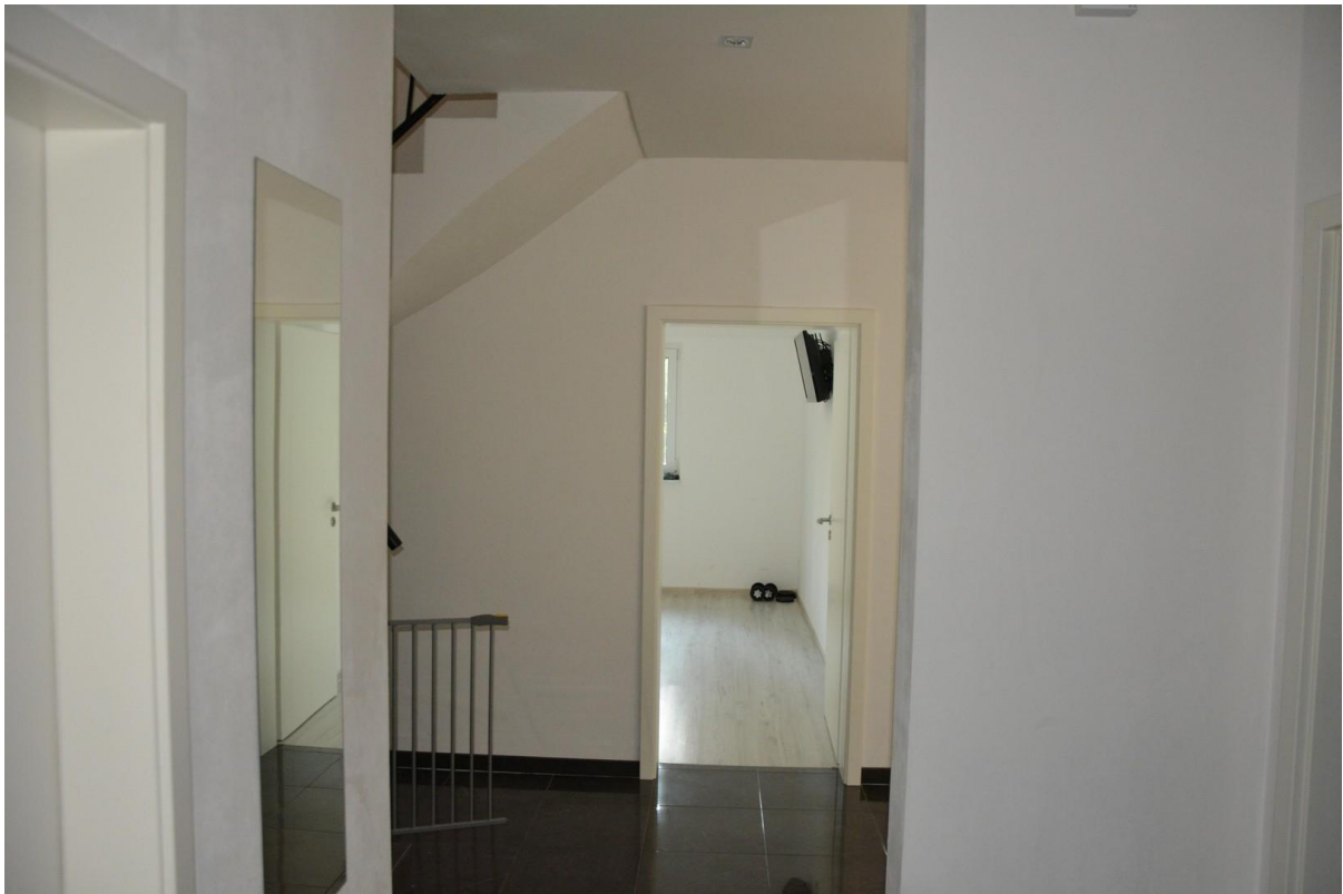
Flur EG Haus 1