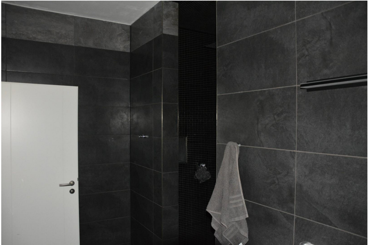
Badezimmer EG Haus 1