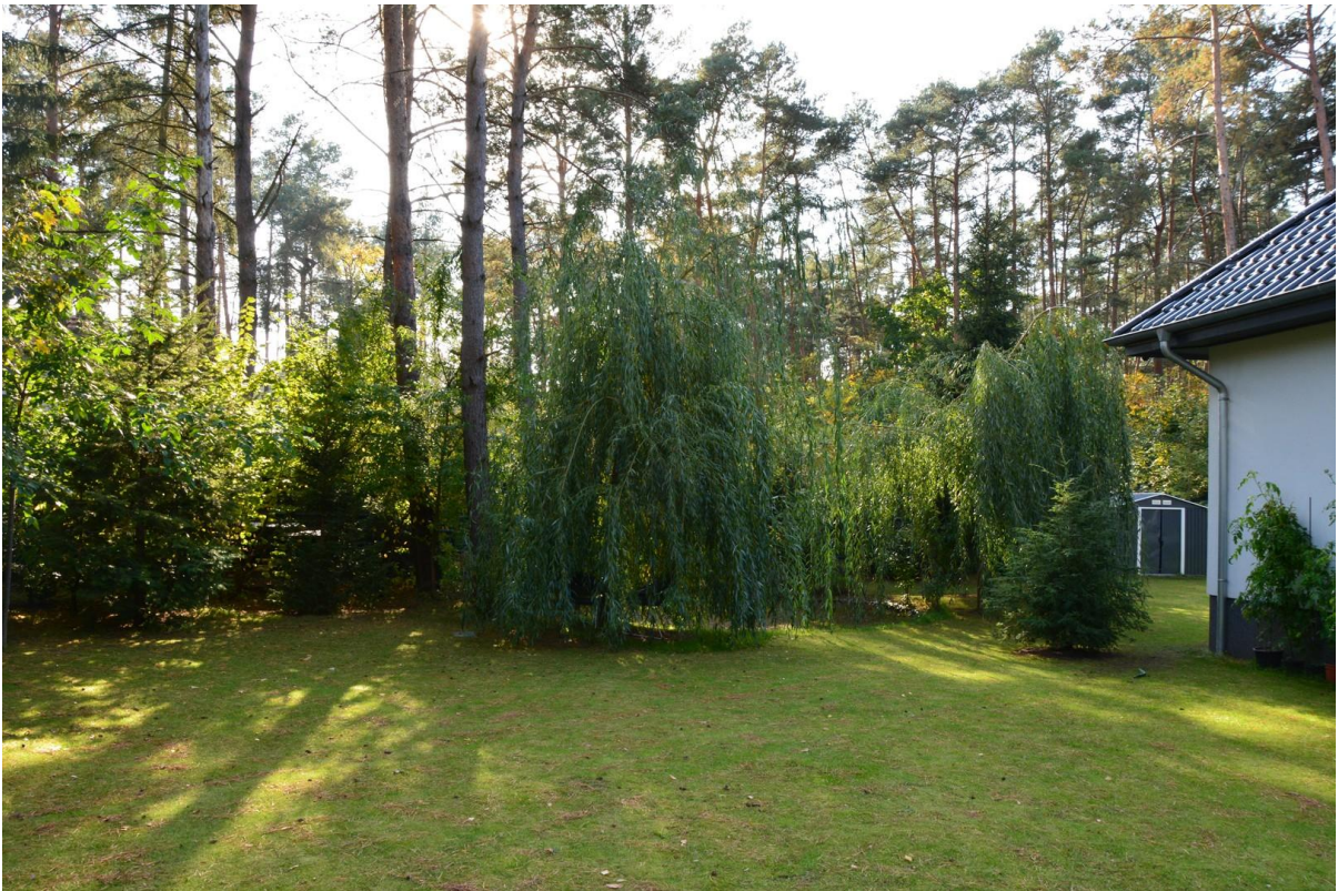
Haus links Rasen