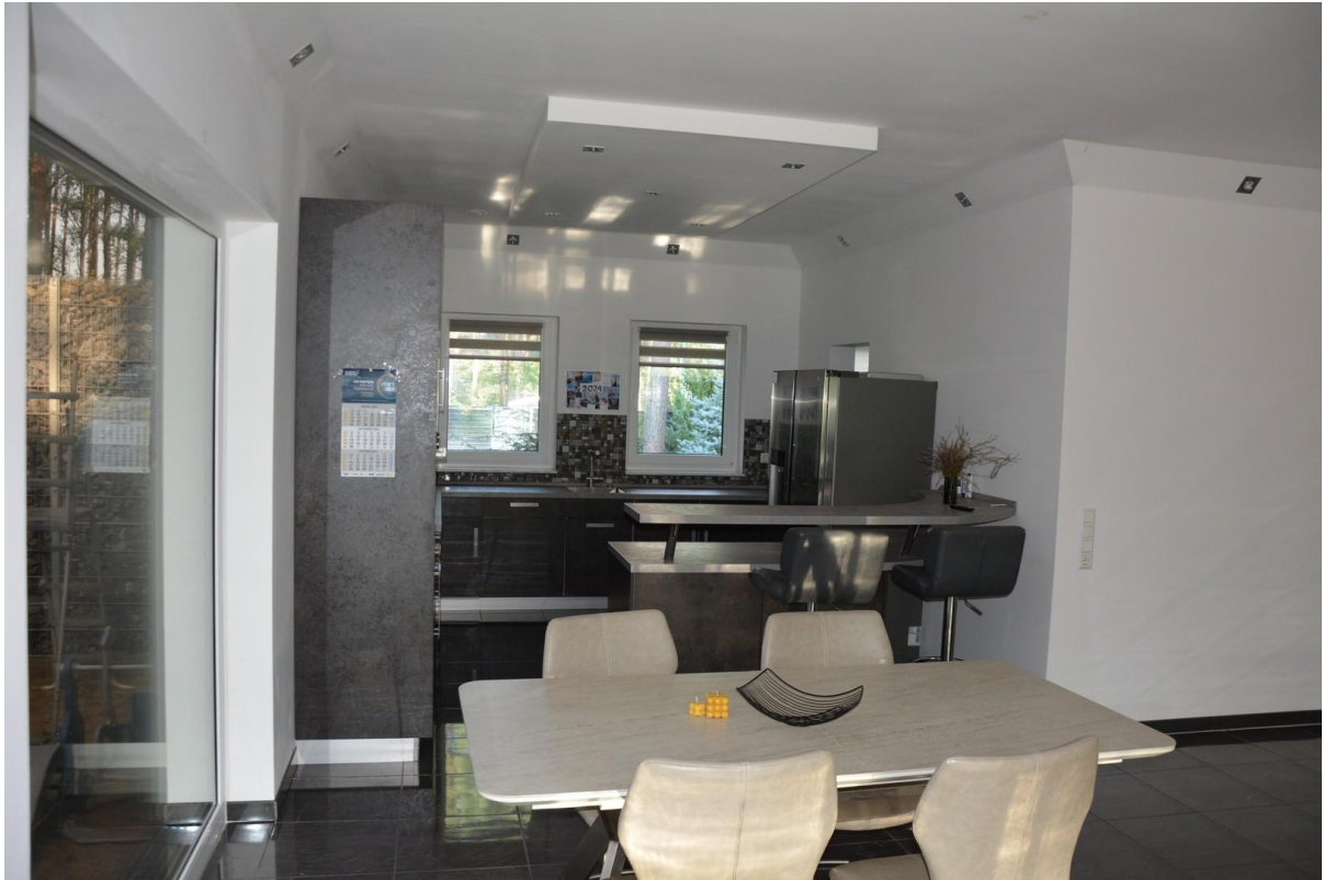
Wohnzimmer/Küche Haus 1