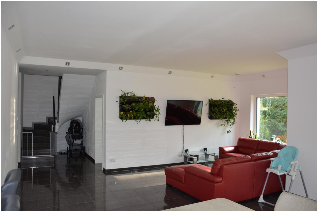
Wohnzimmer Haus 1