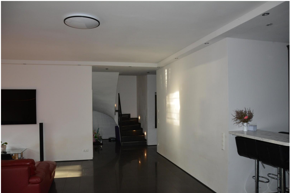
Wohnzimmer Haus 2