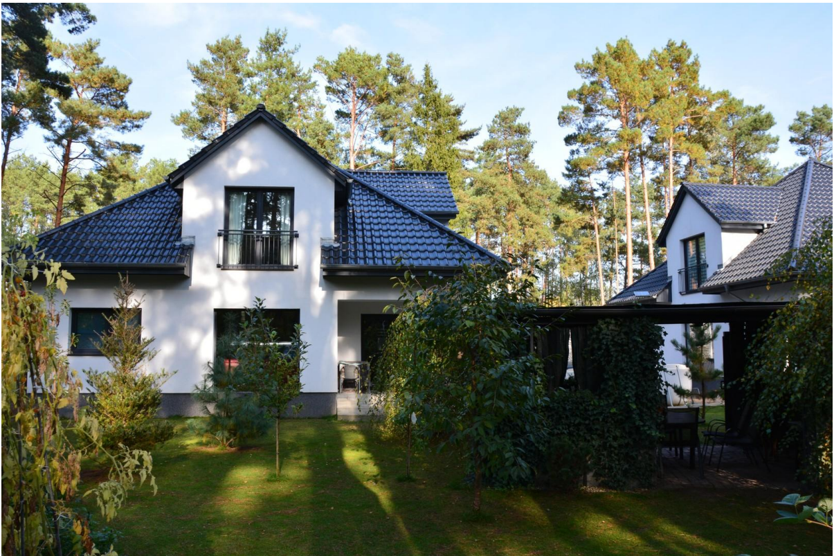
Haus 1 hinten