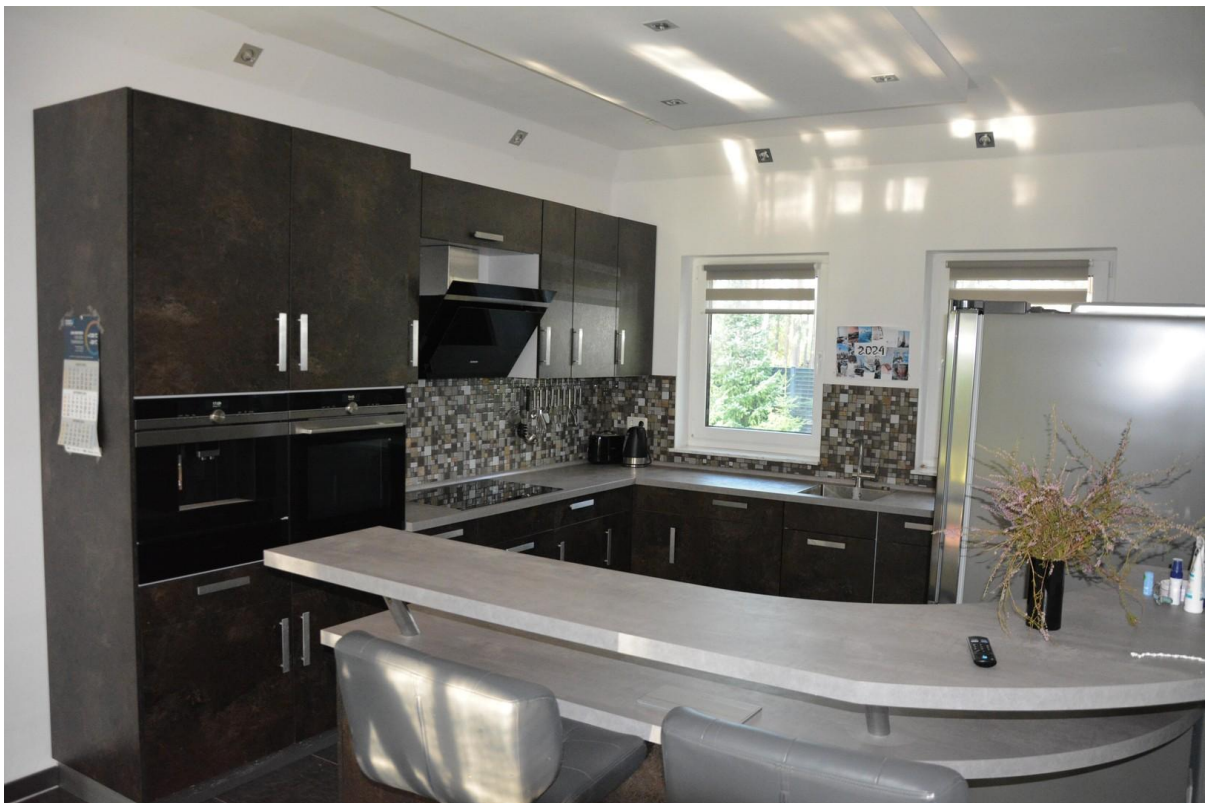
Küche Haus 1