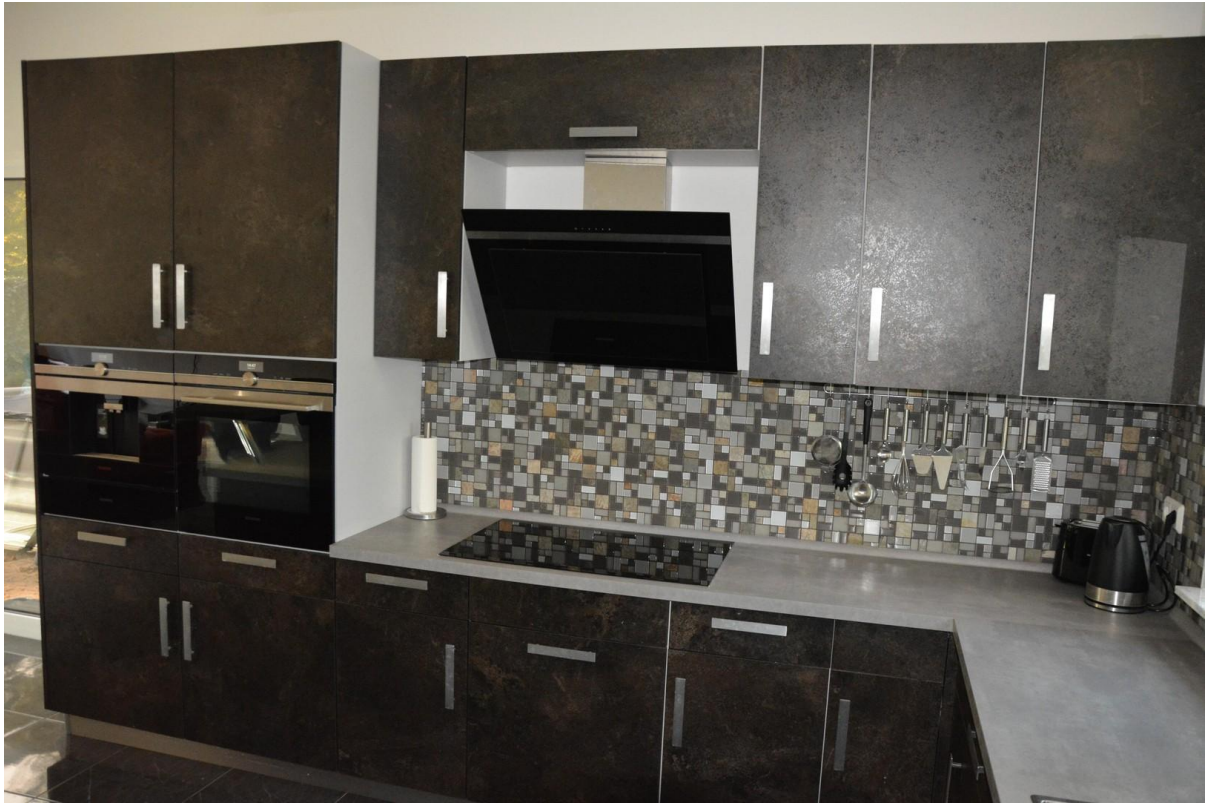
Küche Haus 1