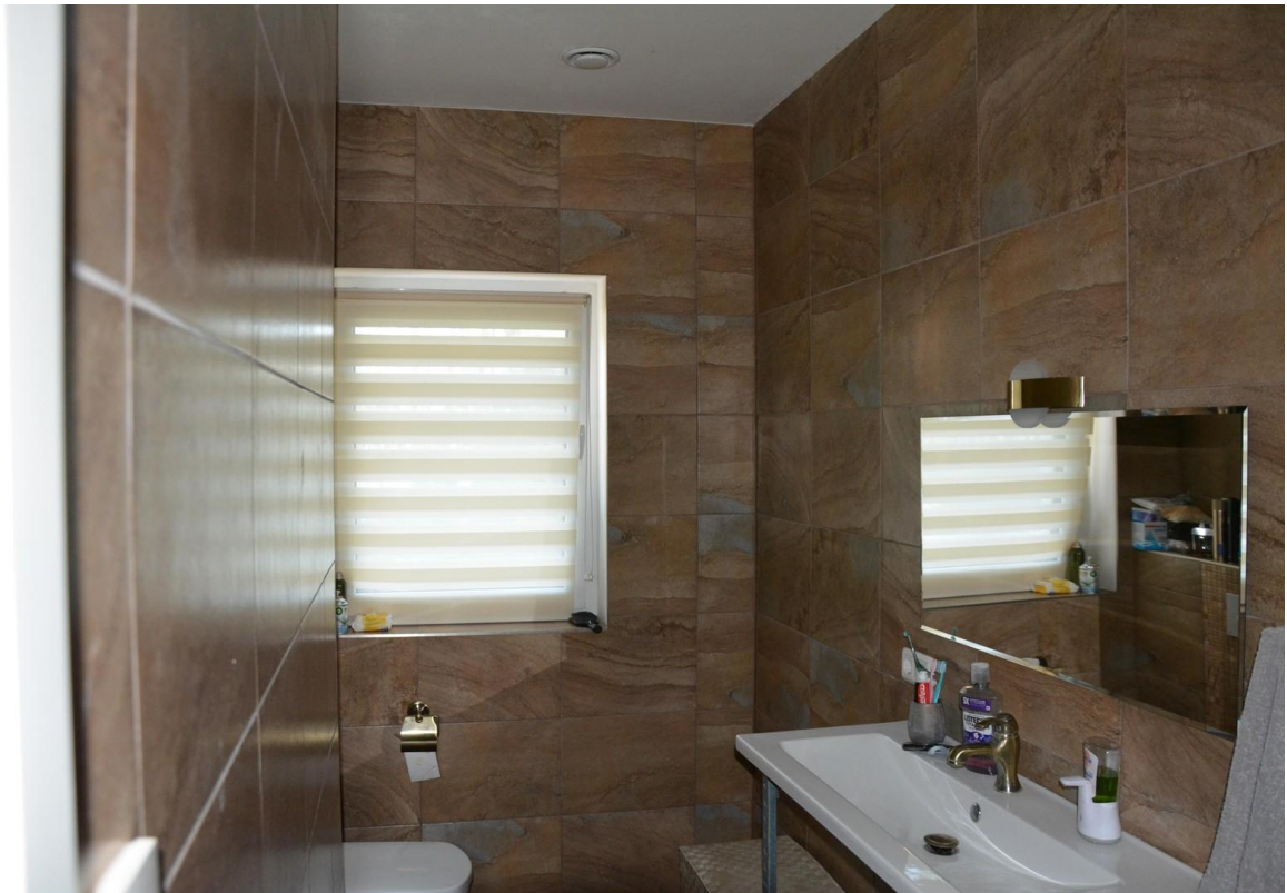
Badezimmer EG Haus 2