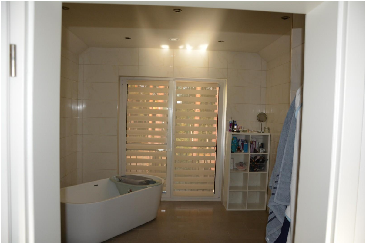
Badezimmer 2. OG Haus 1