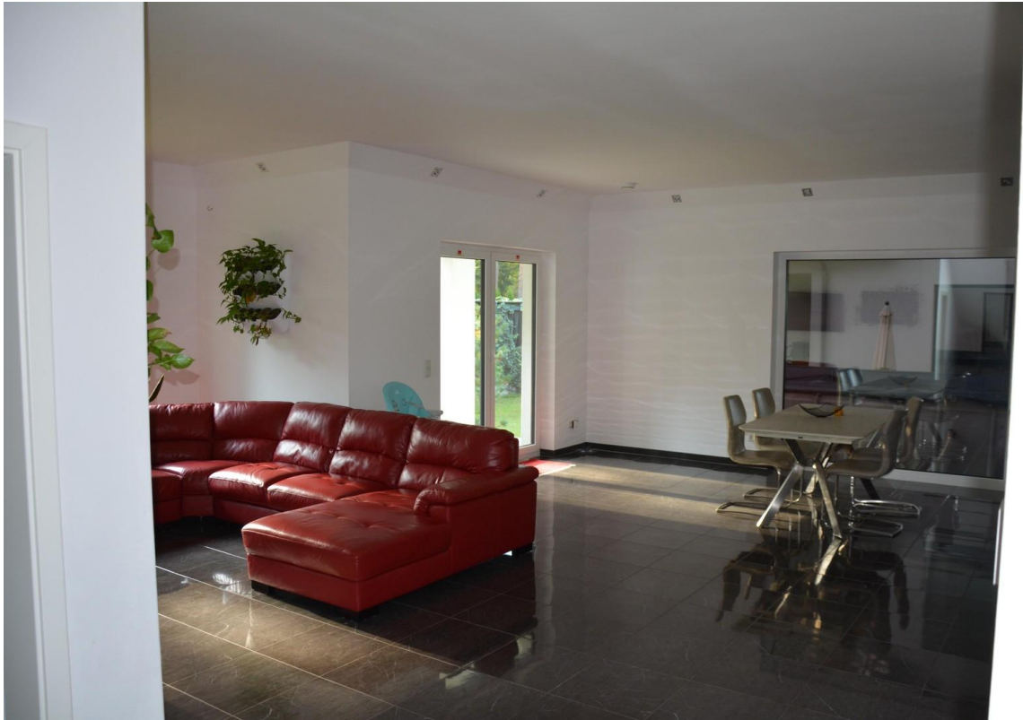
Wohnzimmer Haus 1