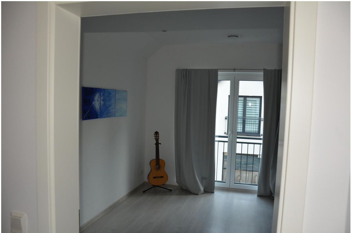
2. OG Büro Haus 2