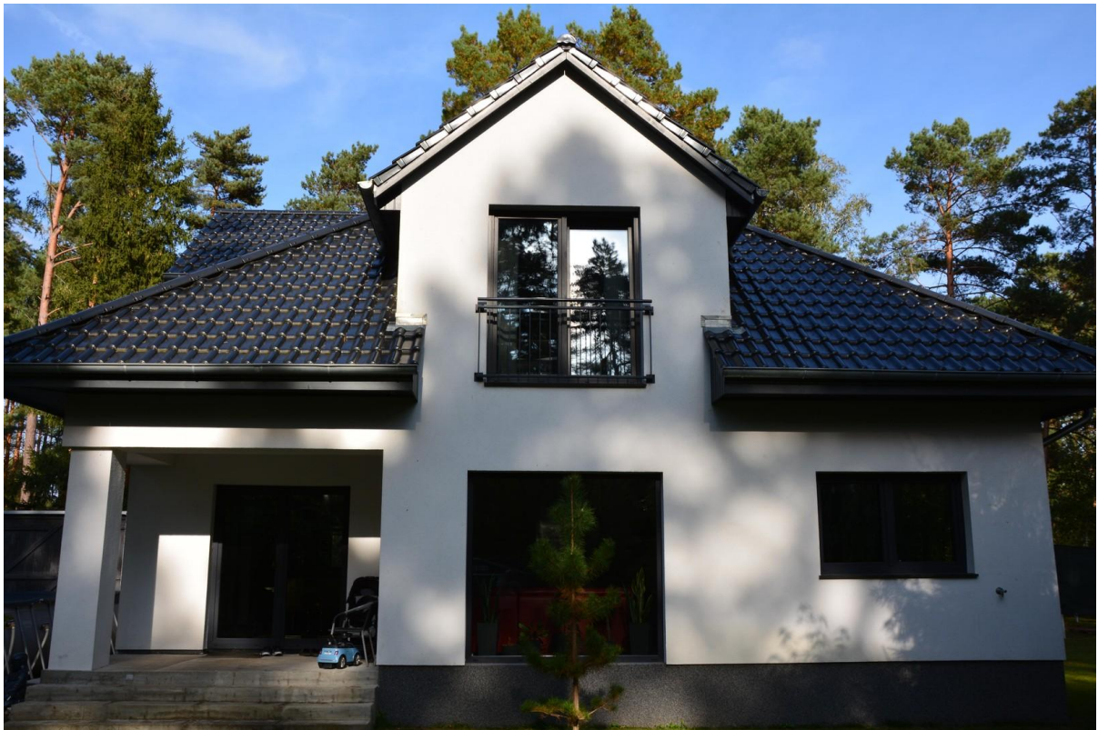
Haus 2 hinten