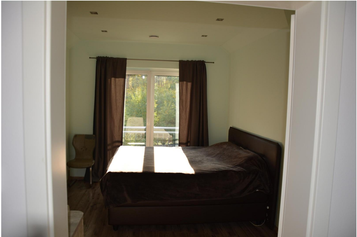
Schlafzimmer 2. OG Haus 1