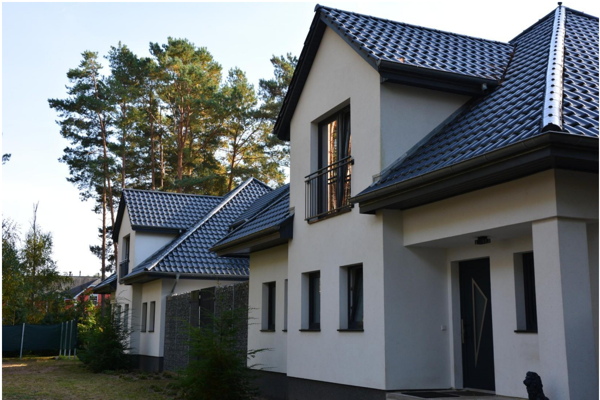
Haus 2 Blick zu Haus 1