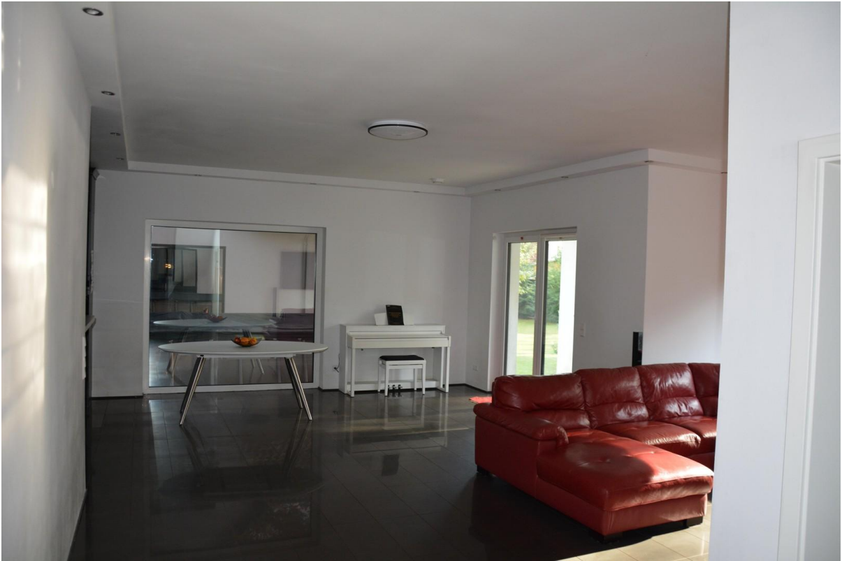
Wohnzimmer Haus 2