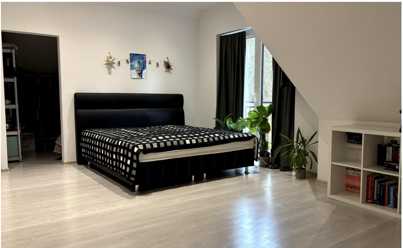
2. OG Schlafz. Haus 2