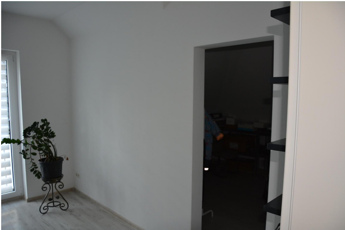
Büro 2. OG Haus 1