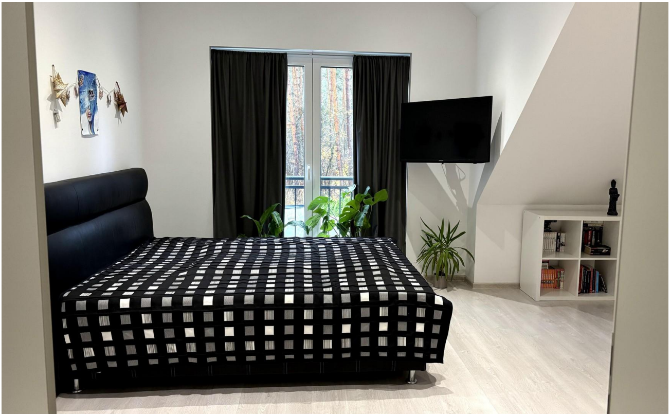
2. OG Schlafz. Haus 2