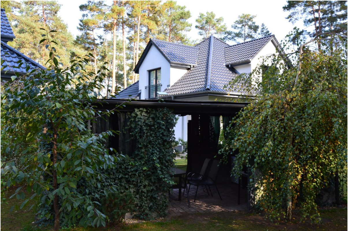
Haus 2 hinten