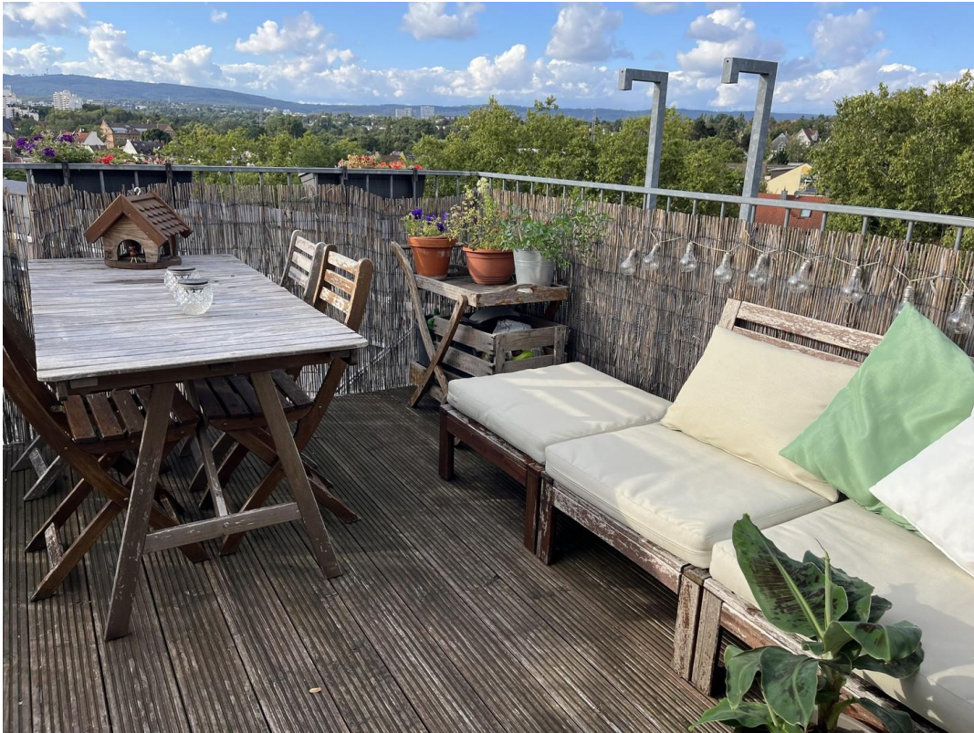
Dachterasse mit Ausblick