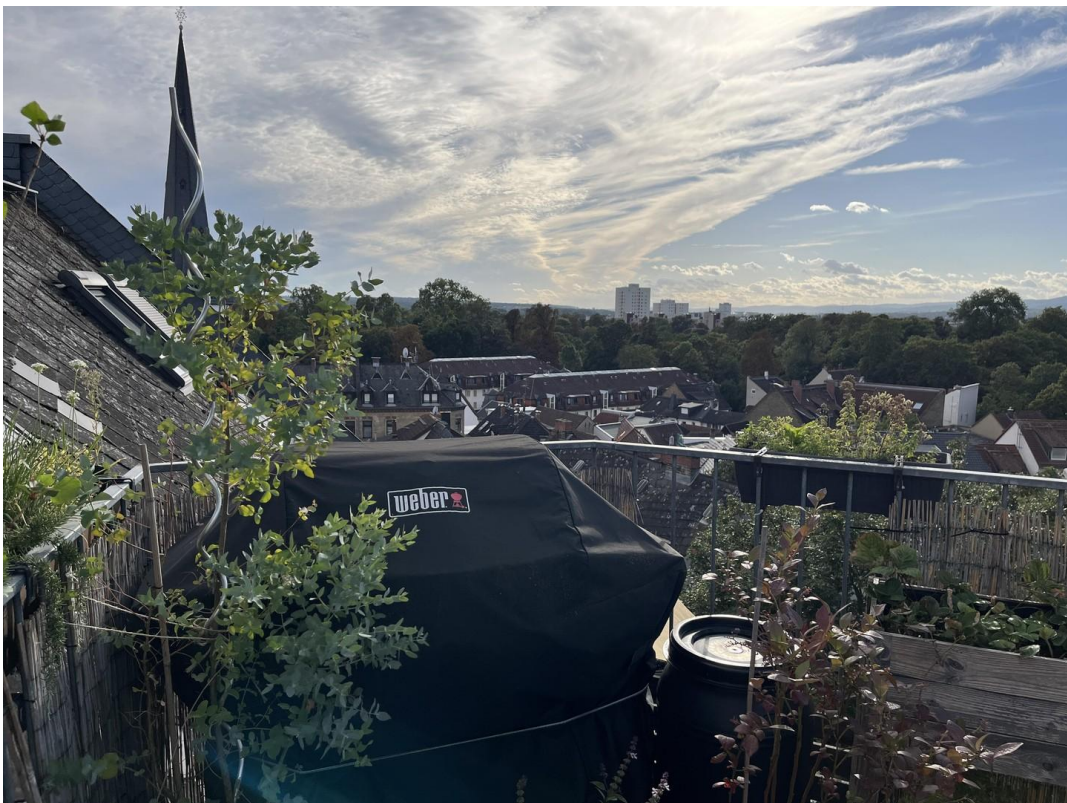
Dachterasse mit Ausblick