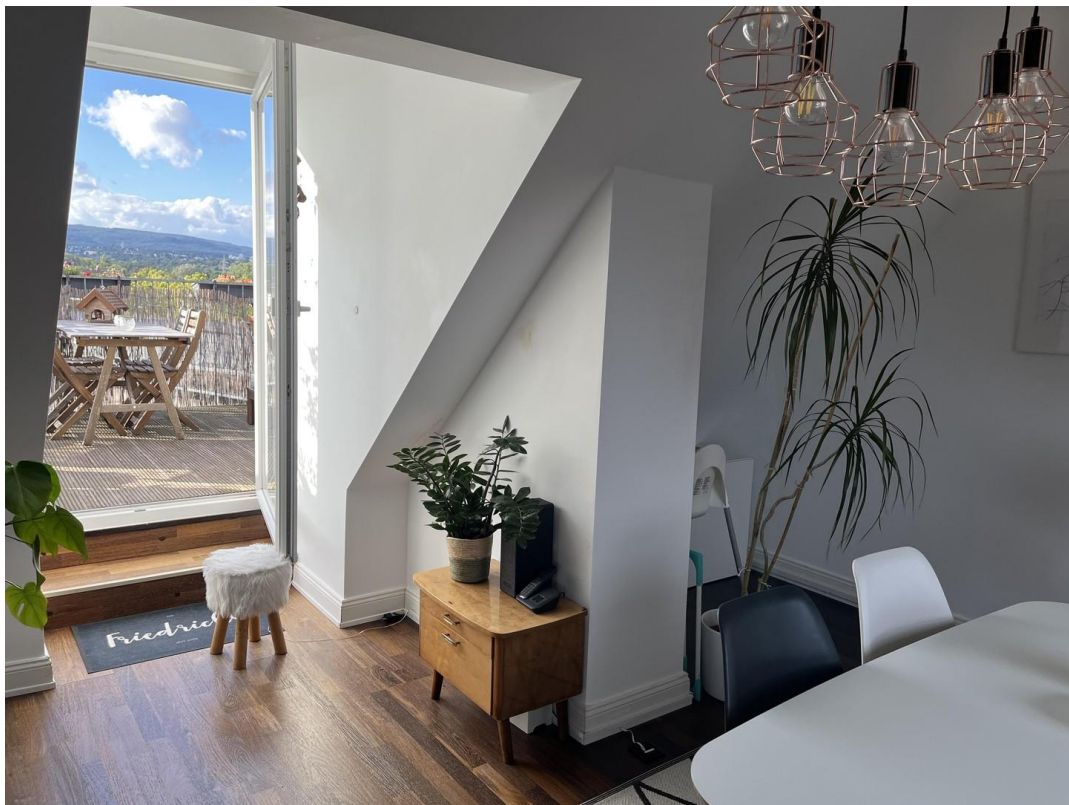
Wohn/Esszimmer mit Dachterasse