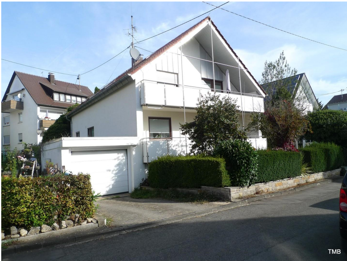
Hausansicht mit Garage