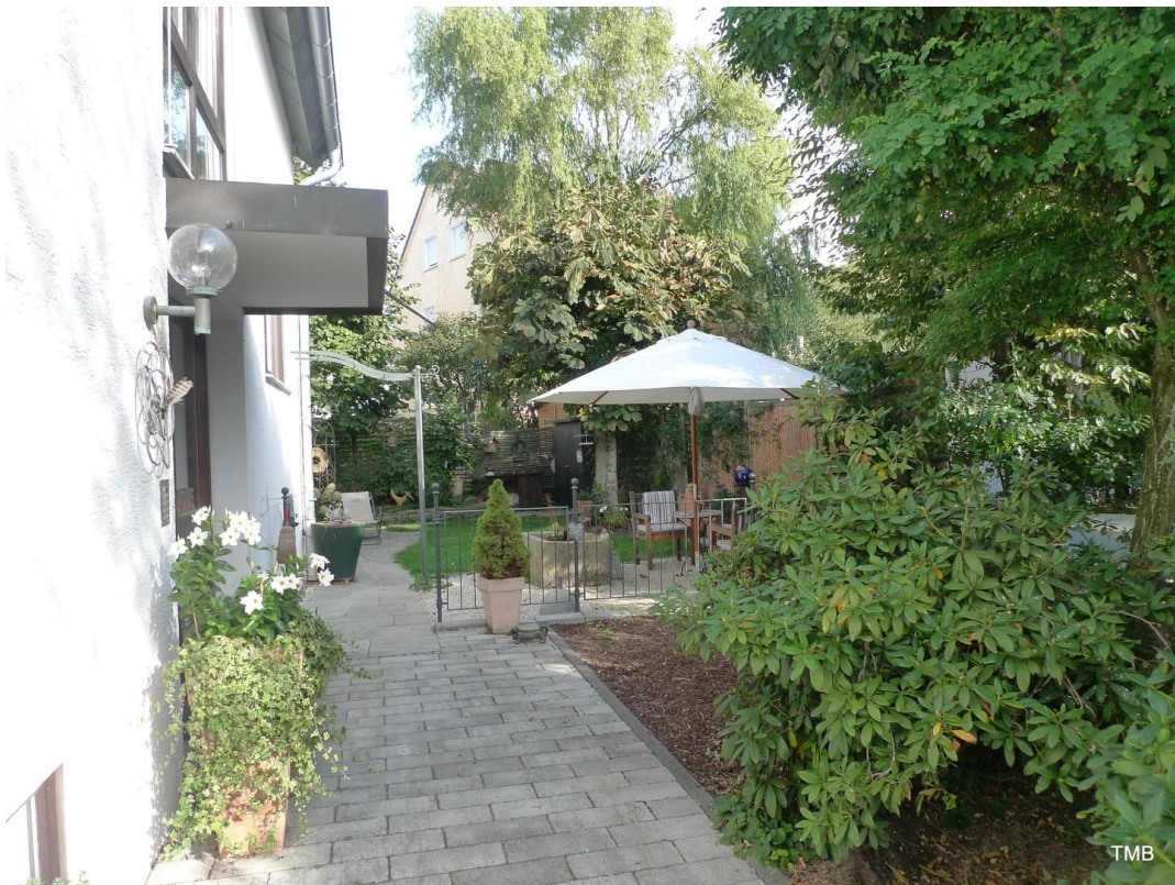
Eingang und Zugang Garten