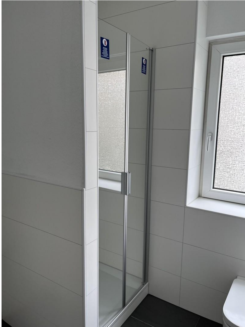
Badezimmer Ansicht 2