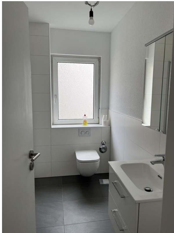
Badezimmer Ansicht 1