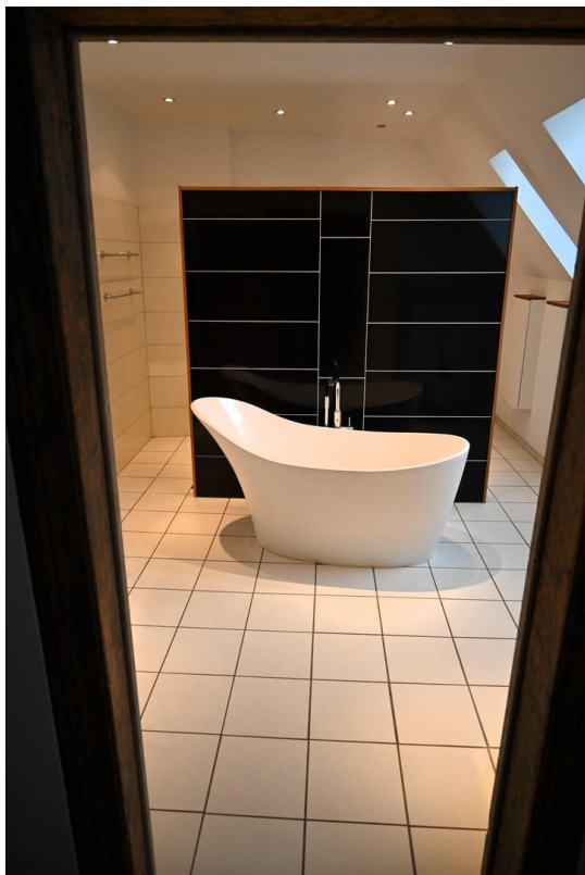
Großes Bad im 1. OG