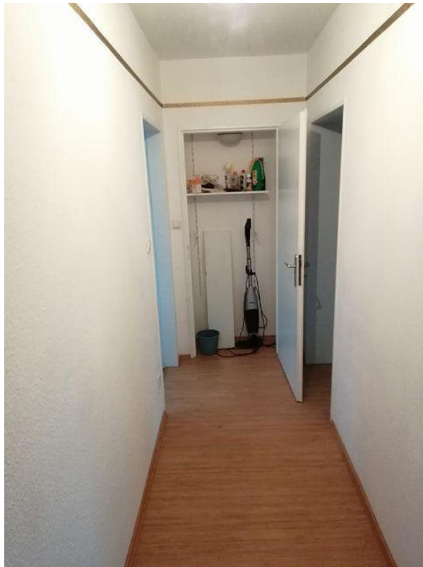
Flur mit Abstellkammer