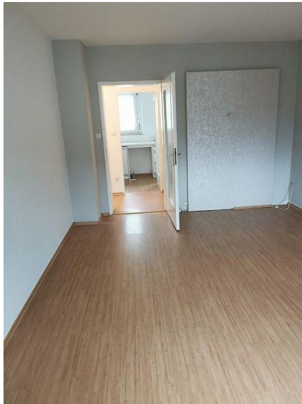
Wohnzimmer zur Kueche hin