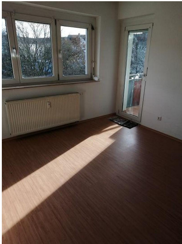
Wohnzimmer mit Zugang Balkon