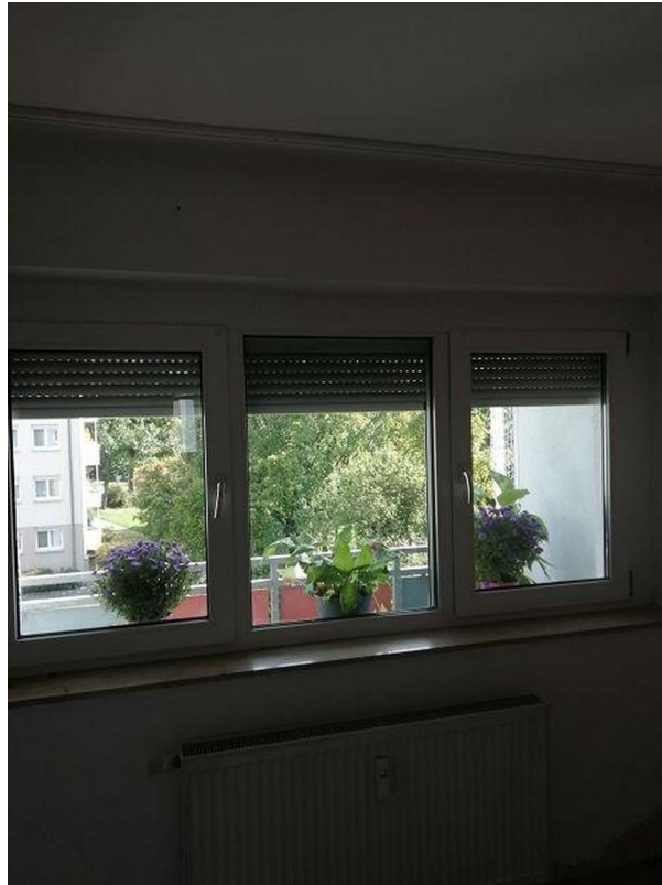
Blick aus dem Schlafzimmer