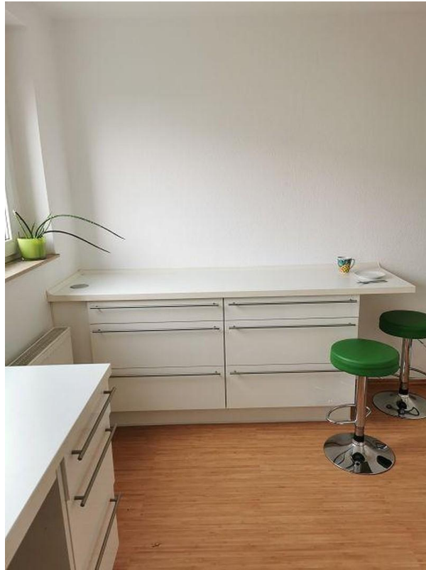
Kueche mit kleinem Essplatz