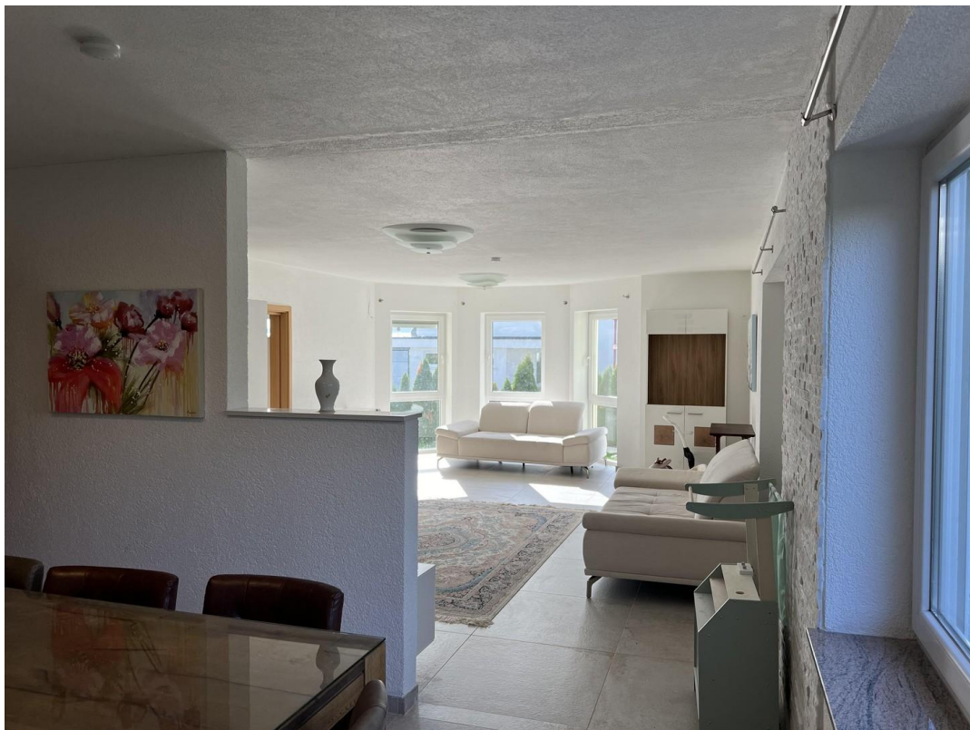
Ess- und Wohnzimmer EG